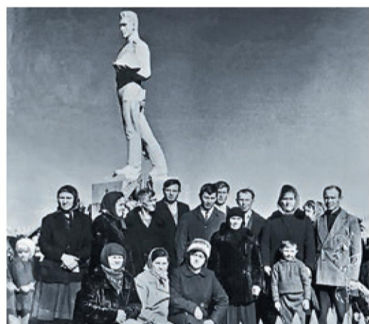
Открытие монумента состоялось полвека назад