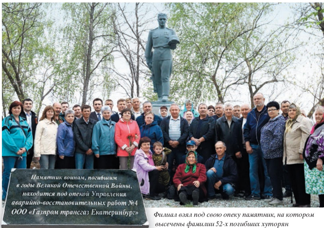
Филиал взял под свою опеку памятник, на котором высечены фамилии 52-х погибших хуторян