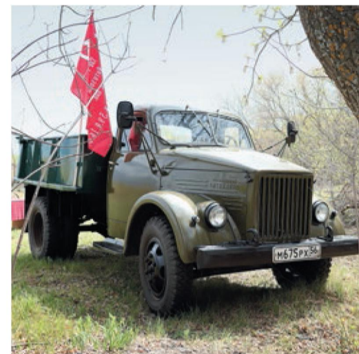
День Победы: выставка одного экспоната

В прошлом году мы рассказывали, какие работы были выполнены. После этого филиал взял монумент под свою постоянную опеку и вернул ему изначальное предназначение – быть местом поминовения погибших и местом для встречи тех, кто хранит эту память.