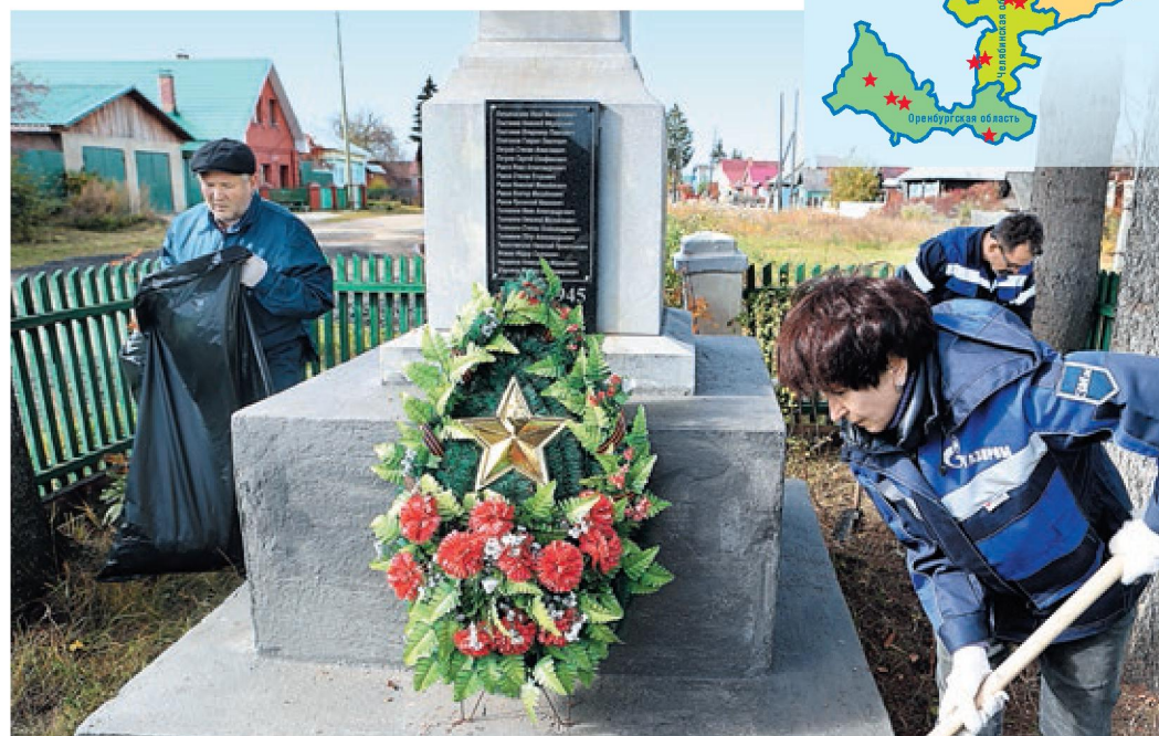
В Свердловской области более 1300 мемориалов и памятников творцам Великой Победы, один из них установлен в деревне Андреевка

Вместе с деревней Верхняя Боевка и селом Новоипатово до 2012 года она входила в Никольский сельский совет, а в 1965-м поселения составляли один большой колхоз. И двадцать лет спустя после победы памятники устанавливали сразу во всех его отделениях. В архивах местной газеты «Маяк», издающейся с начала 1960-х, мы обнаружили заметку, опубликованную от имени секретаря парторганизации колхоза. В ней он рассказал, как в праздник на центральной площади Новоипатово собрались его жители. Но речь в статье идет не только об одном селе, партработник написал обо всем хозяйстве.