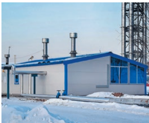
От котельной получает тепло и соседняя АГНКС

Вместо выработавших свой ресурс тепловых агрегатов установили четыре новых котла. Они имеют ту же мощность (по 1,85 Мвт каждый) и оснащены системой автоматического управления, технические требования к которой в свое время разработали специалисты нашего ИТЦ. По команде «Пуск» САУ выполняет полную самодиагностику: проверяет давление газа на входе в горелку, работоспособность клапанов и механизма розжига, наличие тяги, а также то, что вода циркулирует в котле под необходимым