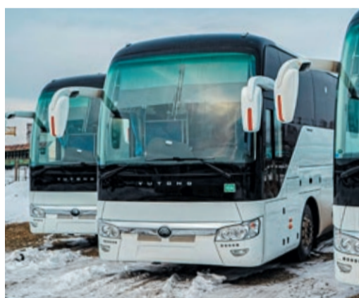
Газовые «Ютонги» заменяют дизельные автобусы

Еще одна партия более компактных 25-местных отечественных автобусов производства Павловского автозавода доехала в наступившем году. Как рассказали в транспортном отделе, «ПАЗы»