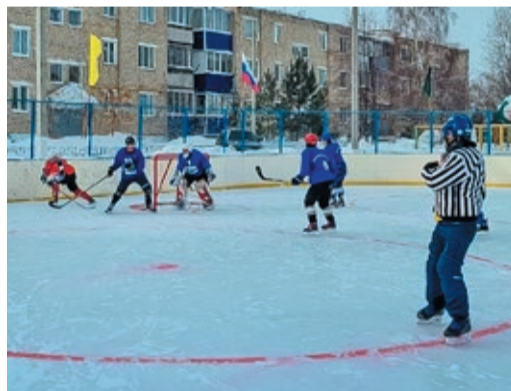
В Оренбуржье сражались на открытом льду

Региональные турниры по хоккею с шайбой в рамках первенства предприятия прошли в прошлые выходные на двух площадках. Всего в состязаниях приняли участие семь дружин, представивших более десяти филиалов. Так, в поселке