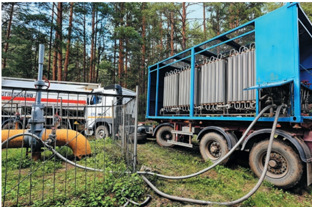
Сколько будет точек подключения регазификационного оборудования, зависит от почасового расхода газа на данном объекте

Подходящим решением стала технология временного газоснабжения с применением сжиженного природного газа. Первый комплекс по сжижению был построен и запущен в работу на автомобильной газонаполнительной станции Первоуральска в 2001 году. Он предназначался для снабжения санатория «Озеро Глухое», и только четыре года спустя для СПГ нашли еще одно применение. В июне 2005-го на время огневых по врезке отвода к ГРС «Кыштым» в Челябинской области люди впервые получили газ из цистерны. А до конца года новую технологию успели применить еще на трех комплексах, проходивших в Свердловской области.