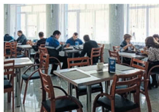
В обеденном зале отремонтированной столовой

В прошлом году на предприятии профинансировали дооснащение производственных помещений профессиональными моечными ваннами, а в декабре провели очистку и дезинфекцию систем вентиляции. Полностью завершился ремонт столовой на промплощадке Красногорского ЛПУМГ. Еще в 2021-м здесь собственными силами отремонтировали обеденный зал: заменили электропроводку, системы водоотведения и тепло-