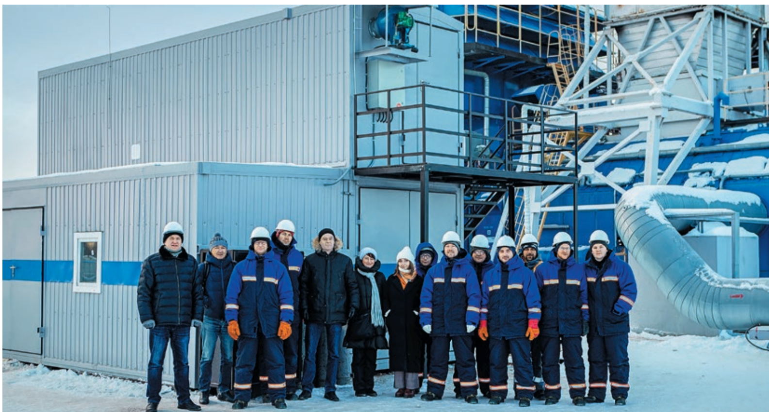
В приемочных испытаниях на промплощадке КС «Шатрово» приняли участие представители ПАО «Газпром», Инженерно-технического центра и администрации предприятия, научно-исследовательских институтов