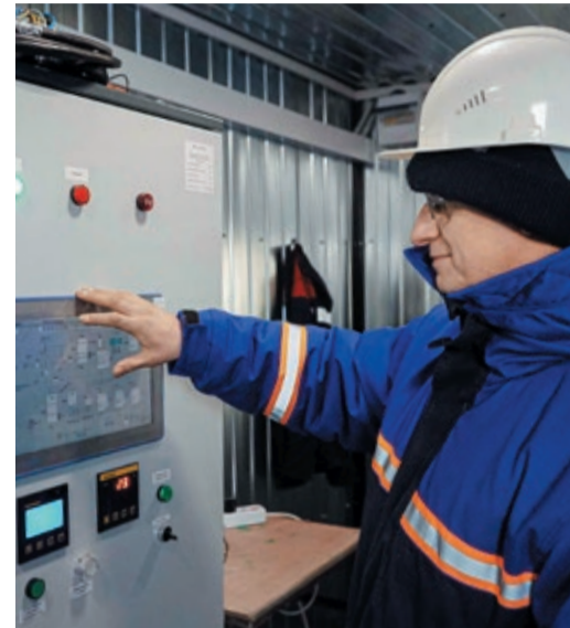
На блоке управления пилотной установки

Во время испытаний состав полученных веществ проверили на хроматографе. Анализ подтвердил, что концентрация метанола и диметилэфира в продуктах реакций высокая (около 95%). Производительность пилотной установки — 149 г метанола и 104 г диметилэфира в час.