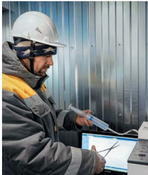
Хроматограф показал, что получены органические соединения высокой чистоты

Установка состоит из двух основных частей. В блоке электролиза из влажных дымовых газов выделяется водород, необходимый для проведения дальнейших химических реакций, и чистый кислород. Во втором блоке размещены химические реакторы, в которых синтезируют вторичные энергоносители.