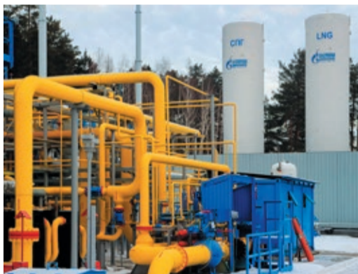
Основным поставщиком сжиженного газа сейчас является комплекс на ГРС-4 Екатеринбурга

В прошлом году один из самых крупных комплексов проходил на отводе к городам Верхний Уфалей и Вишневогорск в зоне ответственности Челябинского ЛПУМГ. Диаметр газопровода здесь сравнительно небольшой (325 мм), но от него запитаны три ГРС, поставляющие газ населению и крупным предприятиям — Вишневогорскому ГОКу и Уфалейскому заводу металлургического машиностроения. До конца 2023 года в рамках территории опережающего социально-экономического развития здесь запланировано запустить еще один — цинковый электролизный завод мощностью до 120 тыс. тонн в год. Так что откладывать ремонт было нельзя.