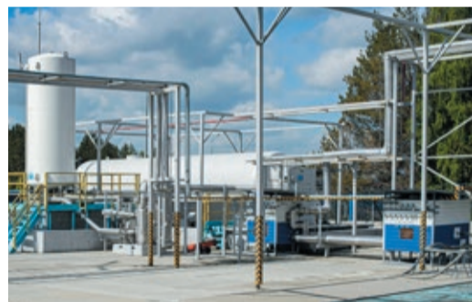
Для первых ремонтов СПГ везли из Первоуральска

В Обществе быстро оценили преимущества «мобильного» газоснабжения. Это упрощает планирование работ, стало легче согласовывать даты с муниципальными властями. Но производительность первоуральского комплекса первоначально составляла всего 300 кг/ч (после модернизации — 800 кг/ч), а в приоритете оставалось «Озеро Глухое». Позже добавился поселок Староуткинск, который тоже газифицировали с помощью СПГ. Потенциал расширился, когда построили еще один комплекс на ГРС-4 в Екатеринбурге мощностью 3 т/час. С тех пор практически ежегодно увеличивается и количество ремонтов с применением СПГ, и его объемы.