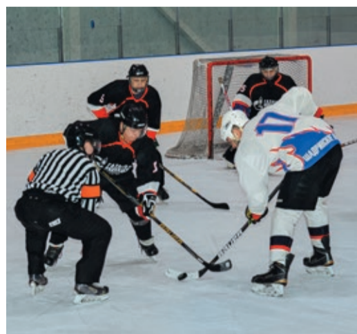
В Шадринске команды скрестили клюшки на крытой арене

Алексей ЗАЙЦЕВ Фото предоставлены филиалами