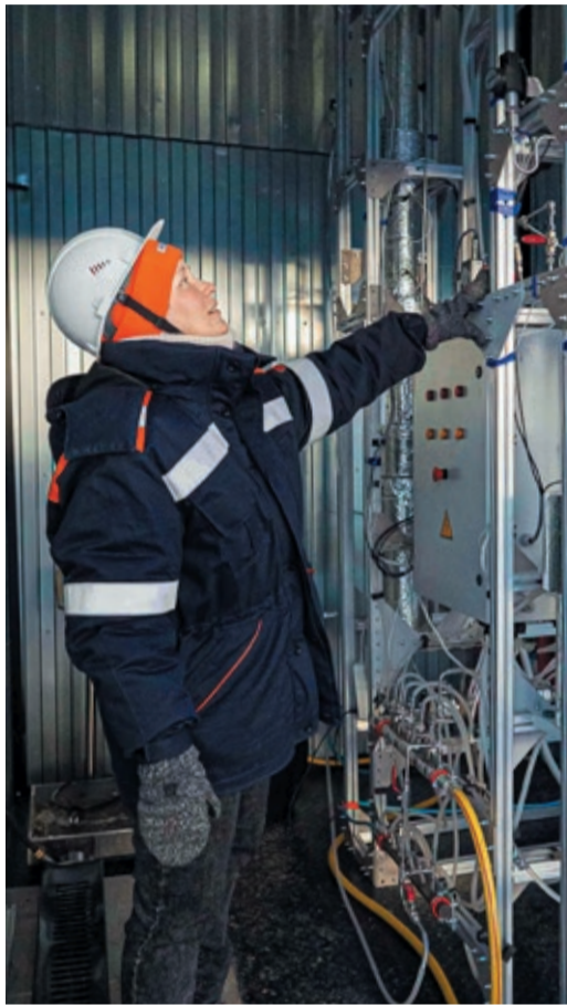
Реакторы синтеза метанола и диметилового эфира и их разделения

Трубопроводный газ проходит тысячи километров, прежде чем попадет с месторождения до конечного потребителя. Прокачать по магистралям большие объемы на огромные расстояния невозможно без потери давления. Поэтому на всем пути следования газопроводов строятся компрессорные станции, оснащенные газоперекачивающими агрегатами.