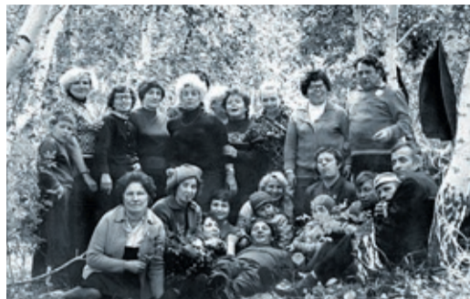
Будни и праздники: магнитогорцы всегда жили дружно

До начала 1960-х годов промышленный Урал только мечтал о масштабной газификации, а относительно небольшие объемы попутного газа с нефтепромыслов Башкирии транспортировались лишь по территории республики. И единственной ниткой, которая протянулась за восточные отроги Каменного пояса на юг Челябинской области, стал газопровод диаметром 500 мм «Шкапово – Ишимбай – Магнитогорск». Для его обслуживания в 1959 году было образовано Магнитогорское райуправление, которое позже вошло в состав УМГ «Бухара – Урал». Вот так исторически сложилось, что магнитогорский филиал, недавно отметивший свое 60-летие, на пять лет старше самого Общества.