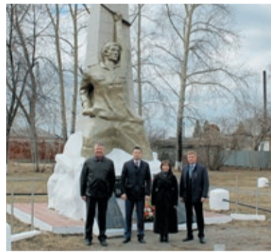
Газовики Малоистокского ЛПУМГ полностью подготовили мемориал в населенном пункте Щелкун Сысертского района, расположенном примерно в 70 км от Екатеринбурга, откуда 9 Мая начнет шествие Бессмертный полк села