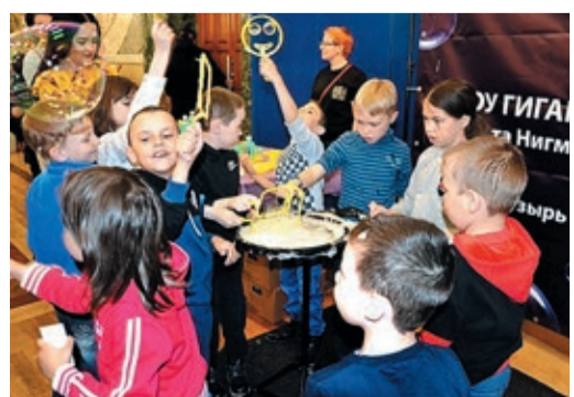
Газовики подарили детям кусочек яркой и счастливой жизни

Напомним, что сотрудничество с детским домом началось в прошлом году в рамках акции «Магистраль добра», инициатором которой выступил Совет молодых ученых и специалистов Общества. Тогда молодые специалисты филиала также объявляли сбор средств и на вырученные деньги приобрели для нужд детдома микроволновку и другую бытовую технику.