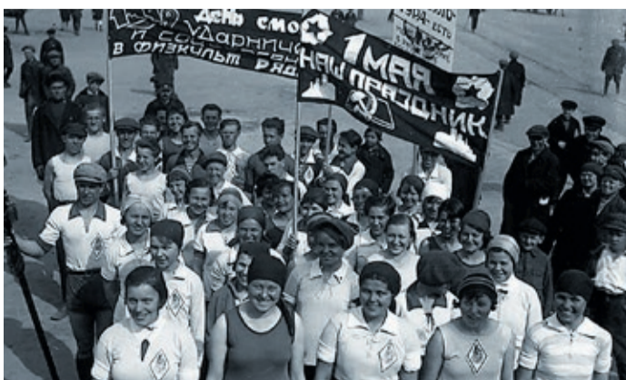
Первомай в Свердловске: 1929–1930-е гг.