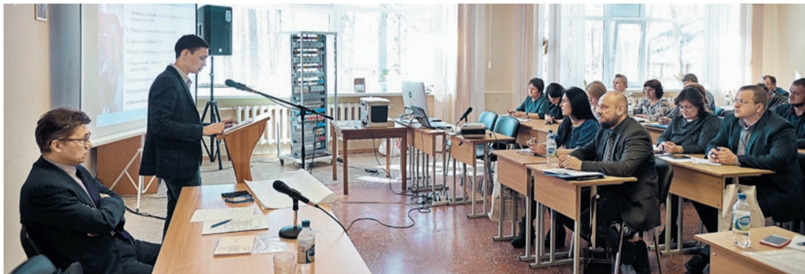
Метрологический семинар – это и учеба, и общение, и доклады по самым важным направлениям работы

Кроме чтения лекций, на семинаре нашлось время для проверки навыков обращения с измерительными устройствами. Не электронными датчиками, а простыми линейками и штангенциркулями.