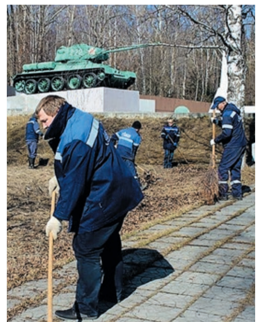
Ремонтники УАВР №3 приняли участие в благоустройстве двух мемориалов – солдатам, умершим от ран в госпиталях г. Первоуральска в период Великой Отечественной войны (1941–1945 гг.), и воинам, павшим на полях сражений