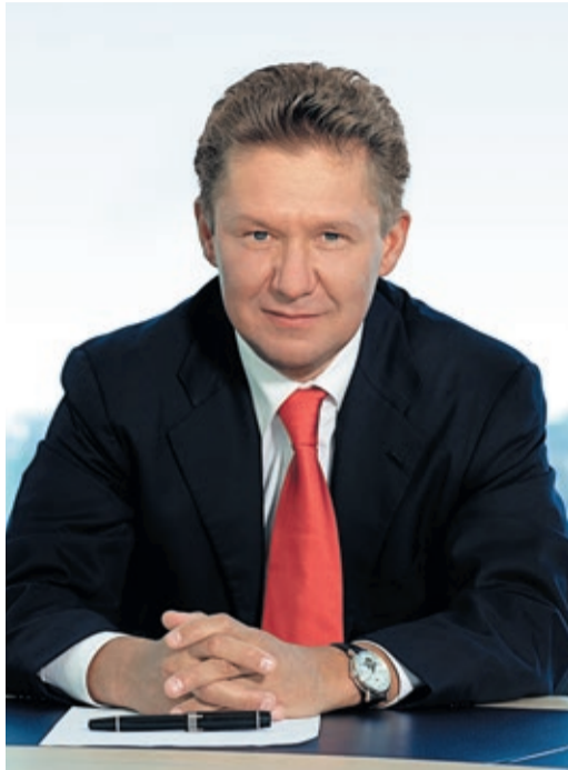
Председатель Правления ПАО «Газпром»