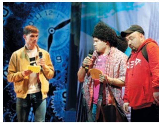
На Школу приехало много новичков, громко заявили о себе специалисты ИТЦ (на фото слева)

из ИТЦ: недавно пришедшие в Центр инженеры порадовали вокальными данными. Если до осени они сумеют добавить к этому хорошую порцию сценического драйва и щепотку здоровой наглости, то нас