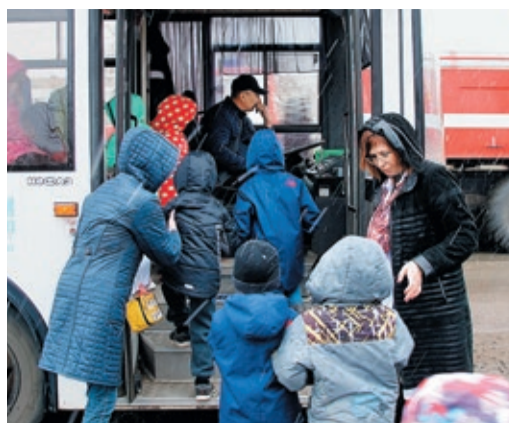
Все дети эвакуированы