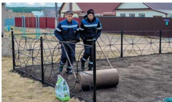
Подготовила Татьяна ПИСКУНОВА