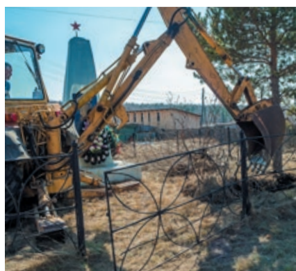
Коллектив Челябинского ЛПУМГ отреставрировал прилегающую территорию и памятник погибшим в годы войны, расположенный в деревне Шигаево Сосновского района