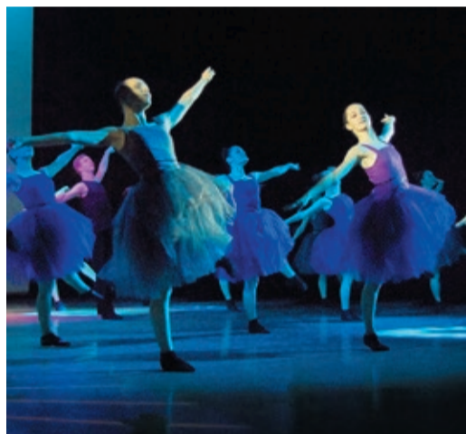
Украшением праздника стало выступление вокально-хореографической студии «Дети Магнитки», в которой занимаются дети работников филиала