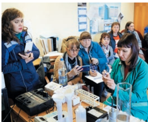
Экспресс-тест качества работы очистных сооружений

В филиалах Общества эксплуатируются сооружения разных типов, их общее число постепенно растет. Например, за последнее десятилетие построены автомойки с установками оборотного водоснабжения. На данный момент их 14. Кроме того, на ряде объектов используются нефтеловители и ливневые очистные сооружения. Однако на семинаре основное внимание уделили биологической очистке обычных, хозяйственно-бытовых стоков.