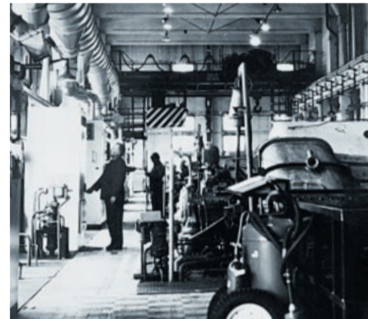
С 1968 по 1992 год Магнитогорская ГРС качала газ в сторону Башкирии

Михаил ЧЕРЕПАНОВ