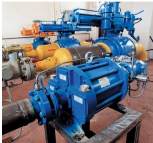
Турбодетандер практически полностью обеспечивает потребности ГРС-4 в электроэнергии