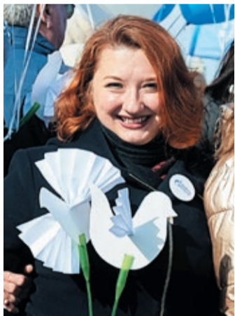
Один из символов праздника – белый голубь мира.