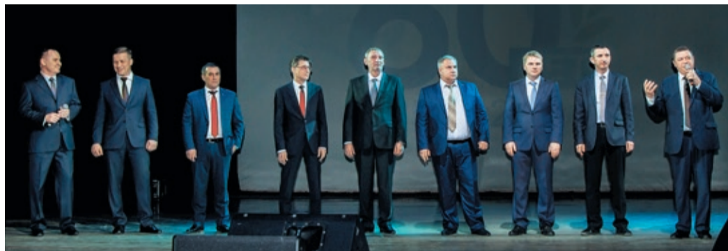
С юбилеем поздравляют руководители других филиалов

а вслед за первой ниткой отвода «Карталы – Магнитогорск» вскоре протянулась вторая. В 1968 году на западной окраине города построили компрессорную станцию, чтобы качать «бухарский» газ уже в Башкирию.