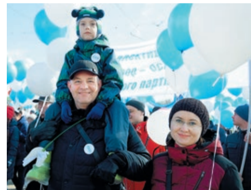
Для сотрудников Общества Первомай всегда был и по-прежнему остается семейным праздником. Не стал исключением и нынешний год.

– Первомай вошел в жизнь с детства, ведь все мы родом из СССР. Выходить на праздничное шествие было в порядке вещей, даже неким обязательным правилом. Меня на демонстрацию сначала брал отец, работавший водителем, потом я ходил с одноклассниками. Последний раз принимал участие в первомайском шествии несколько лет назад, работая в Ухте. Конечно, в Екатеринбурге масштаб другой, а массовости мероприятия и отличного настроения людям добавила солнечная погода. Еще раз всех с праздником!