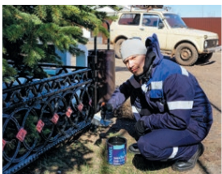
Персонал Оренбургского ЛПУМГ облагородил памятник воинам-освободителям в селе Черноречье