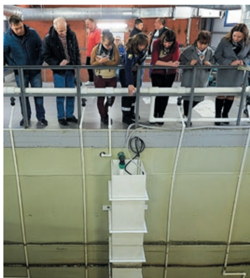
Экскурсия на «Биосетблок – 300»