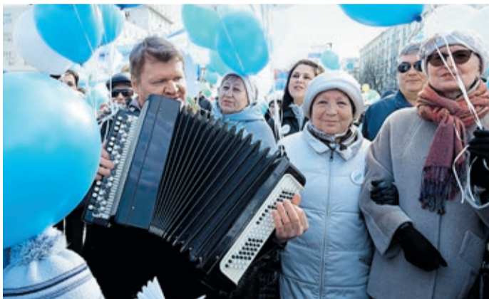
До главной площади с гармонью: музыкальным центром колонны в Екатеринбурге стал гармонист. Газовики с удовольствием подпевали и приплясывали.