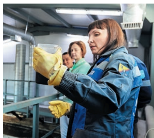
Прозрачность воды можно определить без приборов

Также в ходе семинара было организовано посещение действующего очистного сооружения «Биосетблок-300» управления эксплуатации зданий и сооружений в поселке газовиков Токарево. В 2017 году здесь была закончена реконструкция, и теперь это самый современный очистный комплекс на предприятии. Участники семинара не просто познакомились с его работой, но и выполнили самостоятельно ряд полевых биохимических исследований. Преподаватель рассказала, как правильно брать пробы, как измерять содержание кислорода в воде, уровень pH (активность ионов водорода) и другие параметры. Также с помощью портативных приборов участники провели фотометрические исследования ила на содержание марганца, хлора, ионов металлов, нитратов и фосфатов. Сейчас устройства для экспресс-анализа поступают на трассу,