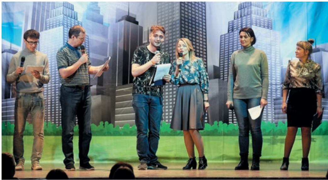
Гранды учебного фестиваля, выигравшие «Неправильный кубок»