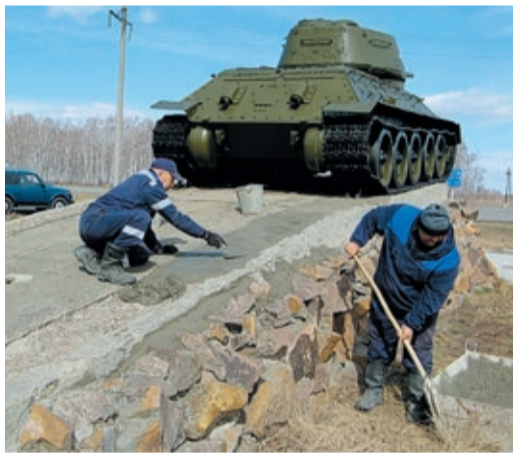
Сотрудники Далматовского ЛПУМГ по традиции облагородили танк Т-34-85, установленный на постаменте на перекрестке автодорог Шадринск – Миасское и Далматово – Уксянское

В конце апреля температура на Урале в отдельных регионах понизилась до –7 градусов. В Свердловской области за один день выпала почти месячная норма осадков: сначала шел дождь, к нему добавился мокрый снег, переросший в обильный снегопад. Высота снежного покрова достигла 30 см. непогода не остановила уральских газовиков. В преддверии приближающейся 74-й годовщины Великой Победы они вышли на субботники: убрали мусор, облагородили захоронения и прилегающую территорию, провели косметический ремонт и реставрационные работы отдельных фрагментов обелисков, памятников и мемориалов.