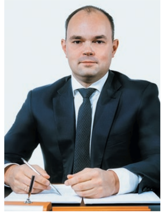
Генеральный директор ООО «Газпром трансгаз Екатеринбург»

В этот светлый и праздничный день хочу пожелать всем крепкого здоровья, мира, добра, благополучия и ясного неба! С Днем Победы!