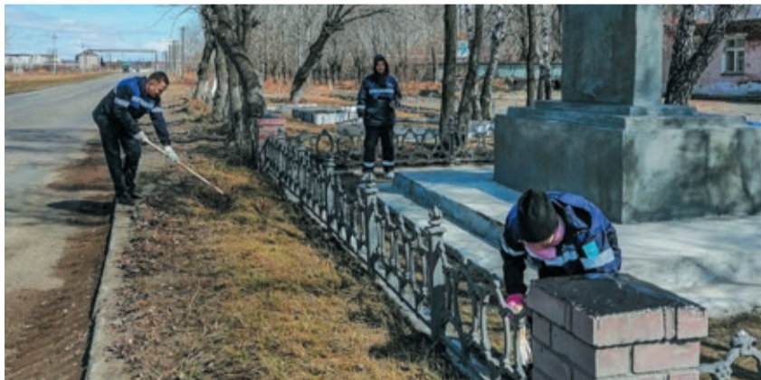
Работники Шадринского ЛПУМГ привели в порядок обелиск воинам одного из районных предприятий, погибшим за свободу и независимость нашей Родины в 1941–1945 гг.