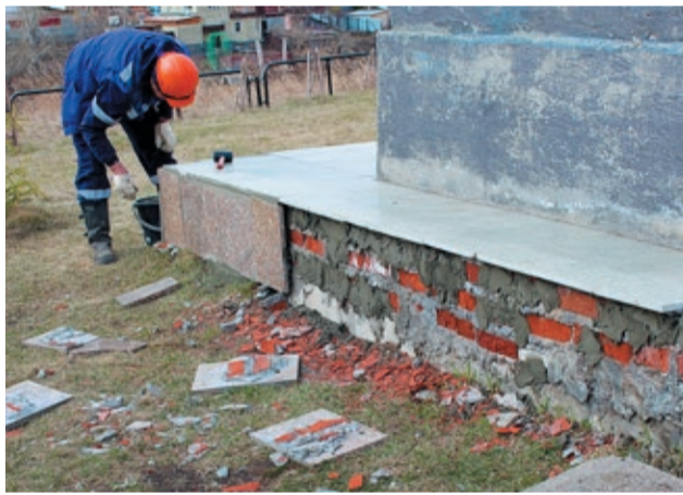
Ремонтники УАВР №1 продолжили масштабные работы по восстановлению Аллеи Победы у начальной школы села Долгодеревенское, где расположен памятник учителям и первым выпускникам: все они ушли добровольцами на фронт и погибли