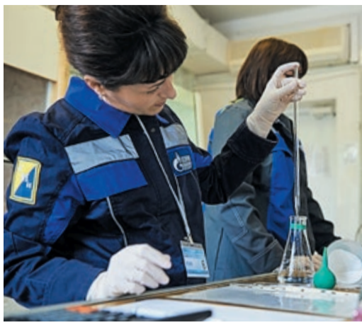
Свою компетентность лаборанты химанализа филиалов подтвердили на конкурсе профессионального мастерства

Исследовательская лаборатория должна регулярно подтверждать свою компетентность. Очередная проверка была назначена Росаккредитацией в конце прошлого года. В качестве проверяющих выступили специалисты «Урал-ЭкспертСервиса». Сначала прошла документарная проверка: дистанционно членам экспертной группы были предо-