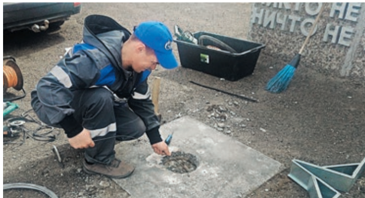
В преддверии 74-й годовщины работники Далматовского филиала также взялись за восстановление Вечного огня у мемориального ансамбля в селе Верхняя Теча Катайского района