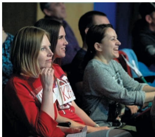
Зрители искренне болели за все команды