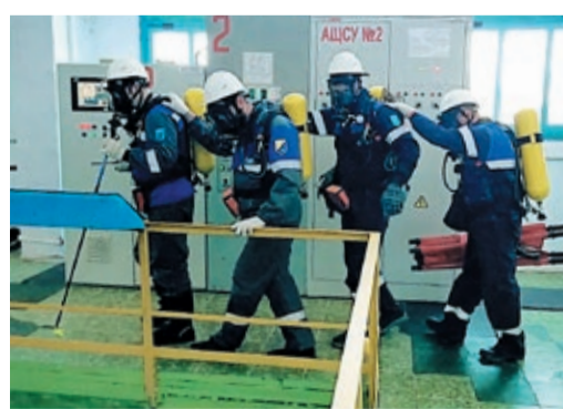
Четверка газоспасателей, надев защитные дыхательные аппараты, отправляется на разведку

Четверка газоспасателей должна провести разведку в задымленном помещении. Главная задача – на месте оценить обстановку, постараться обнаружить и эвакуировать возможных пострадавших. Пятый член звена остается на базе и по рации корректирует действия коллег. Выйдя из помещения, газоспасатели докладывают руководству результаты разведки, после чего в дело вступает ДПК. С помощью двух «рукавов» пожарные начинают охлаждение объектов. Один