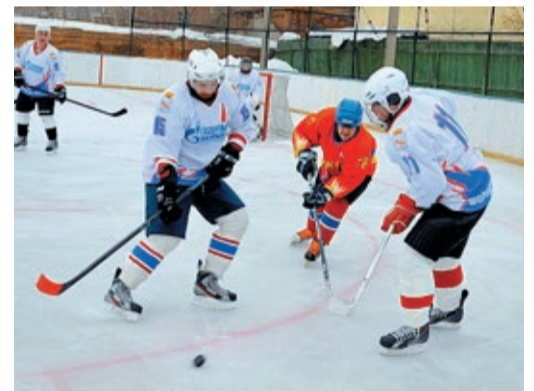
...и вышел на уровень всего предприятия