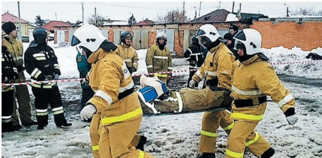
За любое неправильное действие, которое может повлечь нанесение травмы пострадавшим, начисляются штрафные баллы

Первый этап соревнований на звание лучшей команды отряда федеральной противопожарной службы по Курганской области при проведении аварийно-спасательных работ по ликвидации последствий дорожно-транспортных происшествий прошел в марте на территории пожарно-спасательной части № 10 в г. Шадринске. В нем приняли участие девять команд: восемь профессиональных, представляющих пожарные части и спасательный отряд города Шадринска, и одна добровольная, из Далматовского линейного управления. Газовики-добровольцы впервые состязались вместе с профессионалами и показали высокий уровень подготовки.