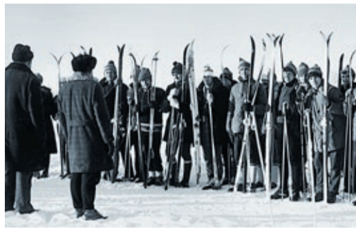
Дух соревновательности зародился в линейных управлениях...