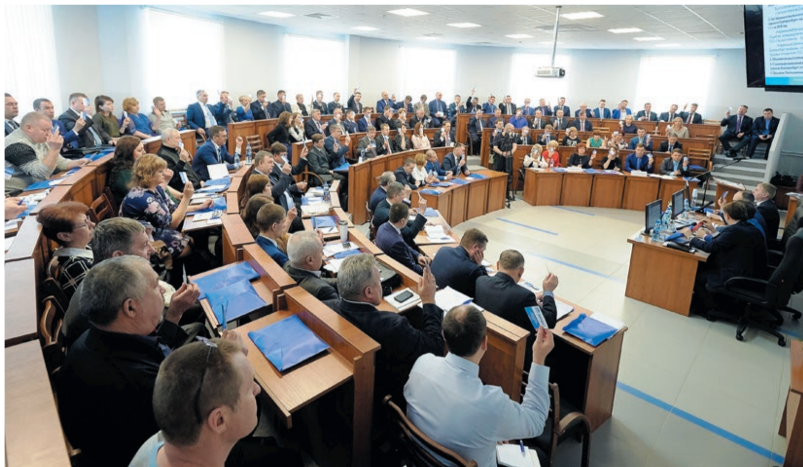
Конференция по выполнению обязательств Коллективного договора впервые проходила в Центре развития инженерных компетенций

20 марта в Центре развития инженерных компетенций состоялась конференция по проверке выполнения обязательств Коллективного договора ООО «Газпром трансгаз Екатеринбург» за 2018 год. В мероприятии приняли участие более ста делегатов, которые представляли все без исключения филиалы предприятия.