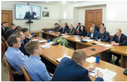
О готовности к паводку руководители филиалов Общества докладывали по видеосвязи