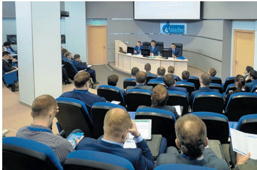
ООО «Газпром трансгаз Екатеринбург» не случайно выбрано площадкой для обсуждения новой системы: наши специалисты выполнили большой объем работы на этапе ее опытной эксплуатации

Благодаря серьезной подготовке, которая прошла на всех уровнях, в октябре 2015 г. постановлением Правления ПАО «Газпром» была утверждена первая Программа комплексного капитального ремонта на 2016–2020 гг. В ее основе лежит метод ранжирования. С учетом состояния трубы, критичности дефектов, расположения магистралей и окружающих их объектов, а также множества других факторов этот метод позволяет расставить приоритеты и определить, какие