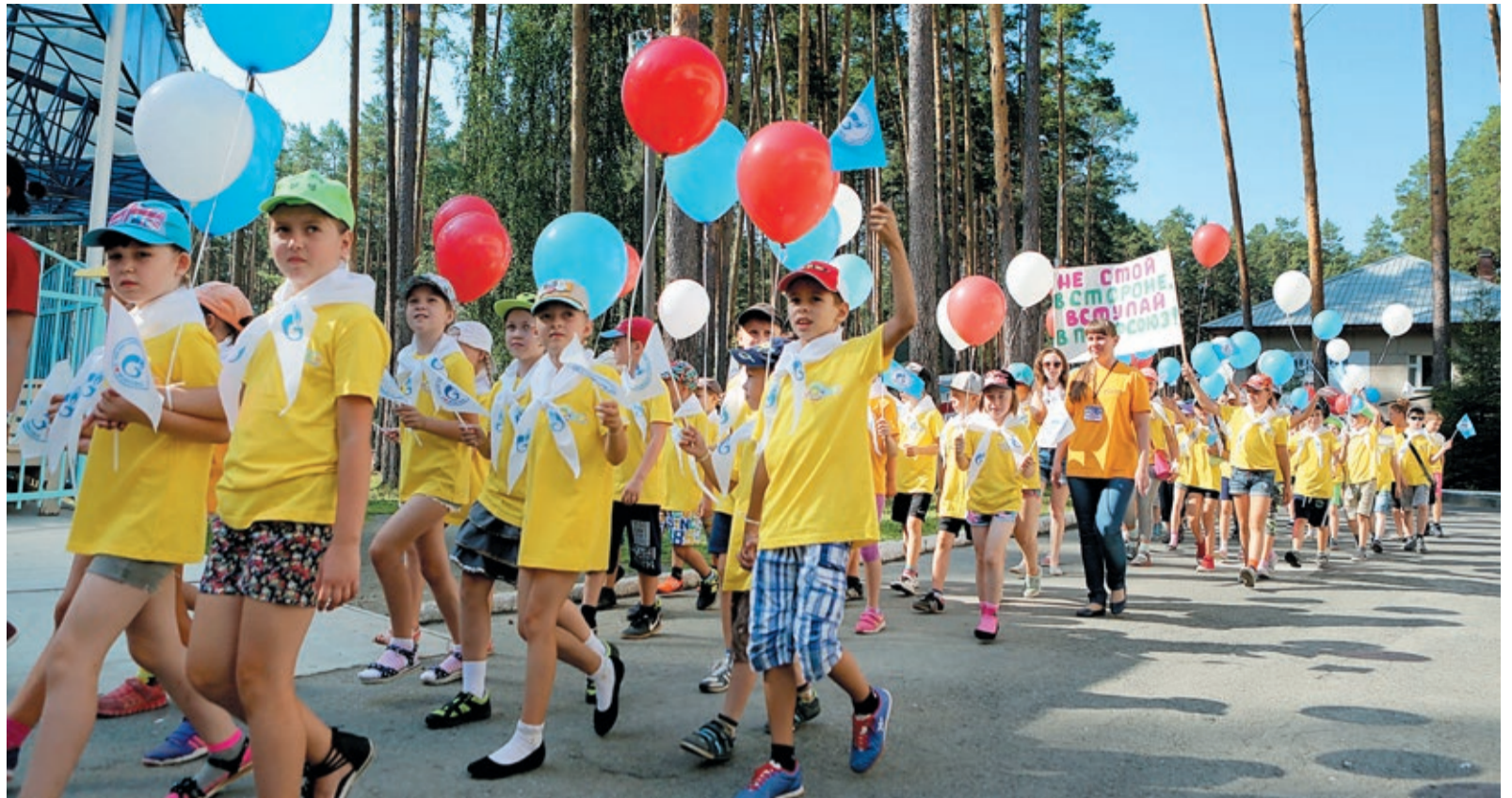
Знакомство с профсоюзом начинается с детского возраста: акция «Мы – будущее профсоюза» в летнем оздоровительном лагере «Прометей»

Весь 2019 год проходит в Обществе под знаком 55-летия, и в череде юбилейных мероприятий будет немало интересных и важных событий. Но вряд ли кто-то поспорит, что второй по значимости датой в этом юбилейном году можно считать день рождения профсо-