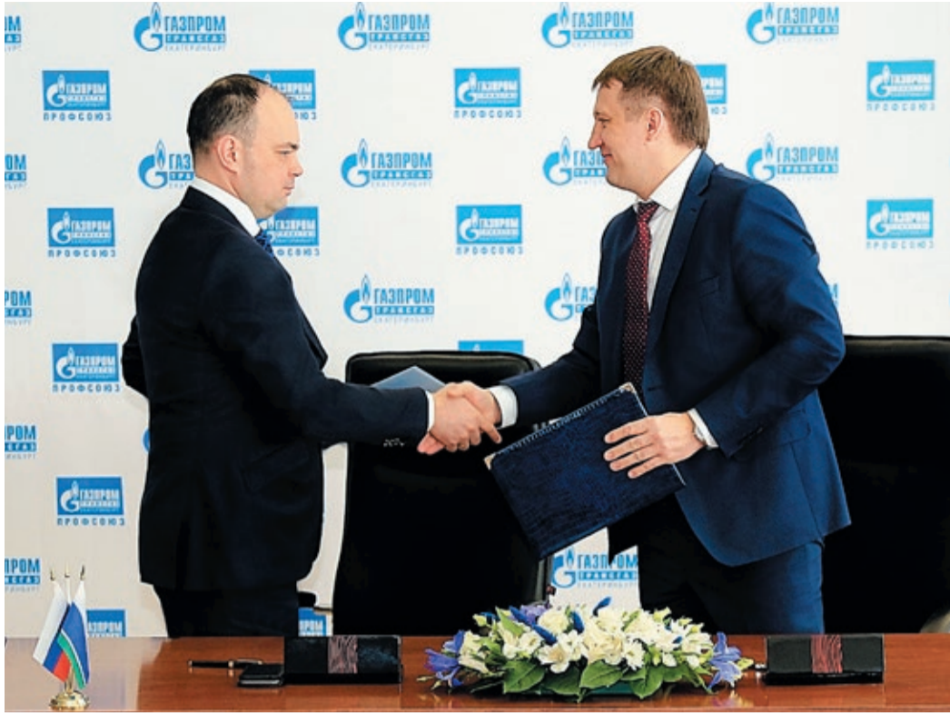
В прошлом году действие Коллективного договора продлено на очередной трехлетний период

Заключение Коллективного договора между администрацией и работникам и проверка его выполнения стали такими же обязательными и естественными атрибутами повседневности, как выполнение производственных планов по транспортировке газа, капитальному и текущему ремонту объектов газоснабжения и ежегодный отчет о проделанной предприятии работе на балансовой комиссии газовой компании.