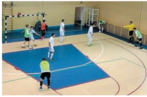
На старт сезона вышли сборные двух десятков филиалов

В другой «пульке» хозяйничали шадринцы. Во встречах с Красногорским и Магнитогорским управлениями они тоже пропустили четырежды, зато забили на мяч больше. Затем продолжили феерить в полуфинале, обыграв 15:2 спортсменов УАВР № 2. Совсем по другому сценарию сложились второй «стык», где Красногорск помотал нервы челябинцам, уступив совсем немного – 1:3.