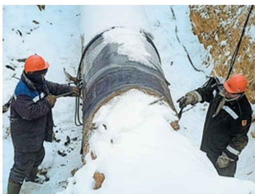
Чтобы быстро снять старую изоляцию, ее нужно хорошо «прожарить»

У геодезиста в руках навороченный немецкий GPS-приемник Leica, из-под шапки выглядывает кончик простого карандаша. Коллегам из челябинского отде-