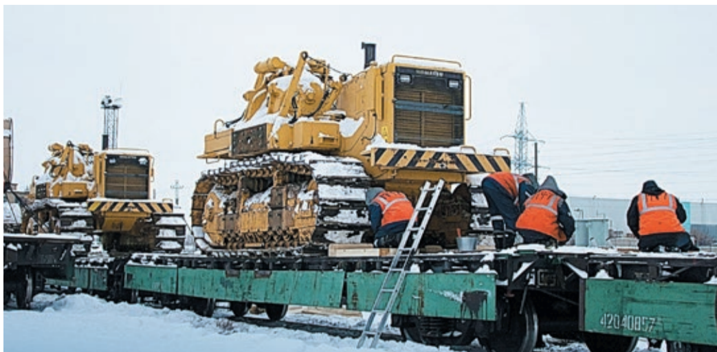
Оренбуржцы успешно опробовали альтернативный способ доставки тяжелой техники к месту проведения работ железнодорожным транспортом

Все бригады задействованы пока на участке с 9-го по 38-й км. Не считая капремонта, им предстоит «пролечить» около ста дефектных мест. И всего за две недели, потому что весна ждать не будет, и отдельные места вдоль трассы скоро превратятся в настоящее болото.