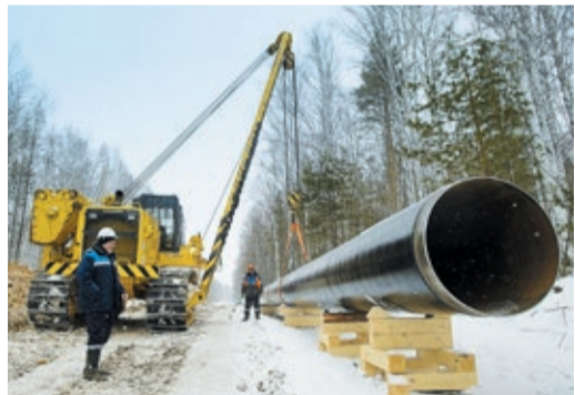
Работники УАВР № 4 капитально отремонтировали 430-метровый участок МГ «Свердловск – Сысерть»