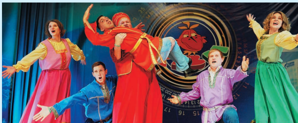
«Родничок» в исполнении «ИТЦ my life»