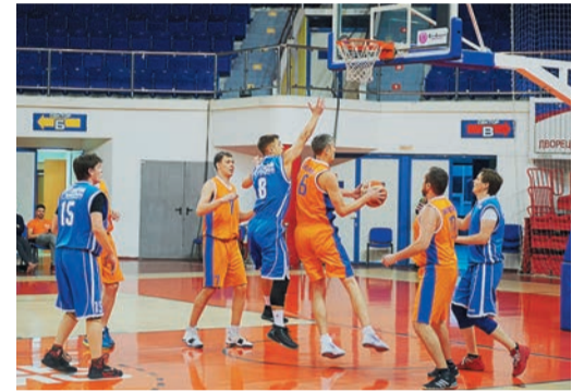
Баскетбольная сборная Общества (в синем) закончила свой турнирный путь с «бронзовыми» медалями

В соревнованиях по баскетболу на этот раз обошлось без плей-офф — медали разыгрывались в групповом турнире. Сборной Общества не повезло с жеребьевкой — уже на старте попался самый грозный