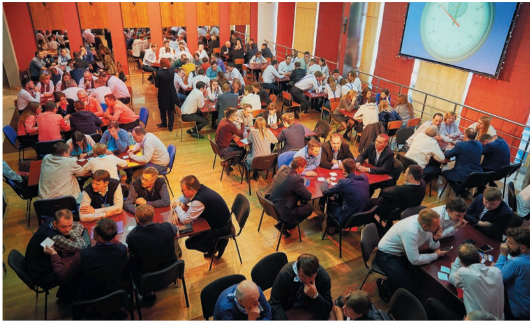
21 минута чистого времени потребовалась, чтобы определить победителя спортивной версии «Что? Где? Когда?»

А их визави в борьбе за лидерство встретились с дружиной Южноуральского управления охраны. Для тех, кто следит за всеми сезонами клуба интеллектуалов, эта встре-