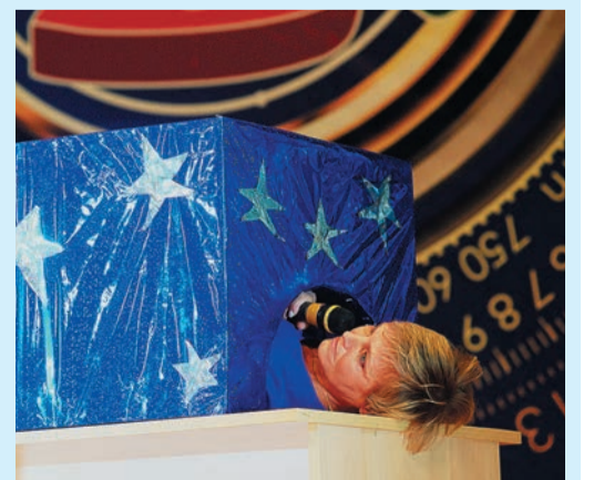
Смертельный номер челябинской «Не газуй!»