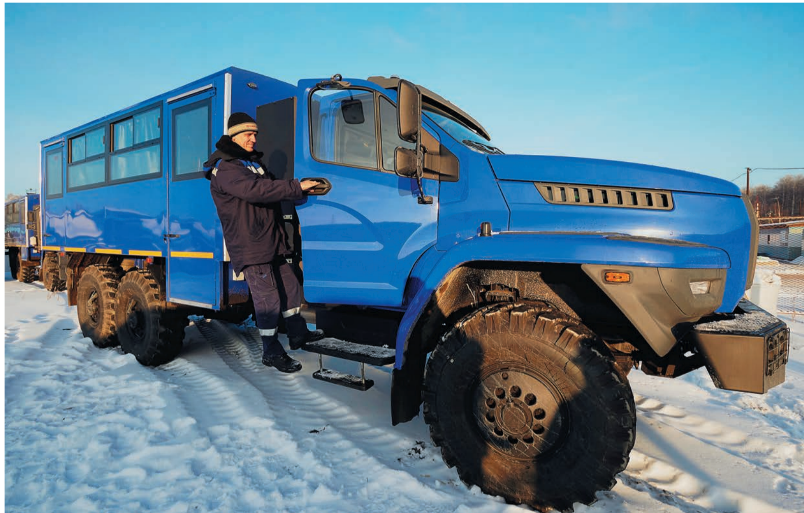
Газовые автомобили «Урал» и спецтехника на их базе сохранили высокую проходимость и стали комфортнее для водителя и пассажиров

2018-й газета «Трасса» начала с материала, рассказывающего о большом поступлении газомоторной техники, которое продолжалось весь предыдущий год, до самых новогодних праздников. Этим же и заканчиваем. Как говорится, путное начало приводит к путному концу.