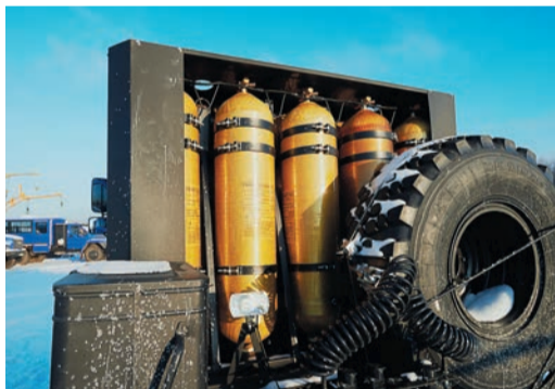
Техника оснащена газобаллонным оборудованием в заводском исполнении и двигателями Ярославского моторного завода, работающими на компримированном газе

Больше всего в тяжелой технике нуждаются управления аварийно-восстановительных работ. Серьезная потребность в обновлении автопарка УАВР вызвана совершенно конкретными причинами: низкий уровень исполнения заказов подрядными организациями заставляет отказываться от их услуг. С каждым годом объем ремонтов, выполняемых хозяйством, увеличивается, а последнее поступление партии тяжелой техники ремонтникам состоялось четыре года назад.