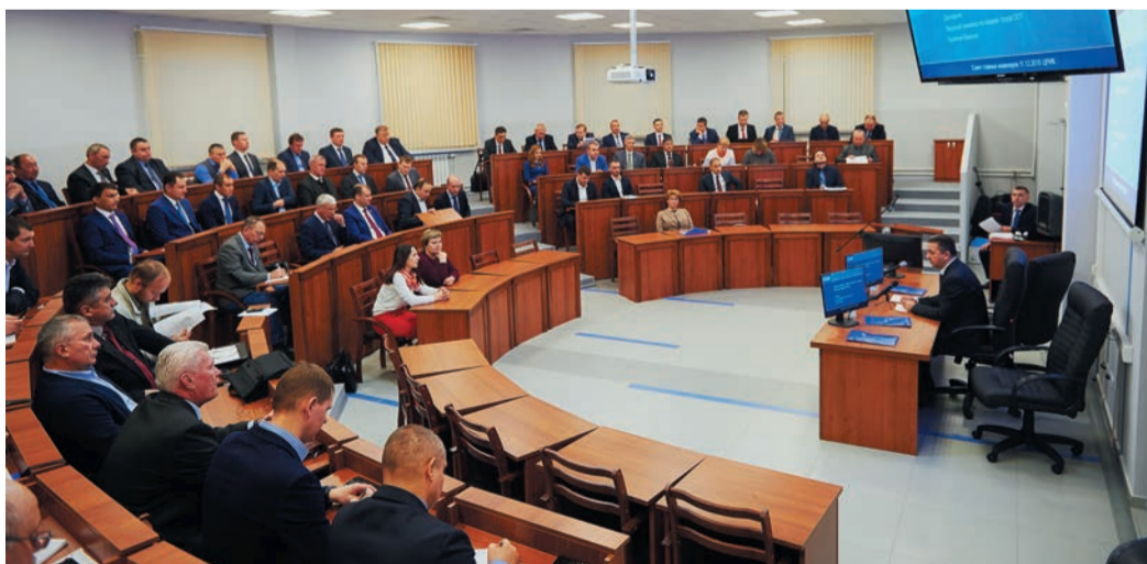
На совещании были главные инженеры всех подразделений Общества с заместителями по производству, охране труда, промышленной и пожарной безопасности, руководители и специалисты основных производственных отделов

Много говорили о планировании работ по текущему и капитальному ремонту. Участникам напомнили, что сегодня уже практически завершено составление планов на 2020 год и принимаются заявки на период до 2022 года.