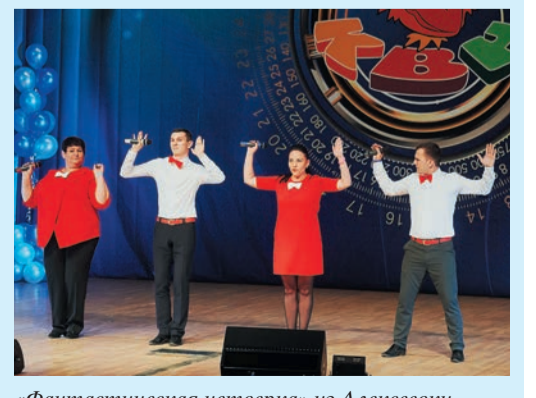
«Фантастическая четверка» из Алексеевки подарила предприятию «Розовые розы» в необычной аранжировке