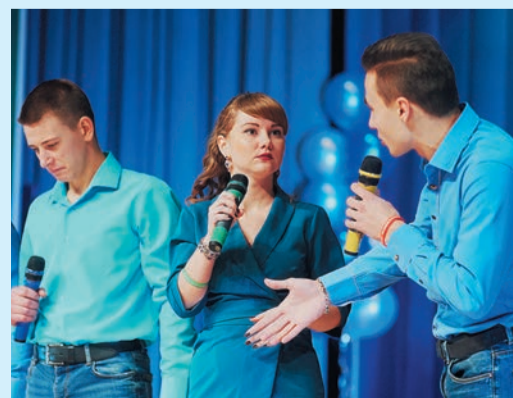
Встреча у поршня — «Золотые трубы» с ГКС-16