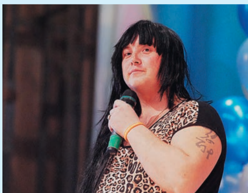
Лола-Лолита из Магнитогорского ЛПУМГ