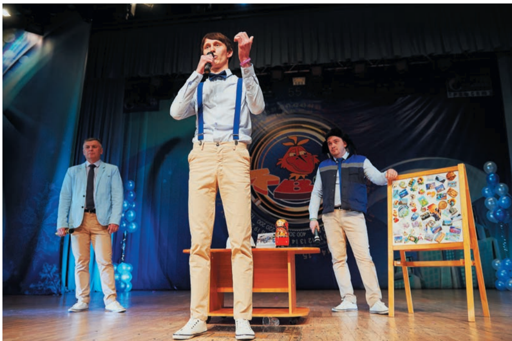
«Алё-гараж!» — взрослая команда, которая шутит на взрослые темы и считает, что КВН — не для старых и молодых, КВН — для души, а от нее не убежишь