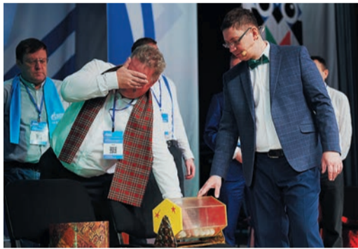
Ведущий проводит жеребьевку перед началом плей-офф

ча тоже была знаковой. Повторился финал 2015 года, где победили челябинцы, только с точностью до наоборот. Складывалось такое впечатление, что свой главный матч в этот день они уже отыграли. Команда сумела собраться и дать первый правильный ответ только на десятом вопросе, когда