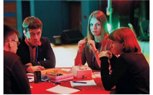
У команды нет права на ошибку