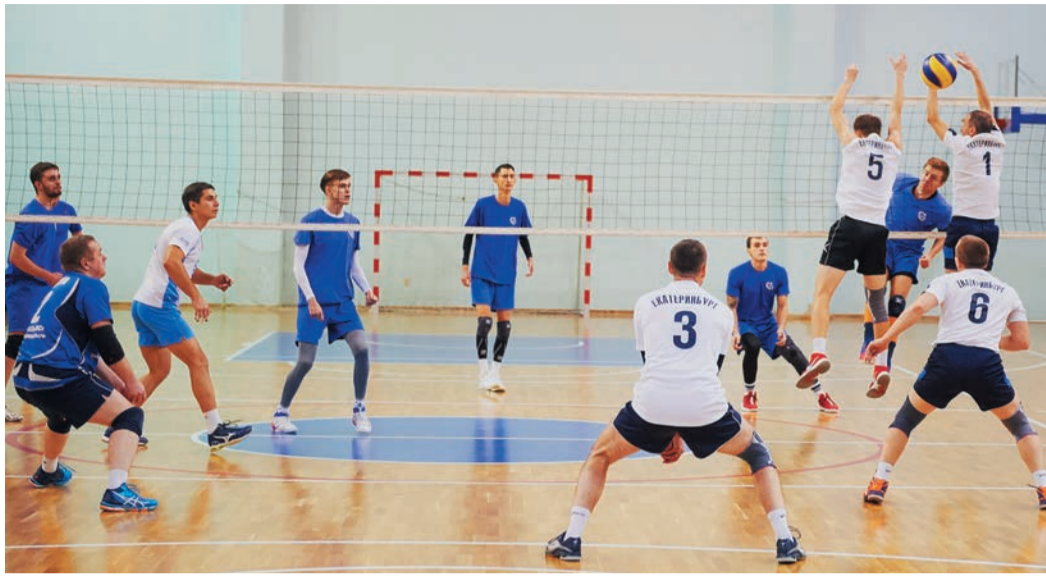
Два поединка наших волейболистов (в белом) с дружиной «Комэнерго» стали украшением Энергоспартакиады

Затем ребята чуть притормозили, ограничившись ничьими во встречах с «Комэнерго» (2:2) и «ЭнергосбыТ Плюс» (3:3),