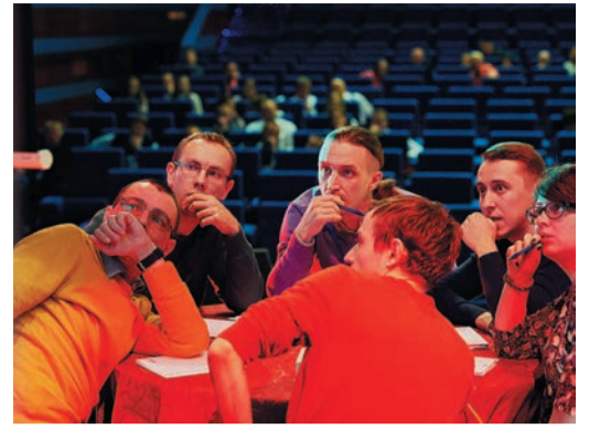
В игре — челябинские знатоки

Победу Бузулукскому ЛПУМГ принес вопрос, на каком языке велось обучение в 1-й Навигационной морской школе, открытой Петром I.