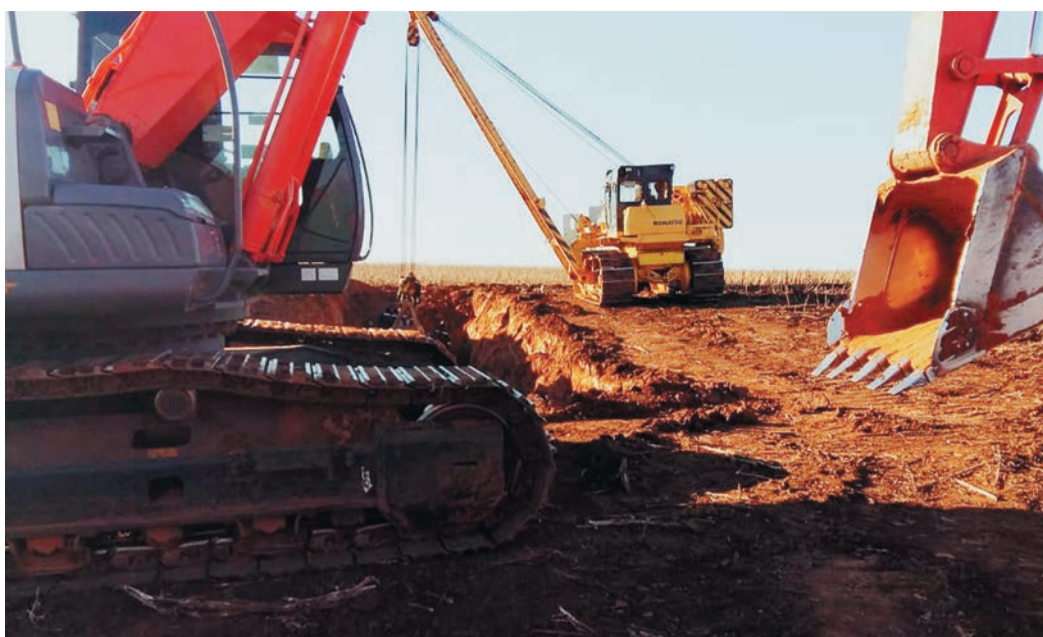
Когда комбайнеры убрали урожай, в поле вышли экскаваторы

До очередного очага коррозии приходилось добираться по горам такой крутизны, что вахтовый «Урал» отказывался ехать — приходилось звать на помощь бульдозериста. Сама работа шла в топких болотных шурфах. Техника передвигалась по специально отсыпанному и намороженному лежневому дорогам. Такова характерная особенность многих уральских трасс, которые то взбираются по каменистым склонам, то ныряют в болотистые седловины.