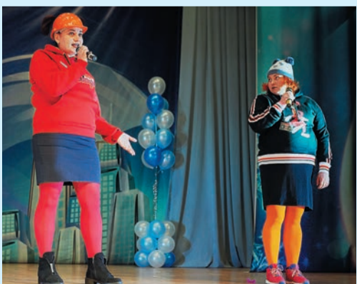
«Легионеры» Светка и Жанка из Карталов — «Личный вклад» в общее дело

«Крепкая заварка» из УАВР-4 выступает всего второй год и уже заслужила приз в номинации «Лучшая импровизация»