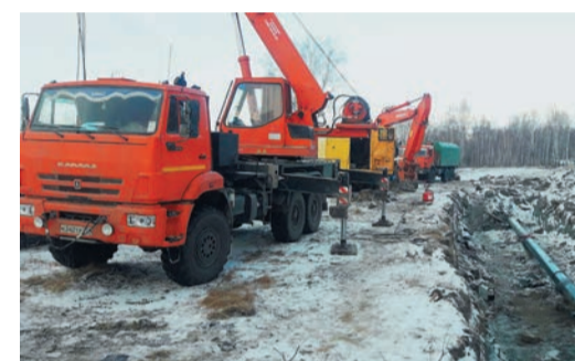
Уфалейский отвод отремонтировали за неделю

Соседи из Челябинского ЛПУМГ этой осенью успели провести ремонт по результатам ВТД первого 23-километрового участка газопровода к городу Верхний