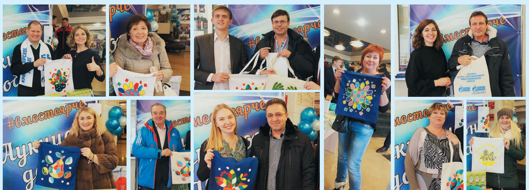
Аукцион провели молодые специалисты предприятия. В нем приняли участие работники и руководители «Газпром трансгаз Екатеринбург», а также болельщики команд Клуба веселых и находчивых

В прошедшие выходные в КСК «Олимп» были представлены эко-сумки, разукрашенные воспитанниками екатеринбургских детских садов № 506 и № 303. Они были раскуплены меньше чем за час. В аукционе приняли участие работники и руководители предприятия. Все вырученные деньги пойдут на благотворительность: их потратят на подарки для детей из малообеспеченных се-