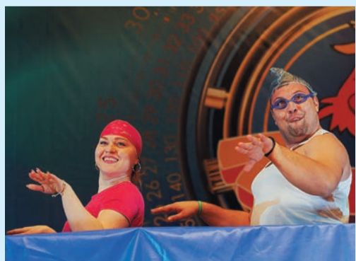
Соревнования по синхронному плаванию от «Базуки»: женская сборная против бузулукских тюленей