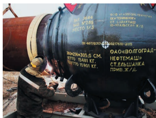
Работники УАВР-4 заменили концевой кран камеры запуска на Саркатайской ГКС

Михаил ЧЕРЕПАНОВ