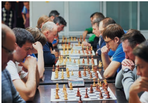
В соревнованиях шахматистов участникам необходимо было провести пять 10-минутных партий подряд

Мероприятие областное, поэтому газавики не могли привлекать атлетов из других регионов присутствия Общества, что, впрочем, не помешало дружине Трансгаза вновь выступить успешно, попав на пьедестал в четырех видах программы из пяти.