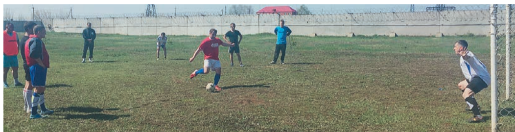
В турнире по футболу приняли участие пять команд

В первых числах мая в Бузулукском ЛПУМГ состоялась Спартакиада работников филиала по пяти видам спорта: гири, настольный теннис, подтягивание, футбол