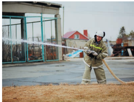
Конкурс машинистов технологических компрессоров — это всегда проверка навыков работы с трубой и соревнования по пожарно-прикладному спорту