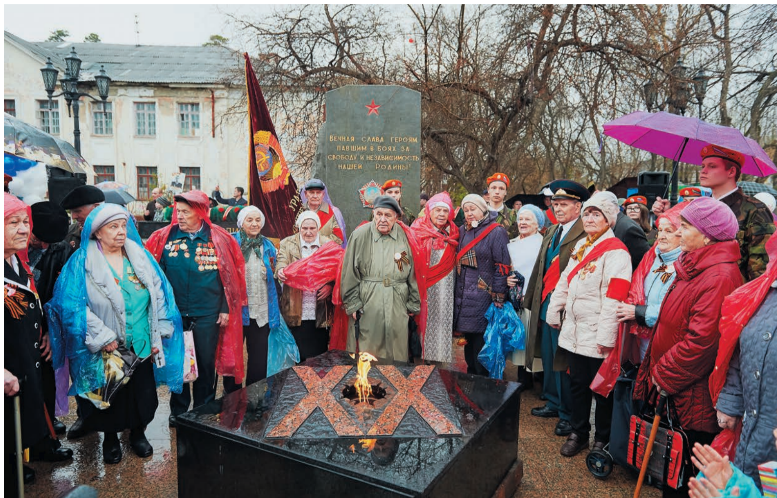
Ветераны войны и труженики тыла вспоминали друзей и однополчан, не вернувшихся с кровавых полей войны

9 Мая — не рядовой праздник. В День Победы мы с безмерным чувством благодарности поздравляем тех, кто встал на защиту страны на фронте и в тылу, и тех, на чье детство пришлось голод и лишения военных лет. Мы с величайшей скорбью вспоминаем фронтовиков, которым не суждено было вернуться домой, и тех, кто вернулся, но не дожидаясь очередной годовщины Великой Победы. 9 Мая — это, в первую очередь, день памяти и возможность выразить нашу глубочайшую признательность ветеранам войны и труженикам тыла. Всем до одного, безотносительно национальности, гражданства и родственных уз.