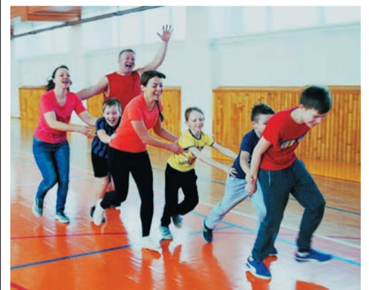
С праздника участники унесли призы, положительные эмоции и хорошее настроение