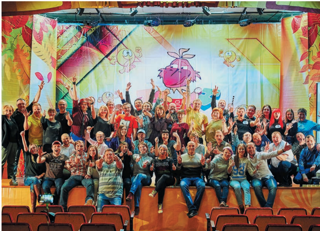
«Кивин в краденом» объединил на учебной сцене участников КВН-движения

КВНовские профи рассказали об основных элементах, из которых состоит фристайл, коснулись вопросов стилистики юмора, провели практикум по сценическому движению, обратили внимание актеров-