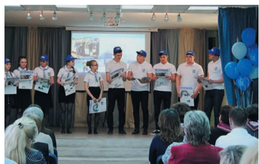
Ребята показали, как на основе социального партнерства школы и промышленного предприятия успешно реализуется профориентационный проект

Практическим опытом реализации проекта «Газпром-класс», запущенного в 2016 году, поделились его непосредственные участники. О преимуществах ранней профориентации и конкретных путях ее воплощения рассказа-