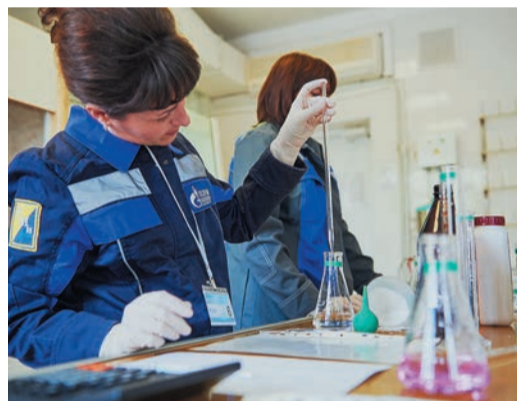
Во время практических занятий лаборанты химанализа определяли показатели щелочности и жесткости воды