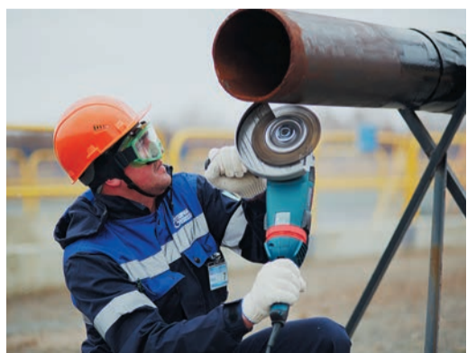
На полигоне линтрубы наносили изоляционное покрытие и переустанавливали шаровый кран