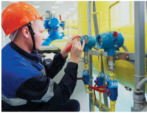
Установить датчик на трубу — только половина дела; настоящий приборист должен уметь его настроить

Особняком на отборочном этапе Фестиваля стояли конкурсы операторов ГРС и прибористов. Дело в том, что в 2017 году представители этих профессий в ходе «плановых» корпоративных смотров уже выяснили, кто на данный момент лучше владеет своей специальностью. Второй год подряд два масштабных конкурса в Трансгазе решили не проводить. Чтобы отобрать действительно самых достойных делегатов на финал, в челябинское отделение УПЦ пригласили трех операторов ГРС и трех прибористов, показавших лучшие результаты в прошлом году. Отборочные испытания по этим профессиям в результате получились самыми «камерными», но включали полный набор теоретических и практических заданий.