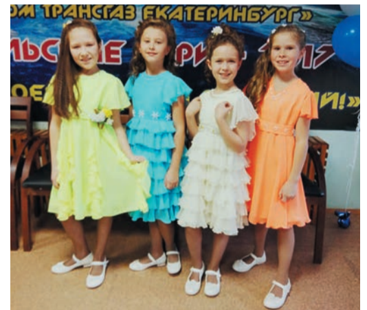
«Капельки» — самые младшие участники творческой делегации нашего предприятия

Репетиции идут полным ходом. Три раза в неделю — во вторник, четверг и воскресенье — проходят групповые