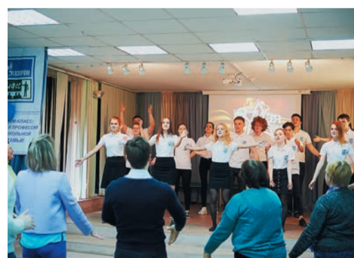
Ученики Газкласса вместе с гостями высадили аллею и устроили танцевальный флешмоб

день они с особым волнением переступили ее порог и были по-настоящему рады посадить свое дерево.