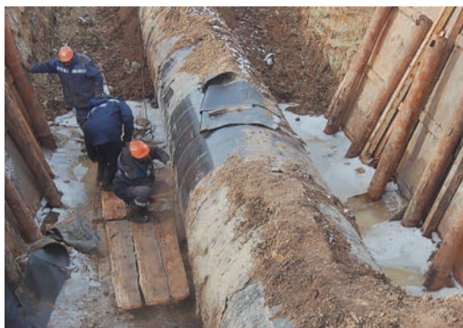
Прежде, чем ремонтники приступят к работе, степень повреждений трубы оценивают дефектоскописты

На газовом коридоре «Уренгой — Челябинск — Петровск» (Ду 1400) завершилась серия больших ремонтов. Участки двухниточной магистрали обслуживают сразу три линейно-производственных управления ООО «Газпром трансгаз Екатеринбург» — все они приняли участие в весенних работах.