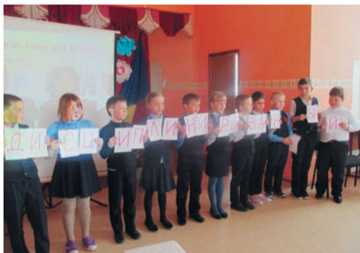
Ребята складывали буквы в слова и рассуждали, какие качества необходимы современному рабочему

Первая неделя трудового наставничества прошла под девизом «Гордое звание — рабочий». Для ребят провели информационные часы в школе и экскурсии на промплощадку. За каждым классом закреплено одно из подразделений. Так, с первоклашками встретились работники службы ЭТВС, в 3-м классе беседу провели специалисты