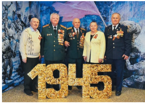
Фронтовиков, ветеранов труда, вдов и детей войны чествовали в КСК «Олимп»

А в Оренбургском управлении (на верхнем фото) устроили военно-патриотический лазертаг, в программе — стрельба из пневматического оружия, метание гранаты, дартс и военно-полевая кухня.