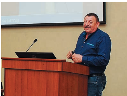
После насыщенной программы 5-дневного семинара энергетиков ждал экзамен на профпригодность

Подводя итоги за прошедший год, специалисты проанализировали работу теплоэнергостановок, систем водоснабжения и водоочистки, практику учета энерго-ресурсов. Руководители служб и главные энергетики филиалов рассказали о том, что сделано на производственных площадках, и отметили: текущий и капитальный ремонт систем ЭТВС практически полностью выполнен хозспособом. Так, в Малоистокском ЛПУМГ капитально отремонтировали