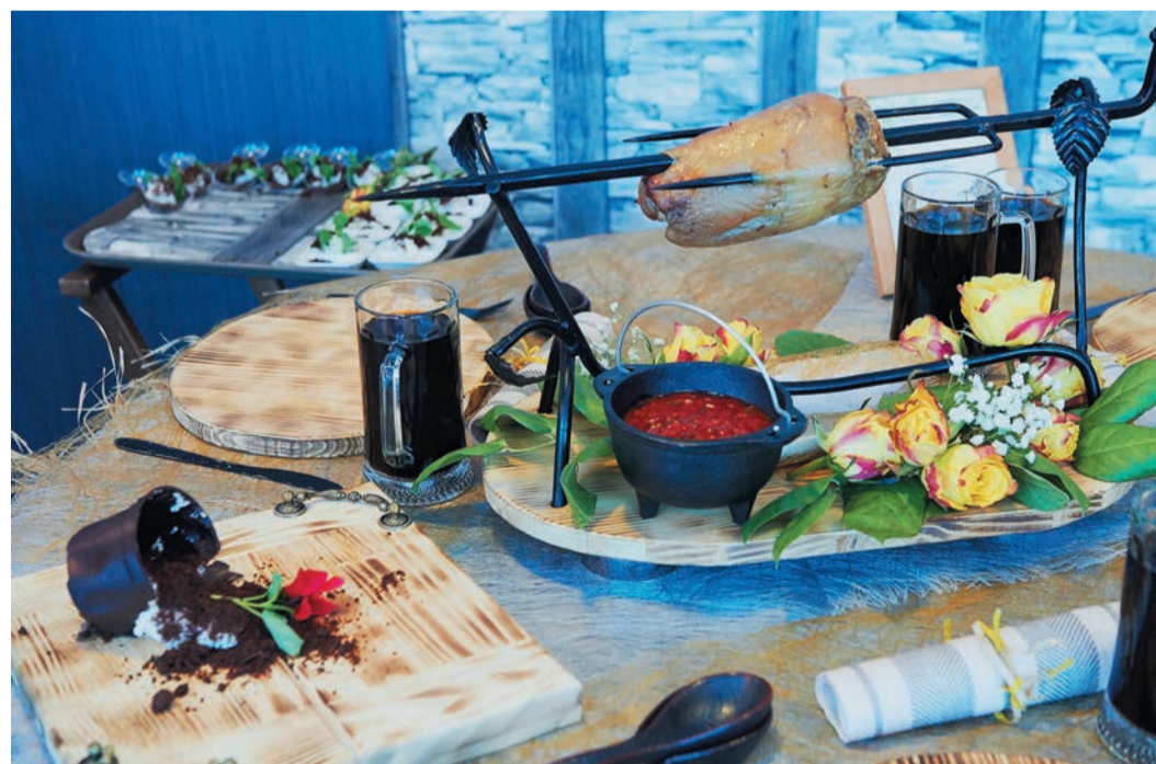
Банкетный стол от коллектива поваров столовой №25 (Оренбургское ЛПУМГ)

Итак, в финал вышли 11 поваров. Участники заключительного этапа собрались на площадке столовой №4 в Малом Истоке. Конкурс начался с проверки теории и включал вопросы по технике безопасности, сроках и особенностях хранения продуктов, на знание технологии приготовления блюд. Быстро ответив по билетам, лучшие мастера Трансгаза приступили к практике и на полтора часа погрузились