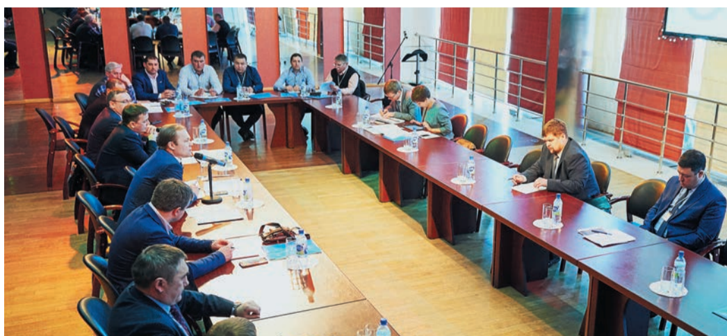
Перед началом «горячего сезона» на трассе руководители линейно-эксплуатационных служб обсудили накопившиеся вопросы

Участники обсудили новые подходы в организации хранения аварийного запаса, вопросы взаимоотношений с землепользователями. Красногорские линейщики поделились опытом работы по устранению нарушений охранных зон газопровода и зон минимально допустимых расстояний. Помочь выявлять нарушения в самом начале должна аэрофотосъемка, выполняемая с «беспилотников». О планах по воздушному обследованию трассы