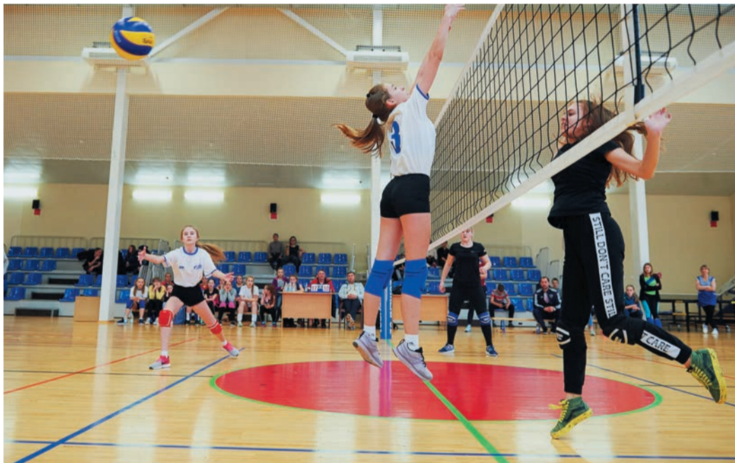
Одним из главных открытий турнира стала дружина УАВР-3 (в черной форме), завоевавшая «бронзу»

На глаз, силы практически равны, и кажется, любая из них может претендовать на титул. Хотя в лыжных гонках предсказывать непросто: вдруг очередной тягун развалит технику, а коварный поворот заставит излишне скинуть скорость или, что еще хуже, выбросит в соседний сугроб?.. Впрочем, финиш всегда справедлив: кто лучше готов, тот и в дамках. Другое дело, что в гонках с раздельным стартом примами себя могут почувствовать сразу несколько спортсменов. Поэтому, фини-