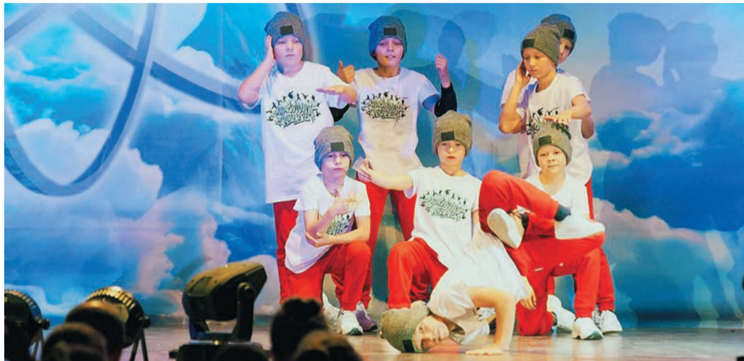
Мальчишки из студии «Максимальное движение» удерживают в регионе лидерские позиции

Сейчас ребята усиленно готовятся к выездным баттлам в Ижевске и Челябинске. Планируют на домашнем чемпионате в мае добавить в официальную программу, кроме брейк-данса, еще два направления — хип-хоп и паппинг. Делают несколько новых сценических шоу для концертных выступлений.