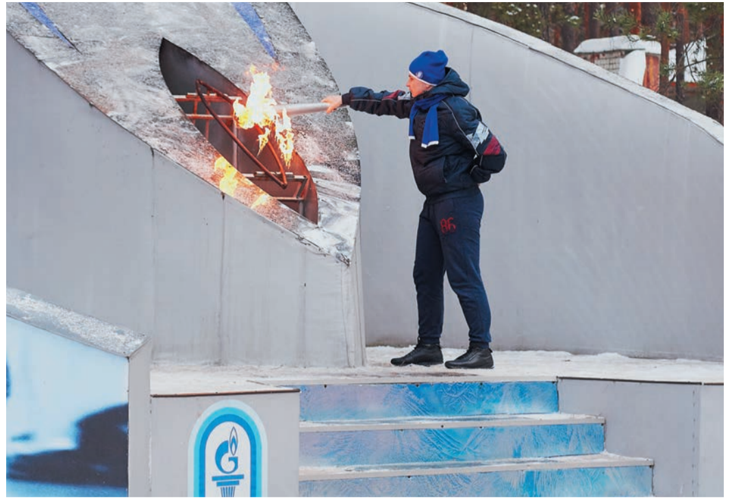
С этого сезона детские спартакиады Общества будут проводиться дважды в год — зимой и летом