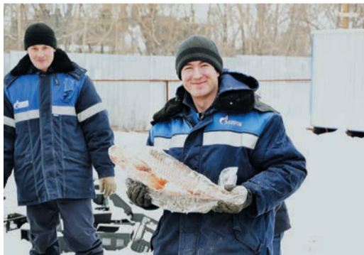
Челябинцы (слева) и шадринцы помогли людям, посвятившим свою жизнь заботе о брошенных животных

Продолжается акция «Магистраль добра», запущенная Советом молодых ученых и специалистов в Год волонтера. Она стартовала в феврале, когда активисты СМУС посетили пункт кратковременного содержания животных в Екатеринбурге. Эстафету подхватили молодежные комитеты (МКФ) еще нескольких филиалов. Работники Челябинского и Шадринского ЛПУМГ, по примеру из центра, использовали выходной, чтобы помочь в уходе за брошенными животными. Челябинцы отправились в приют «Хочу домой». Здесь одновременно со-