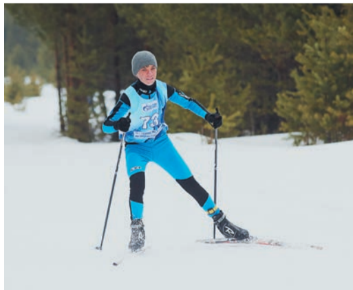
Лыжные гонки уже традиционно прошли на базе «Спартак» в Сысерти