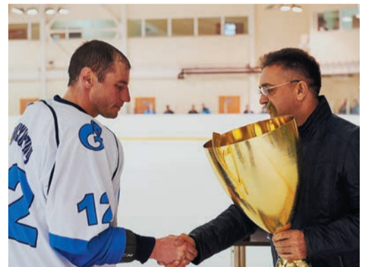
Челябинцы выиграли Кубок чемпионов в 4-й раз

Думаете, МИЛПУ на этом сдулось? Отнюдь: ребята вновь используют численное преимущество и подбираются к соперникам на расстояние вытянутой руки. И все же по-