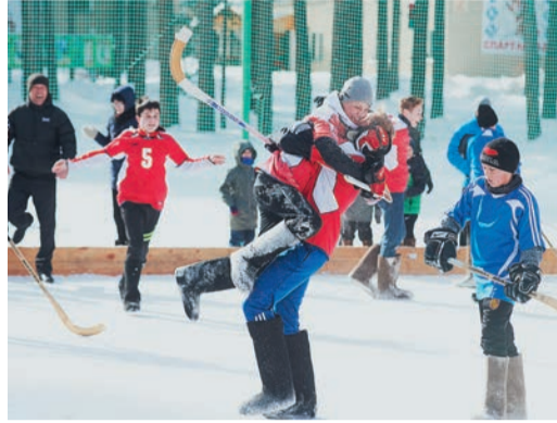
Далматовцы (в красном) празднуют «золото» в хоккее

В протоколе командного первенства лыжники выстроились в таком же порядке, что и в эстафете: Челябинск, ГКС-16 и Невьянск.