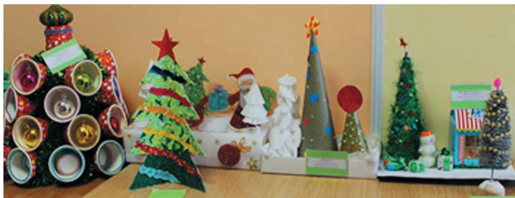
Подделки челябинских дошколят из использованного пластика, одноразовой посуды и бросового материала

Одно из важных направлений эко-школы — рациональное управление отходами. В его рамках в конце прошлого года мы провели акцию «Ёлочка, живи!». Для выставки ребята вместе с родителями подготавливали поделки из бросового материала. Четыре лучшие ёлочки отправили на