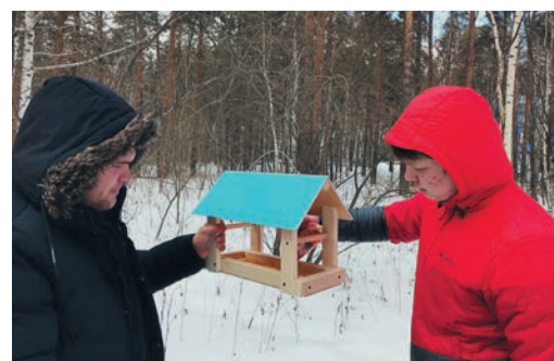
Молодые специалисты Малоистокского ЛПУМГ изготовили и развесили кормушки в лесопарковой зоне, примыкающей к производственной площадке