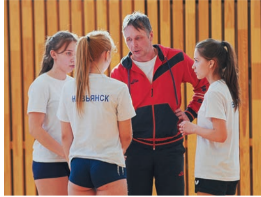
Невьянцы вновь оказались лучшими в пионерболе

И начался яростный перепляс-перепас: момент за моментом, вратарские спа-