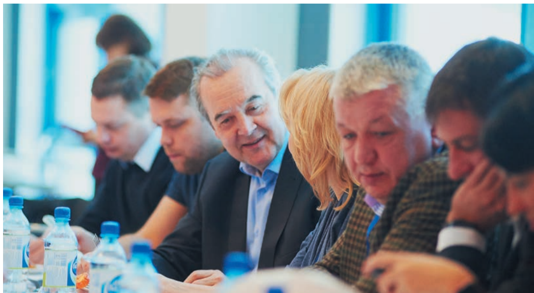
Конкурсное жюри за работой

Куриная грудка с инжиром и вялеными помидорами; запеченная с хурмой; фаршированная форелью. Сложный вариант кнельного рулета, приготовленного из пропущенного через мясорубку и взбитого фарша. Совершенно неожиданный тимбал — шар из грудки в форме афрокубинского бубна со сливочной начинкой. И простая, но весьма оригинальная пряная курочка, обжаренная в панировке из молотого арахиса,