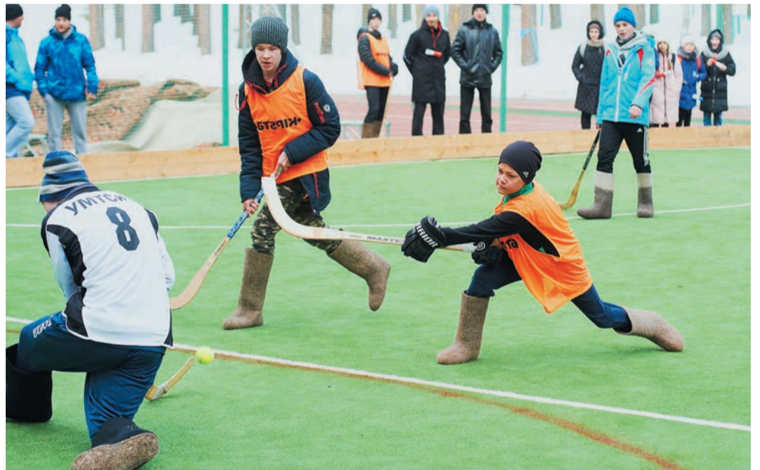
Хоккей на валенках прочно утвердился в программе наших Белых Игр