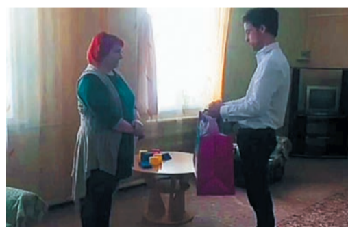
Бузулукчане (слева) и инженеры ИТЦ побывали в гостях у ребят, которые остро нуждаются в обычном человеческом общении и внимании

Молодежь Шадринска при поддержке профкома закупила продукты и медикаменты для «Приюта надежды». Активисты намерены наладить постоянную связь и дальше помогать ухаживать за животными.