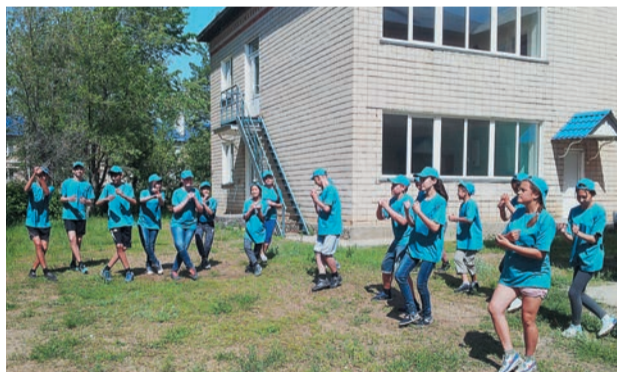
В хорошем настроении выходят на работу участники лагеря «Юность»