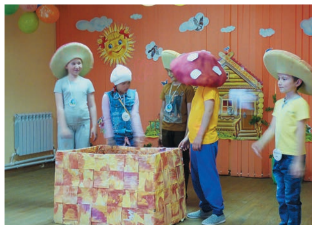
Ребята примерили на себя роль хозяев природы — именно так назывался один из отрядов творческого лагеря «Гармония»

В естественнонаучной программе лагеря — эксперименты с использованием микроскопа, изучение Красной книги Оренбургской области. В экскурсионной части посещение Аркаима — древнего поселения, возникшего на рубеже III–II тысячелетий до н. э. и обнаруженного ровно 30 лет назад, в июне 1987-го. В собственно творческой — песни и танцы об отдельных представителях и видах флоры и фауны. Педагоги подошли к делу креативно, и учебный репертуар разросся от народной казачьей «Кони» до классического «Вальса цветов» и далее. А в подразделе прикладного творчества ребята мастерили игрушки. Образцами для подражания выбрали обитателей родного края — суслика, божью коровку и сову.