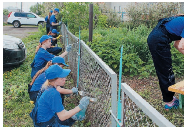
Трудовые будни далматовских подростков

В нескольких филиалах лето стартовало для подростков с трудовых будней. В селе Песчано-Коледино (Далматовское ЛПУМГ) на трудовую вахту вышли 25 старшеклассников. Для них был подготовлен большой «фронт работ». В «городке», где расположены многоквартирные дома, в которых живут работники управления, ребята занялись благоустройством: покрасили детскую площадку и ограждения. Следующая группа по заявке автотранспортного цеха обновляла пожарные щиты и дорожную разметку. Еще одна занималась покраской бордюров и лавочек, подстригала газоны на территории промплощадки.