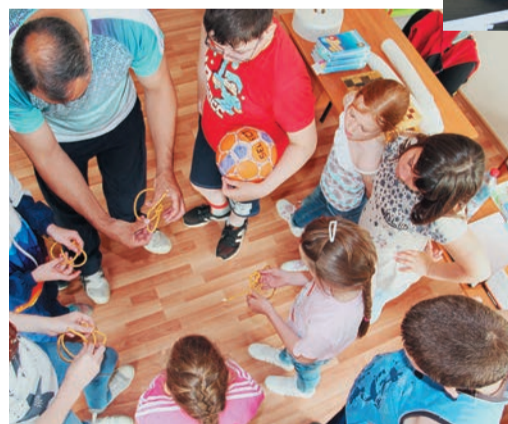
Карталинский спортивно-туристический лагерь проходил под девизом «Зажигай лето!»

Первым подготовку к VIII турслету провели дети работников Карталинского филиала в рамках спортивно-туристического лагеря «Огонек». Площадка работала с 1 по 27 июня. Под руководством спортинструкторов ребята от 8 до 13 лет учились вязать узлы, ставить палатку, состязались