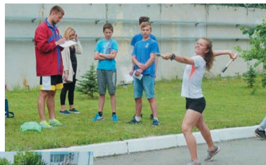
Дети сотрудников Челябинского ЛПУМГ были зарегистрированы в центре занятости, для многих запись в трудовой книжке стала уже не первой