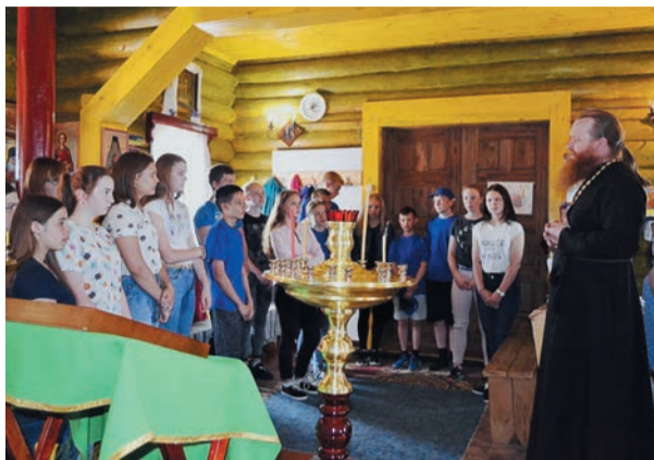
Экскурсия в храм: историческое и культурное погружение

Еще один эксклюзив — цикл мероприятий, посвященных духовно-нравственному воспитанию. Далматовские газовики не первый год помогают в строительстве церкви Покрова в селе. И вот для детей и внуков работников была организована экскурсия в храм. К подросткам-«трудовикам» присоединились ребята первой смены спортив-