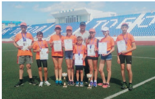
Всего школьники привезли домой семь медалей различного достоинства и два кубка — за 1 командное место у мальчиков и у девочек

Лично-командные состязания, включающие забег на короткую дистанцию (60 м), кросс (600 м у девочек и 800 м у мальчиков), прыжки в длину с разбега и метание мячика, прошли в Тобольске с 23 по 25 июня. В них приняли участие свыше сотни юных спортсменов в трех возрастных категориях: младшей (2006 года рождения), средней (2004–2005) и старшей (2002–2003). Лучшие легкоатлеты региона боролись за выход в финал всероссийского первенства, которое пройдет в сентябре в Сочи. И спортсмены из Песчано-Коледино не только во второй раз подряд с большим отрывом от конкурентов выиграли путевку на «всеросс», но сделали это с бле-