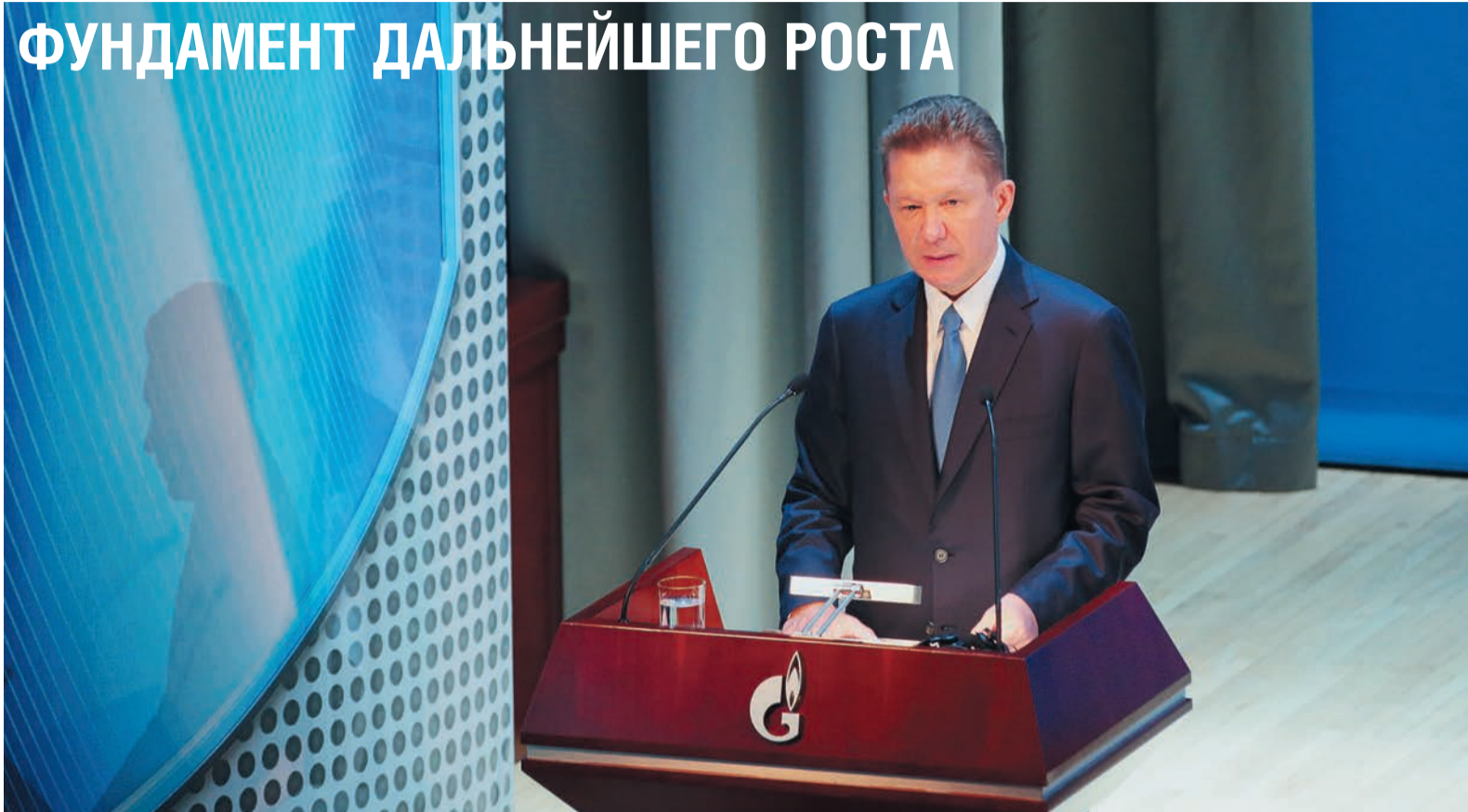
Доклад Председателя Правления ПАО «Газпром» Алексея Миллера на годовом Общем собрании акционеров