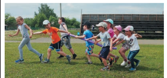
Весь день провели невьянцы на свежем воздухе, отдохнули и получили массу положительных эмоций

Невьянские газовики провели День здоровья. Около сорока работников вместе с детьми собрались в выходной в городском парке отдыха.