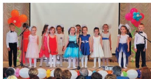
Праздник прошел на одном дыхании: и взрослые, и дети выступали с огромным удовольствием

Стремительно пролетают дни, проходят годы, сменяют друг друга воспоминания. Но в этой непрерывной текучести нашей жизни навсегда сохранились неповторимые мгновения детства, и с каждым годом они становятся только дороже и ближе. 2 июня 2017 года отметил свой 30-летний юбилей детский сад «Солнышко» Челябинского ЛПУМГ.