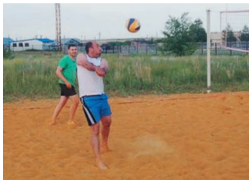
День молодежи в поселке Голубой Факел встретили по-спортивному

Лето — отличное время для спортивных состязаний на свежем воздухе. В Домбаровском ЛПУМГ к Дню молодежи, который отмечается в конце июня, организовали праздник спорта. В легкоатлетическом кроссе, соревнованиях по пляжному волейболу и мини-футболу приняли участие молодые работники основных служб филиала и молодежь по-