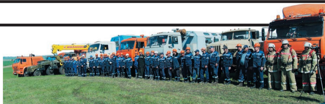
По тревоге на место «аварии» прибыли бригады Бузулукского ЛПУМГ и УАВР-4

УАВР-4 на площадках в Оренбурге и Сорочинске срочно сформировало аварийные колонны: уже через 20 минут после тревожного сигнала техника выдвинулась из Сорочинска. Из Бузулука, в свою очередь, выехали сандружинники ЛПУ, так как на месте разрыва «обнаружили» двоих пострадавших сотрудников межрегионального Управления охраны.