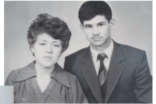
та. Встреча произошла осенью 1981-го, с тех пор больше не разлучались, а через год поженились. Свидетелем на свадьбе был, конечно, лучший друг.

Вход был бесплатный, играла музыка, людей — не протолкнуться. Вместе с товарища-