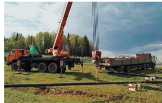
Сварка плетей на миньярском отводе

За две недели сотрудники ЛЭС-2 Красногорского ЛПУМГ сварили и уложили 438 м газопровода на западе Челябинской области. Эта работа была выполнена в плановом порядке на отводе (Ду 150) к ГРС поселка Миньяр для повышения надежности трубы.