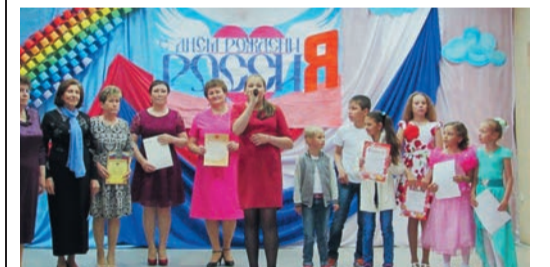
Праздничное настроение создавали артисты КСК «Эдельвейс» и представленные на итоговой выставке работы участников кружка «Рукоделие»