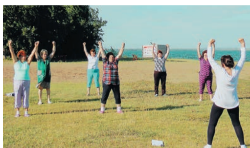
44 магнитогорца провели чудесные деньки на берегу озера