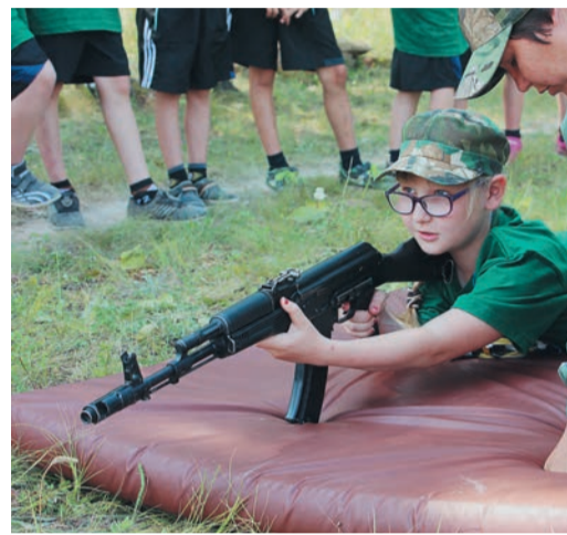
В единственном военно-патриотическом лагере «Мужество» (ГКС-16) произошла смена поколений, а на занятиях ребятам предложили теорию и практику современной науки побеждать

В спортивно-туристических лагерях Карталинского и Медногорского ЛПУ, ГКС-16 Домбаровского управления и Саракташской ГКС ничего менять не стали. Здесь дети совмещали занятия спортом с освое-