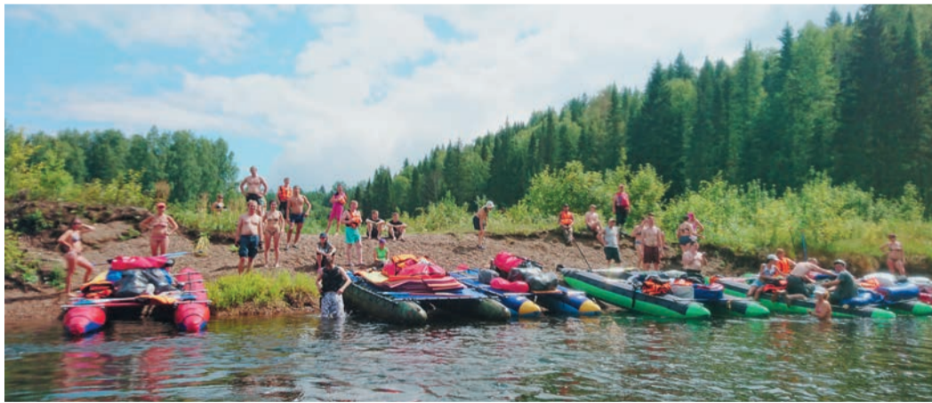
В динамичном водном походе инженерам хватило времени и на пикники, и на экскурсии

За два дня путешественники преодолели 24 км. Маршрут пролегал по живописному природному парку «Оленьи ручьи» (Свердловская область). По пути участники водно-