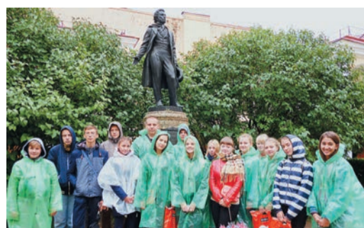
Ребята побывали в музее-квартире А. С. Пушкина, где поэт провел свои последние дни

Путешествие из столицы Среднего Урала до Северной столицы и обратно 17 подростков со всей трассы совершили на поезде. По городу много гуляли пешком, перемещались на экскурсионном автобусе, на поездах метрополитена и речных судах. Туристическая программа называлась «Очарование Санкт-Петербурга» — и это, как убедились ребята, не просто фигура речи. Даже старшеклассники, многое повидавшие в стране