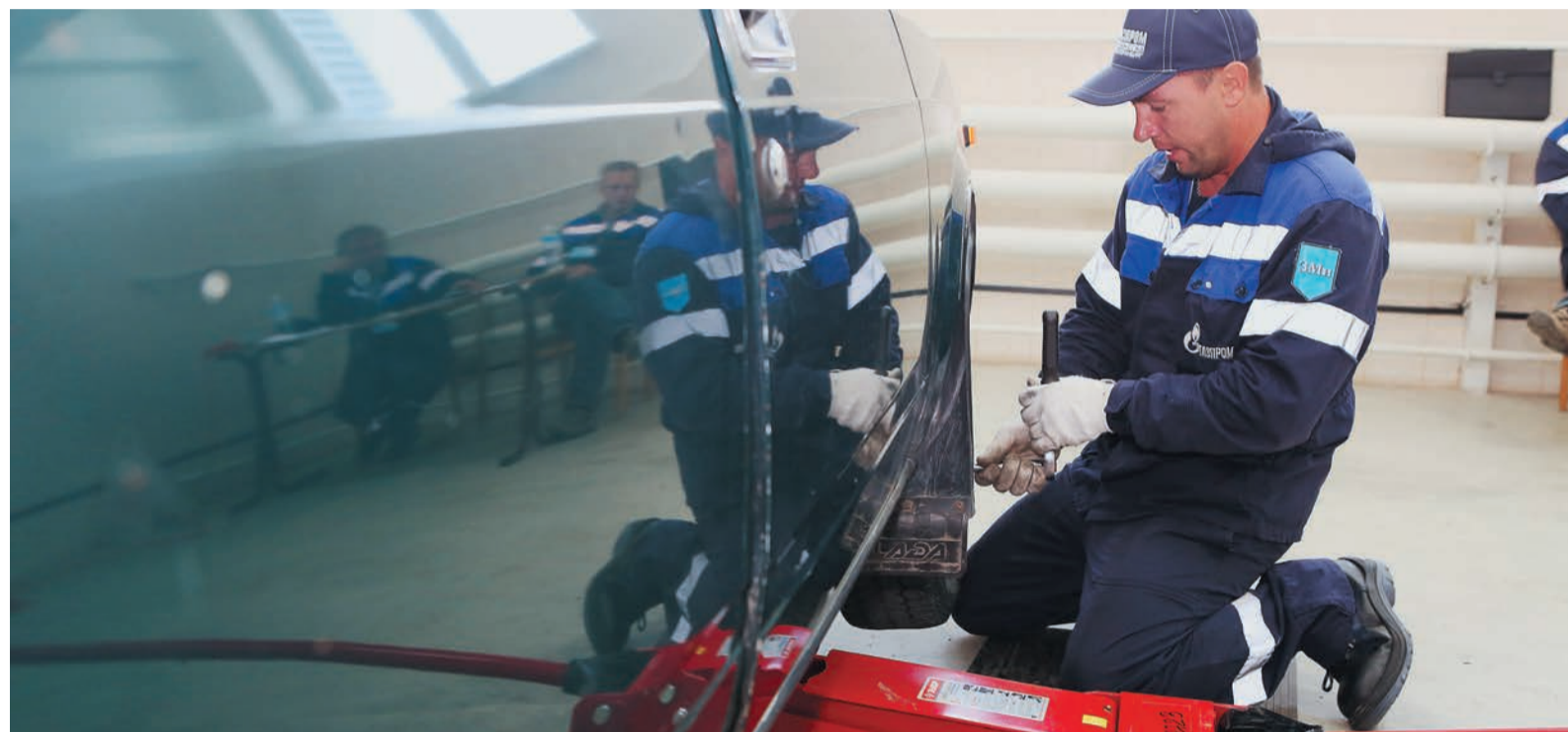
Одним из заданий практического этапа стала замена тормозных колодок легкового автомобиля

Незаметно череда традиционных профессиональных смотров ГТЕ сезона-2016 подошла к финишу. Последними в этом году вышли на старт слесари по ремонту автомобилей. 12 участников, представляющих девять филиалов предприятия, в конце июля собрались на базе челябинского отделения УПЦ, чтобы в седьмой раз определить лучших из лучших.