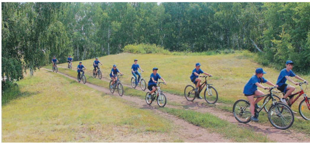
В «Лидере» совершили велопоход по родному краю

нием навыков походной жизни — учились ставить палатки, проходить препятствия, вязать узлы. Спортивная составляющая