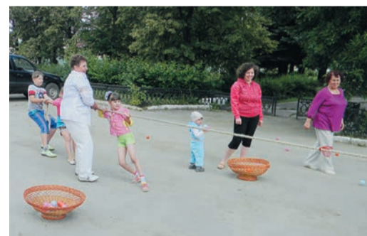
В этих праздничных состязаниях «Непобедимых» и «Стремительных» один чемпион — дружба

трав». Кичигино, кроме того, стало мозговым центром при подготовке пенсионеров управления к предстоящему слету Общества, который намечен на сентябрь.