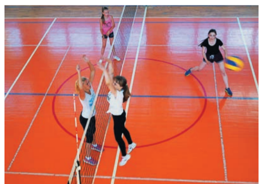
В программе подготовки невянянских ребят к предстоящей Спартакиаде нашлось место для товарищеских турниров по мини-футболу и пионерболу со сборными городского оздоровительного лагеря и поселка Цементный

И во всех без исключения лагерях ребят ждала широкая культурно-развлекательная программа. Помимо традиционного посещения кинотеатров были и приятные сюрпризы. Участники «Лидера» (ГКС-16) побывали в аквапарке, динопарке и зоопарке в Абзаково, юные карталинские спортсмены — на выставке птиц, которая проходила в краеведческом музее, саракташские туристы самый жаркий день лета провели на базе отдыха «Майорка».