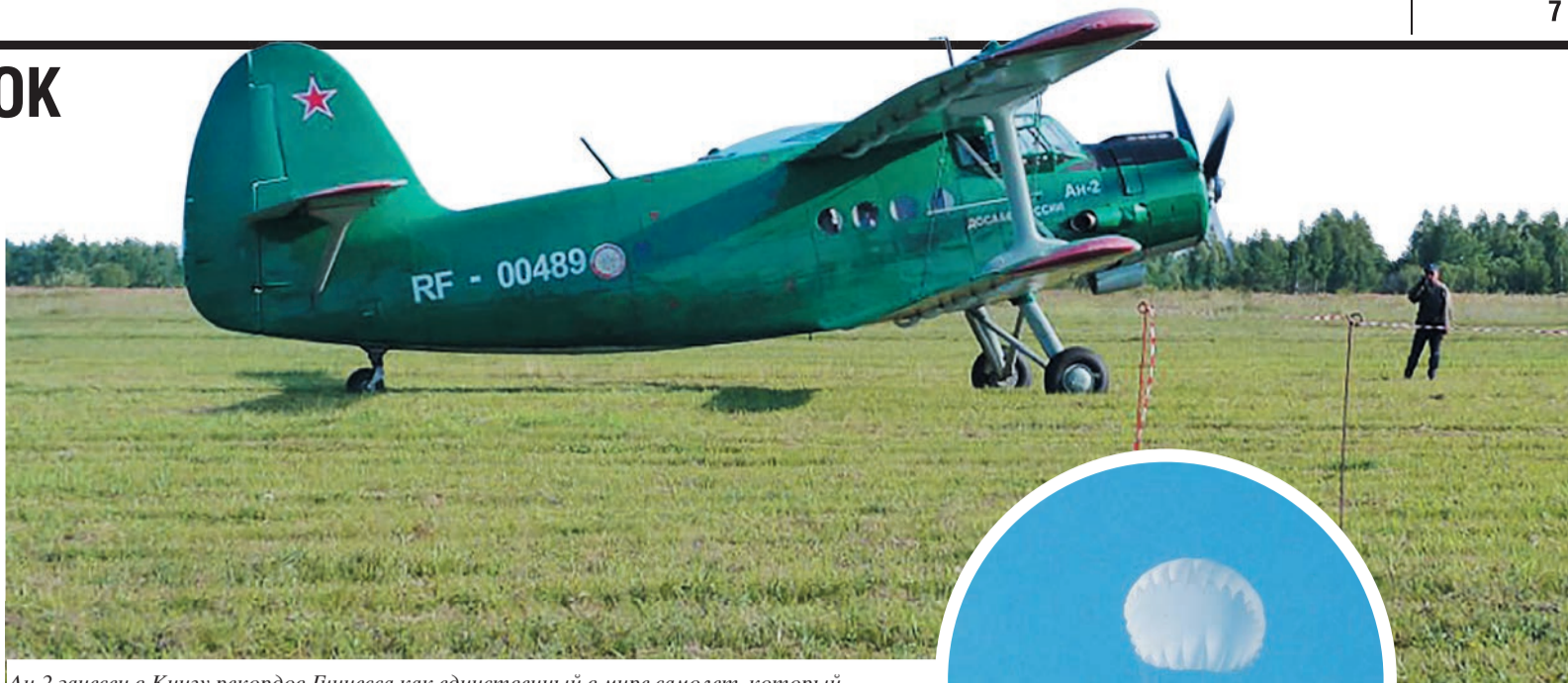
Ан-2 занесен в Книгу рекордов Гиннеса как единственный в мире самолет, который выпускается уже более 60 лет

С той поры прыгал регулярно. Сначала «по заданию»: когда необходимо сделать