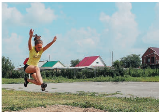
Помимо подготовки к Спартакиаде, смешанные состязания по шашкам, дартсу и другим видам спорта стали новинкой лагеря в Далматовском ЛПУ

Работа детских спортивно-туристических лагерей растянулась почти на целое лето. Открыли сезон в начале июня в Карталинском ЛПУ, закроют 19 августа в Далматовском. В целом за три месяца спортивную и туристскую подготовку прошло около двухсот детей работников Общества.