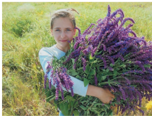
В Медногорском ЛПУ за две смены в лагере побывало 40 детей

Появилось еще одно новшество — преодоление водного препятствия по «канатной дороге», построенной своими руками. В первый раз 50-метровую канатную переправу натянули через реку Сергу в Оленьих