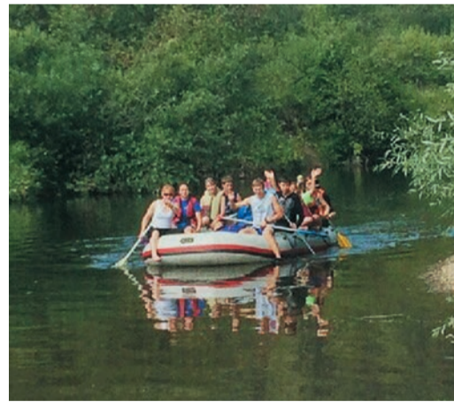
Подростки из Голубого Факела могут теперь смело называть себя настоящими туристами