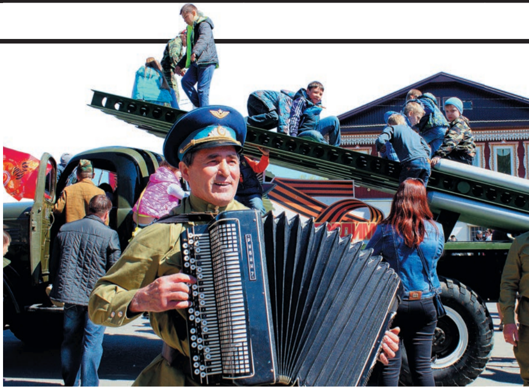
Подготовка к празднику началась задолго до Дня Победы

Накануне 9 Мая, а кое-где непосредственно в День Победы, делегации во главе с руководителями, представителями профсоюзных комитетов, советов ветеранов и молодых специалистов отправились в гости к труженикам тыла, вдовам и участникам войны. Обошли всех, чтобы лично позжать руки, обнять, вручить поздравительные письма, цветы, праздничные продуктовые наборы.