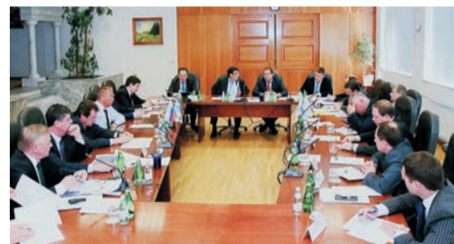
В ходе обсуждения было выдвинуто много конкретных предложений

В результате перспективные разработки проходят долгий путь до стадии серийного выпуска. Слабо ведется работа по снижению издержек: цена нередко превышает зарубежные аналоги.