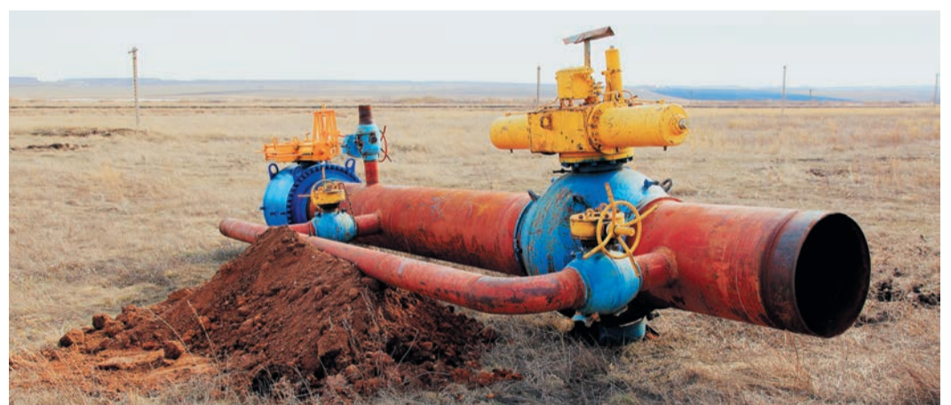
На этот раз через временную камеру прошло 14 поршней

На прошлой неделе сразу в двух филиалах завершилось проведение внутритрубной дефектоскопии, и в обоих случаях не обошлось без запуска дополнительных снарядов.