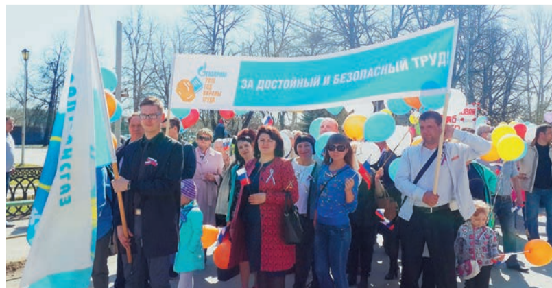
Невьянцы отмечали Первомай под лозунгом достойного и безопасного труда. Сотрудники и пенсионеры вместе с начальником, главным инженером и председателем профкома филиала прошли колонной от ДК машиностроителей до Площади Революции

С российским триколором в руках и патристическими трехцветными ленточками на груди дружно вышли на праздник весны и труда работники и руководители Медногорского ЛПУ