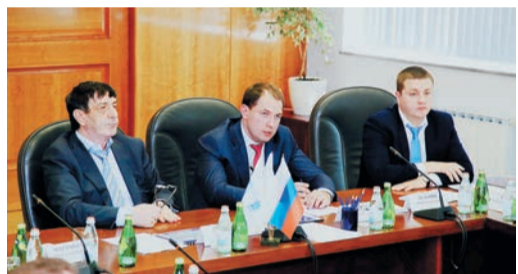
Совещание возглавили руководители ГТЕ и Департамента Газпрома

Наибольший интерес вызвали объекты по производству и использованию сжиженного природного газа. На АГНКС Первоуральска первая партия СПГ методом дросселирования была получена почти два десятка лет назад. Сегодня эта технология применяется на большинстве объектов малотоннажного производства СПГ в России. Созданная в Трансгазе установка по производству СПГ на ГРС-4 Екатеринбурга (мощностью 3 т/ч на базе турбодетандерного цикла) является опытным образцом. Но уже понятно, что данная технология открывает дорогу к использованию более мощных комплексов с куда более высокой производительностью.