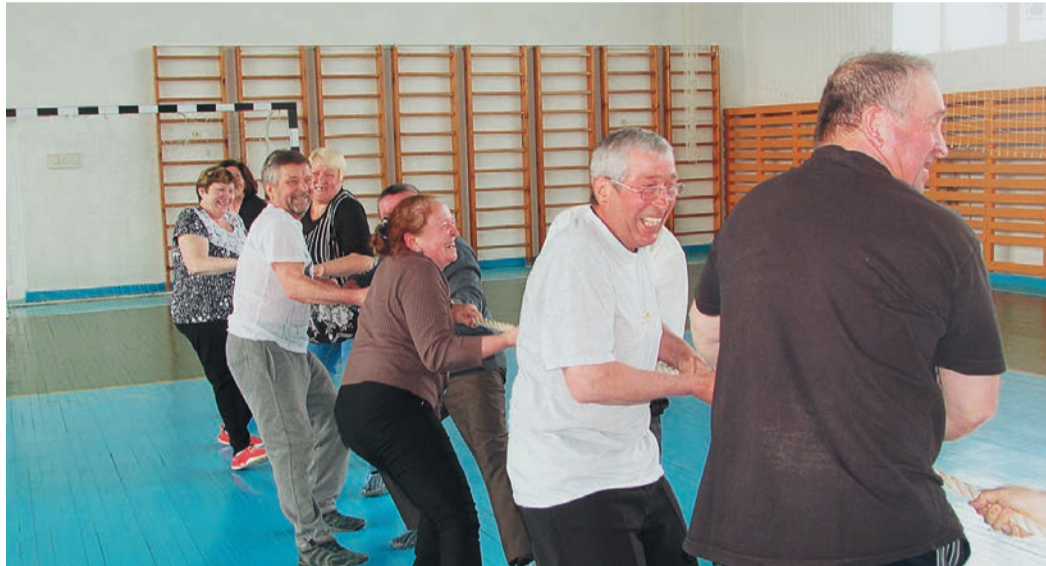
В перетягивании каната определился победитель встречи ветеранов

В Шадринском ЛПУ вновь состоялись веселые старты для пенсионеров. Ветеранам из Кызылбая так понравились состязания, устроенные на 23 февраля и 8 марта, что в этот раз они решили расширить географию и пригласили помериться силами коллег из Шадринска. Во время соревнований две команды шли ноздря в ноздю, и после семи спортивных конкурсов и викторины гости из города отставали от хозяев-сельчан всего на очко. За финальное перетягивание каната полагалось два балла, и достались они принимающей стороне — село таки одолело город. Как отметили судьи, работа на приусадебных участках и занятия на тренажерах в ФОКе позволяют кызылбаевцам поддерживать хорошую физическую форму.