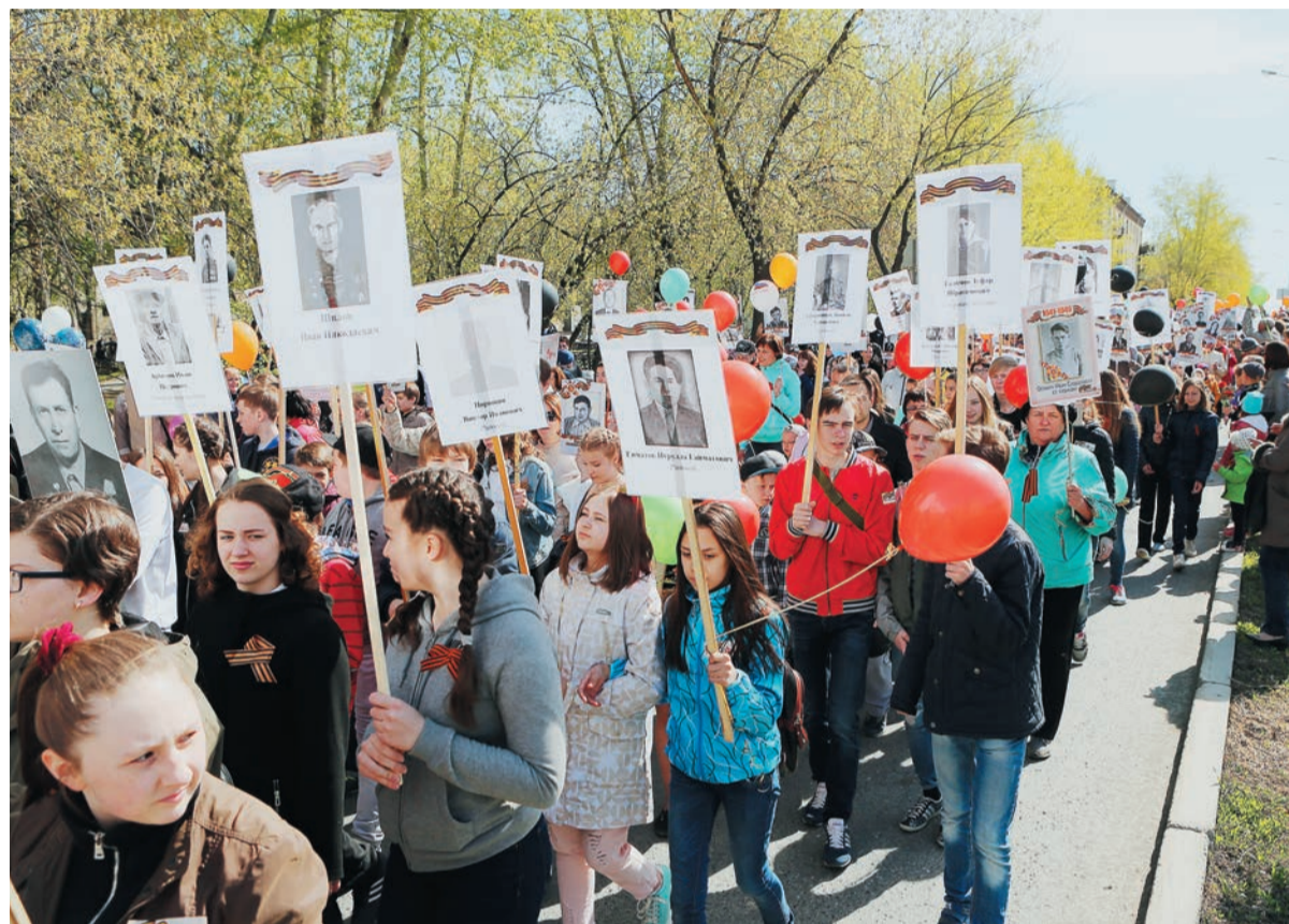
Поселок Компрессорный — 2016: с каждым годом все больше людей присоединяется к Бессмертному полку — никто не забыт и ничто не забыто

Ясное небо над головой, ласковое солнце и аромат цветущих яблонь — редкость для 9 мая... Нынче словно сама природа вместе с уральцами радовалась празднику. В эти майские дни торжественные мероприятия, посвященные 71-й годовщине Победы в Великой Отечественной войне, прошли во всех городах и поселках, где живут и работают трансгазовцы. Главными героями праздника стали ветераны и дети войны, труженики тыла и вдовы участников боевых действий. Вместе со всеми в микрорайоне Компрессорный Екатеринбурга «вахту памяти» несли и корреспонденты «Трассы».