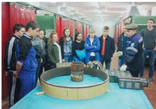
Экскурсии на производство могут стать для старшеклассников из Кызылбая (слева) и Голубого Факела решающими при выборе профессии

В преддверии школьных каникул филиалы Общества по традиции открыли свои двери для старшеклассников. К середине мая производственные экскурсии, подготовленные совместно отделами кадров и советами молодых специалистов, прошли уже более чем в половине управлений. За полтора месяца на них побывало три сотни подростков.