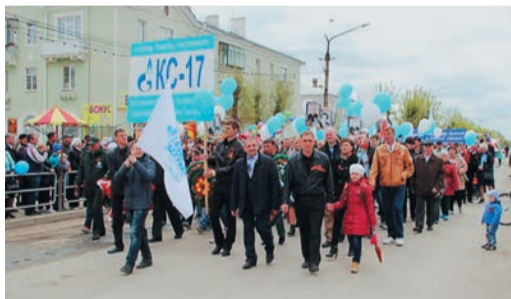
Бессмертный полк, в который вступило около полусотни газовиков Карталинского ЛПУ, открывал парад Победы