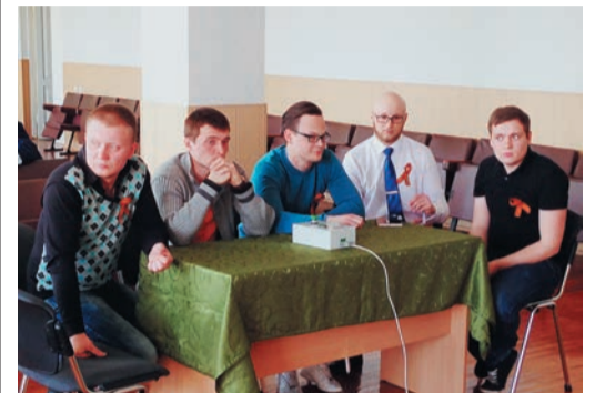
Борьба за победный кубок шла до последней минуты

Еще один брейн-ринг, посвященный Году охраны труда, прошел в очередном филиале нашего предприятия. Вслед за Домбаровкой знания сотрудников по технике безопасности взяли проверить в Малоистокском ЛПУ. Для участия в игре здесь пригласили людей одной профессии — слесарей. На интеллектуальный «ринг» вышли две команды: сборная АРП Сысерти и сборная основной промплощадки. А специальную установку с красными кнопками и табло для проведения турнира малоистокцы позаимствовали у коллег из ИТЦ.