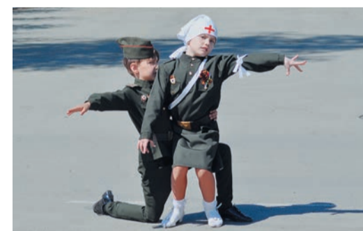
В этом году Вальс Победы стал настоящим подарком не только для работников и пенсионеров УАВР-1

На 7 мая был перенесен в Медногорске запланированный на этот день Вальс Победы. В нем приняли участие около 500 школьников, кружившихся парами прямо на городской площади. Пенсионеры, которые специально пришли посмотреть на впервые проводившуюся акцию, даже не пытались сдерживать слезы.