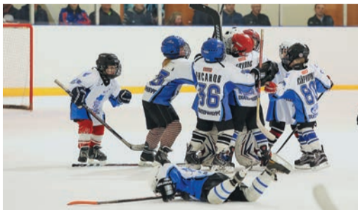
Уральский Трансгаз вновь собрал вместе лучших «дворовых» хоккеистов Екатеринбурга и Свердловской области

звезд газиков откликнулись четыре коллектива. В роли хозяев выступила детско-юношеская спортшкола (ДЮСШ) «Факел», а в гости к нам приехали: «Фотон» — один из старейших клубов Екатеринбурга, «Хризотил» из Асбеста и «Белые волки» из Ревды.