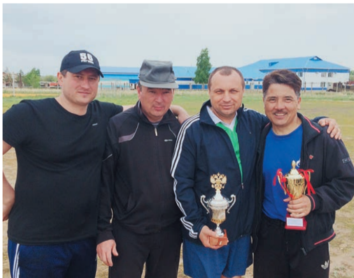
На память о победе футболистам останутся почетные кубки

71-й годовщине Великой Победы были посвящены и соревнования по мини-футболу, организованные в Домбаровском ЛПУ. Шесть команд, представляющие основные службы филиала, были разбиты на две группы. Победители каждой — футболисты ГКС и ГРС — встретились в финале, удачливее оказались первые. Команды «Уралавтогаза» и АУП, занявшие вторые места в группах, разыграли «бронзовые» кубки. На этот раз они достались автогазовцам.