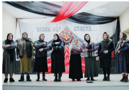
В концерте-спектакле, посвященном 71-й годовщине Победы, приняли участие работники Шадринского ЛПУ, жители Кызылбая и ученики местной школы

Были организованы выставки детского рисунка. Театральная студия «Маски» Карталинского ЛПУ подготовила мини-спектакль «Дорогами Победы», который показала в городской детской библиотеке. А в Шадринском ЛПУ концерт-спектакль «Чтобы мир спасти...» был посвящен женщинам, выстоявшим в суровые годы военного лихолетья. Ведь война коснулась каждой семьи: в первые дни из Кызылбая на фронт ушли 156 добровольцев, вернулись только 39.