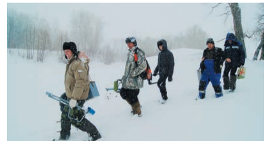
...ни на рыбалке

Тем более что во многих филиалах 23 февраля давно принято отмечать по-спортивному. В Бузулукском ЛПУ дружной компанией отправились играть в боулинг, в Алексеевке второй год подряд устроили праздничный турнир по хоккею на валенках, в котором приняли участие четыре команды. Накал страстей подогревала горячая поддержка болельщиков и свежесваренный чай с пирожками и булочками. В преддверии Дня защитника чемпионский титул справедливо защитила команда ГКС, вторыми стали хоккеисты администрации, третьими — сборная ЛЭС и ЭТВС.