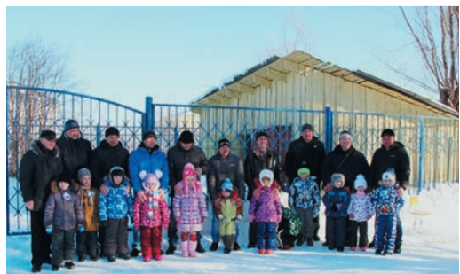
В спортивном празднике в Кар талах приняли участие взрослые и дети