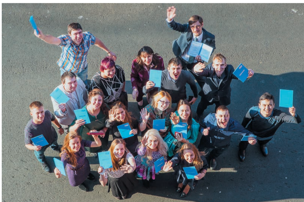
Три года обучения не прошли даром — полученные знания открывают перед ребятами новые перспективы

Среди выступлений, в которых ребята рассказывали о том, чего удалось добиться