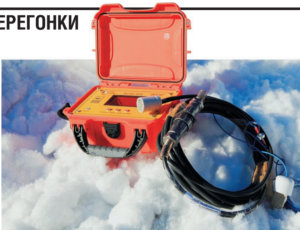
Новые сенсоры ставропольского завода не уступают продукции мировых брендов

В «Газпром трансгаз Екатеринбург», который выбран в качестве площадки для опытно-промышленной эксплуатации новых отечественных сенсоров оценки скорости коррозии, состоялись приемочные испытания с участием представителей Отдела защиты от коррозии ПАО «Газпром», ПО ЗК и ИТЦ нашего предприятия, компании «Нефтегазтехэкспертиза» и завода газовой аппаратуры «НС» (г. Ставрополь).