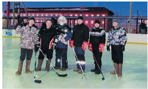
Хоккейный турнир в Шадринском ЛПУ проходил по круговой схеме

В Шадринском ЛПУ подведены итоги V хоккейного турнира на валенках. В каждом управлении этот вид спорта, уже переставший быть экзотикой, имеет свои правила. В Зауралье на ледовый корт, как и в классическом хоккее, выходит пятерка и вратарь, а игровое время сокращено до двух 15-минут, где последняя минута матча отыгрывается по чистому времени.