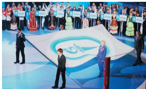
Церемония открытия уфимской Спартакиады поразила участников и гостей спортивного праздника интерактивным театрализованным шоу по мотивам главного башкирского эпоса об Урале — Богатыре и Птице счастья