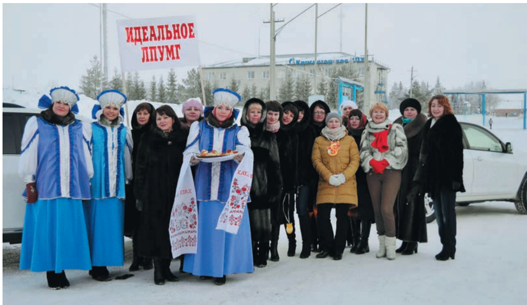
Все для мужчин готовы сделать работницы Красногорского ЛПУ