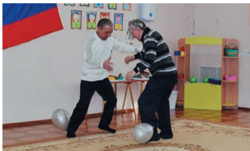
Защита и нападение в исполнении домбаровских дедушек

Не забыли поздравить своих дедушек и пап самые маленькие трансгазовцы. В карталинском д/с «Малышок» по традиции устроили спортивные состязания, где папы стали активными участниками и азартными болельщиками. В д/с «Снежинка» Домбаровского ЛПУ в футбол сразились даже дедушки.