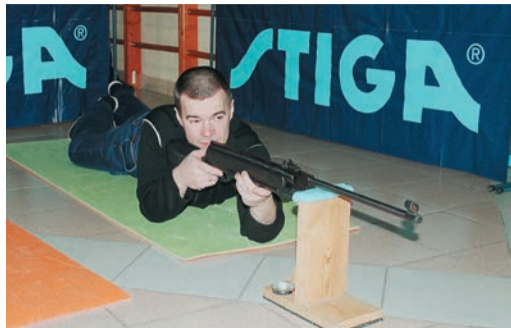
22 женщины и 31 мужчина взяли в руки оружие