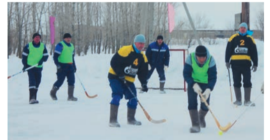
Порывы ветра и морозец не смогли охладить спортивный азарт праздника ни на поле...

Тем более что во многих филиалах 23 февраля давно принято отмечать по-спортивному. В Бузулукском ЛПУ дружной компанией отправились играть в боулинг, в Алексеевке второй год подряд устроили праздничный турнир по хоккею на валенках, в котором приняли участие четыре команды. Накал страстей подогревала горячая поддержка болельщиков и свежесваренный чай с пирожками и булочками. В преддверии Дня защитника чемпионский титул справедливо защитила команда ГКС, вторыми стали хоккеисты администрации, третьими — сборная ЛЭС и ЭТВС.