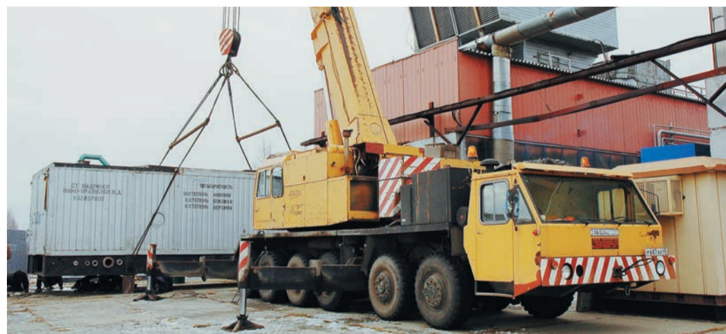
В Далматовском ЛПУ приступают к установке очередного блок-кузова

Однако на этот раз три блок-кузова с турбодвигателями прибыли в Далматовское ЛПУ не из Тюмени, а из Новосибирска. Еще в конце 1980-х в Новосибирском ЛПУ, ныне входящем в состав ООО «Газпром трансгаз Томск», собирались строить компрессорную станцию. Были закуплены однотипные с далматовскими ГПА,