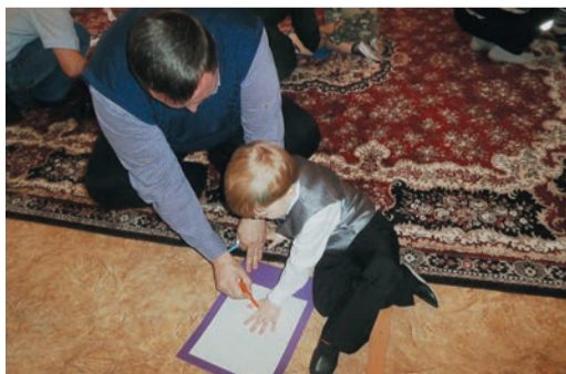
Рука об руку с дочками-сыночками отмечали 23 февраля работники Далматовского ЛПУ

Во всех детских садах на трассе прошли выставки рисунков и военной техники, были организованы фотоэкспозиции и утренники. Ребятышки читали стихи,