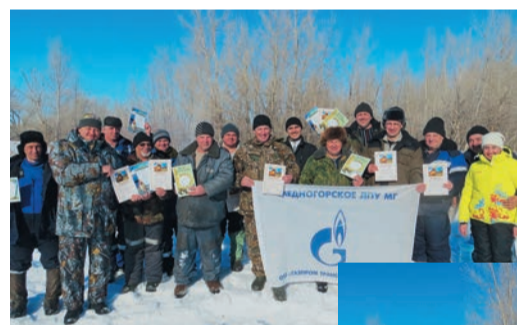
В соревнованиях приняли участие четыре команды — по две от каждого управления

В красивейшем затоне на реке Урал состоялся ставший уже традиционным турнир по зимней рыбалке, ор-