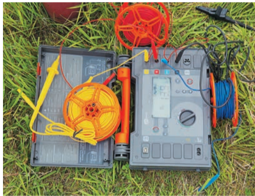
Новая аппаратура на вооружении у антикоррозионщиков

На апробацию Временного порядка был выделен год, и минувший декабрь стал временем подведения итогов. По данным ПО ЗК, профильным службам в ЛПУ пришлось заметно нарастить объемы и повысить качество, чтобы соответствовать требованиям документа. Специалисты ИТЦ, в свою очередь, провели большую работу по обследованию «пограничных» участков трассы между зонами ответственности