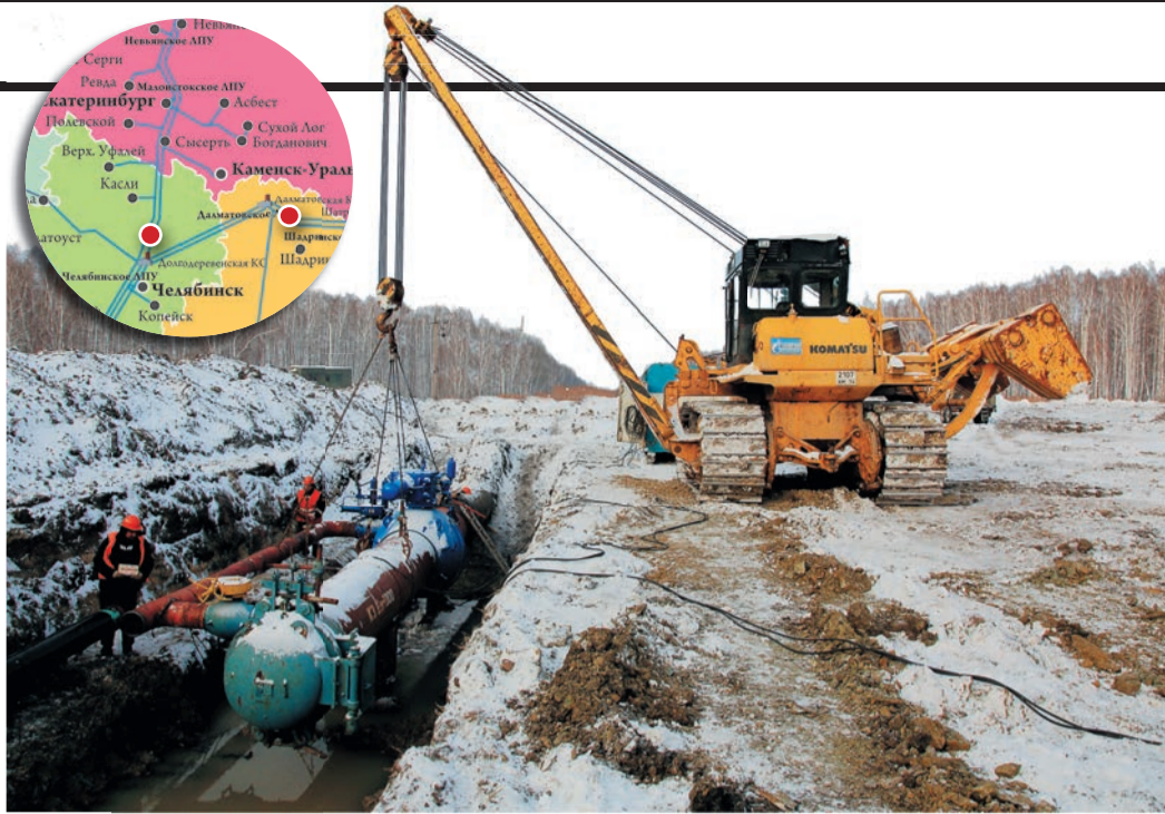
Временная камера запуска поможет отправить поршни от Течи до Сысерти

филиалов. Кроме того, ИТЦ дана оценка результативности установок дренажной защиты, многое сделано для повышения эффективности анодных заземлителей.