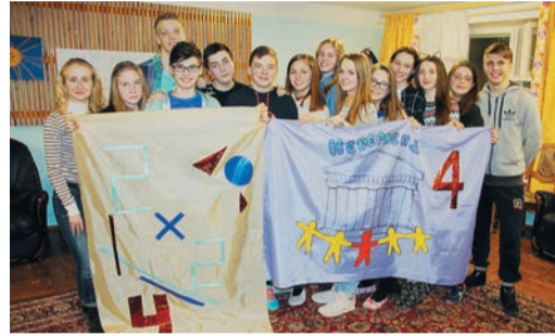
Старшеклассники успели и с горки покататься, и старинные танцы вспомнить, и творческие способности проявить

Школьников ждал сюрприз. В этом году организаторы существенно изменили программу, превратив неделю обучения в одно большое соревнование. Ребят разделили на два «крупных университета» со своими ректорами, факультетами, уникальными флагами и зачетными книжками. Им предстояло состязаться друг с другом, набирая баллы за участие в творческих и спортивных мероприятиях, дискуссиях, за успехи в учебе и даже своевременный «подъем» на зарядку. За нарушение дисциплины оценку могли снизить.