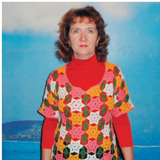
В вязаные вещи мастерица вкладывает свои добрые мысли