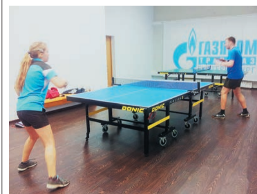
Обойти 16-летнюю теннисистку не смогли ни сверстники, ни более опытные соперники