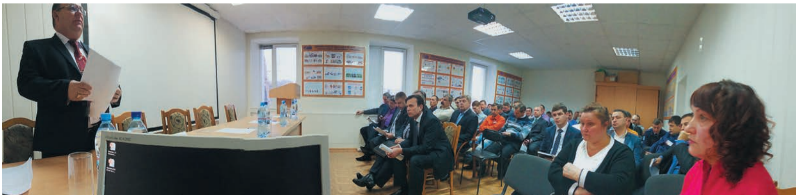
Собрание коллектива Бузулукского ЛПУ прошло одним из первых

В «Газпром трансгаз Екатеринбург» началась проверка выполнения обязательств Коллективного договора за 2015 год. Для этого во всех подразделениях должны пройти встречи трудового коллектива с представителями Администрации предприятия и Объединенной профсоюзной организации. Помимо подведения итогов реализации одного из основных документов Общества на них в этом году также выбирают председателей профсоюзных комитетов на следующие пять лет.