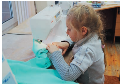
Юные рукодельницы с успехом освоили швейное мастерство и представили свои первые модели публике

ращаться со швейной машинкой и освоили непростое ремесло. Пошив одежды требует кропотливости и большого терпения: детали будущих моделей создаются вручную. За образец взяли выкройки из модных журналов. Остальное делали сами: и шили, и мерки снимали. Подсчитывали, где убавить, где прибавить, кроили и переносили заготовки на ткань. Все своими руками! «Главное научить их, объяснить сам процесс. И они все смогут. Я им только готовые