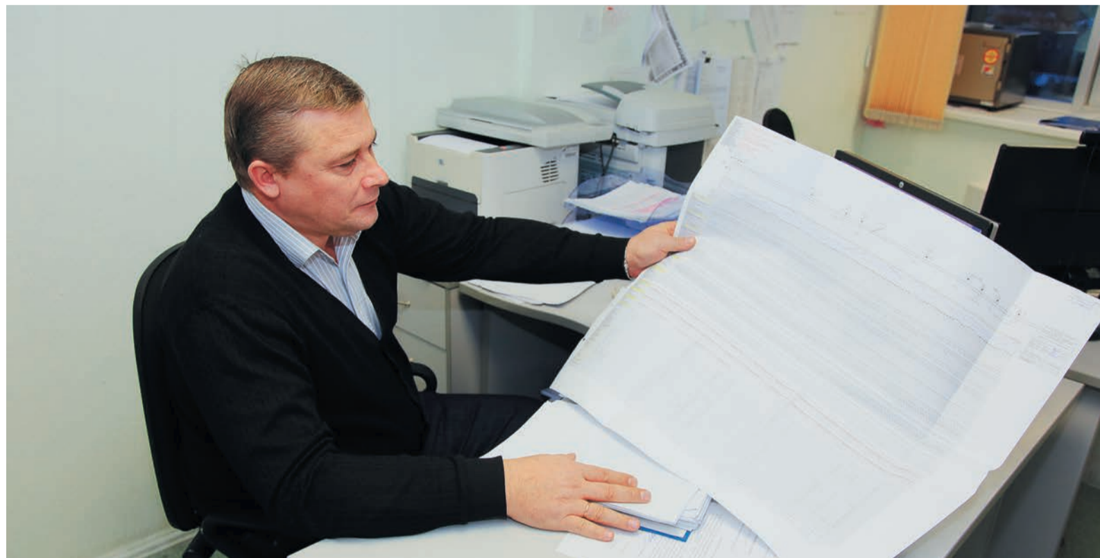
Новая методика сбора и обработки данных позволяет «читать» газопровод, словно открытую книгу

Весной прошлого года на предприятии был впервые введен в действие Временный порядок проведения сезонных замеров защищенности от коррозии объектов транспорта газа — документ, направленный на повышение эффективности работы служб защиты от коррозии в филиалах и ИТЦ. Основная задача — добиться 100% защищенности всех газопроводов.