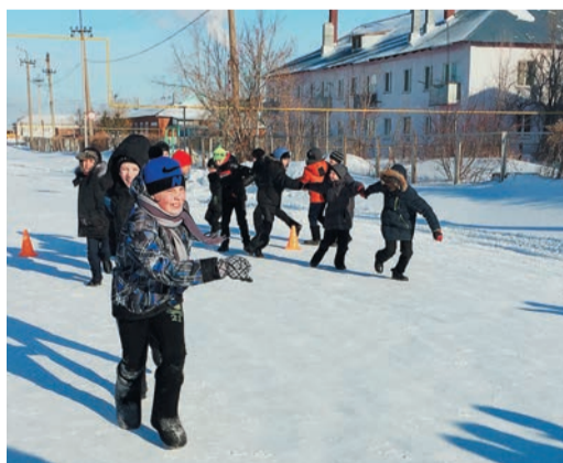
Старый новый год в Домбаровке отмечали по-спортивному, а в Кызылбае — с театральным уклоном

На КС-16 Домбаровского ЛПУ Новый год по старому стилю празднуют со дня основания станции. А поскольку ряженые с рождественскими песнями, праздничными колядками и стихами о зиме обошли весь поселок еще 7 января, то через неделю ре-