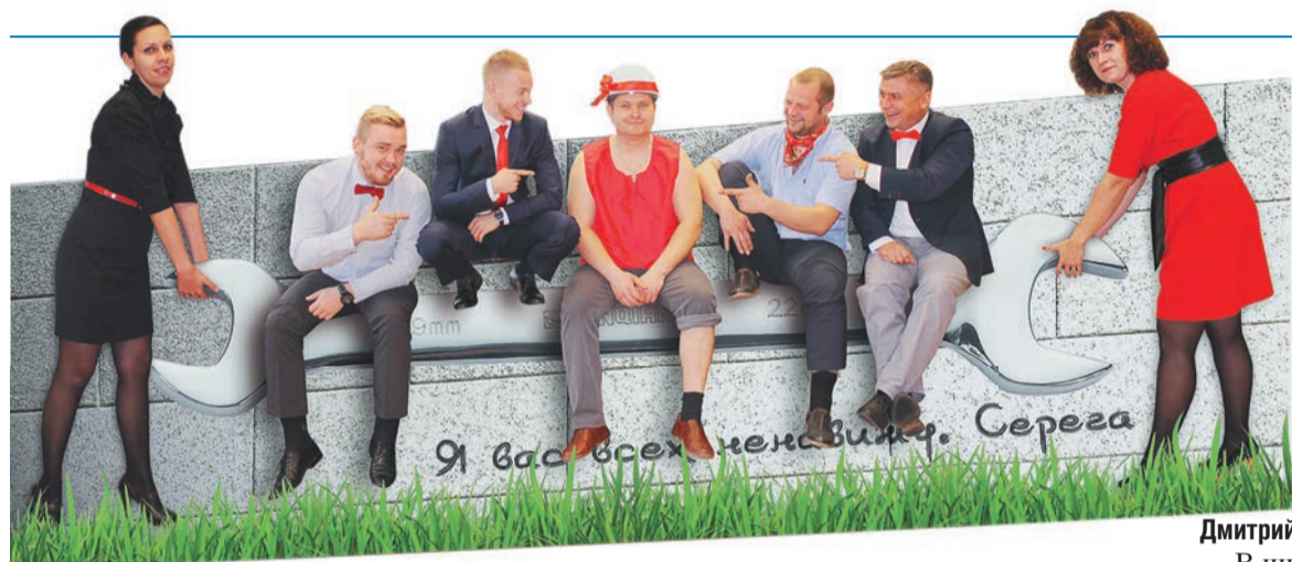
Команда УТТист «Алё-гараж!» в полном составе приносит свои... поздравления