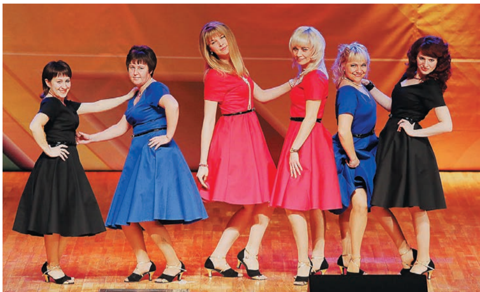
Мы, женская команда лиги КВН «Золотые трубы» ГКС-16, в первую очередь хотим поздравить прекрасный пол.

А вам, дорогие мужчины, желаем любить нас такими, какие мы есть, — веселыми и находчивыми! С Новым годом!