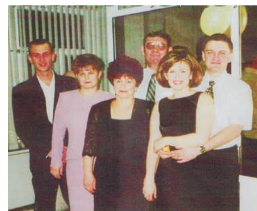
Большую семью связала газовая труба