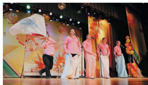
Команда Карталинского ЛПУ «Личный вклад» вспоминает...

— Каждый Новый год я давал соседу 500 рублей, чтобы он переделался в Деда Мороза и принес моим детям подарки. Но в этом году мои дети попросили братика, и, знаете, я, наверное, сэкономлю и займусь подарками сам. Радуйте сами своих детей, с наступившим! Всех с Новым годом! Команда КВН «Алё-гараж!»