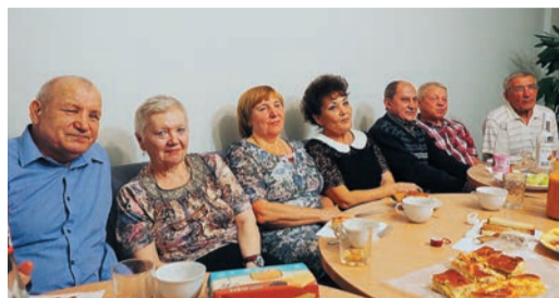
На День автомобилиста к магнитогорцам присоединились ветераны ИТЦ (на фото в центре) Оренбургского (слева) и Челябинского (справа) управлений

Желающие появились не только в Магнитке. А в последние годы многие выбирают на «Глухое» по нескольку раз в год. В апреле и октябре в профилактории отды-