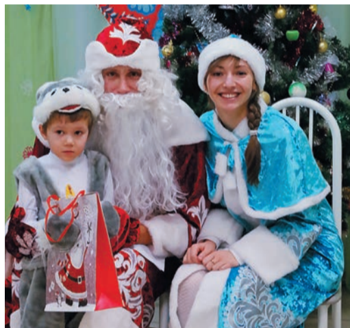
Некоторые малыши просто хотели прикоснуться к «настоящему» Деду Морозу, потрогать его за бороду

Впервые ряды «волонтеров», помогающих случиться новогоднему чуду, пополнили