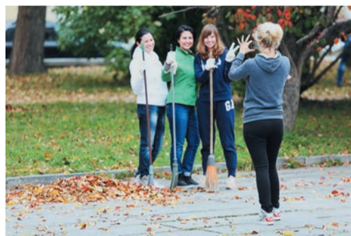
Фото на память: улыбнитесь, вас снимает скрытая камера