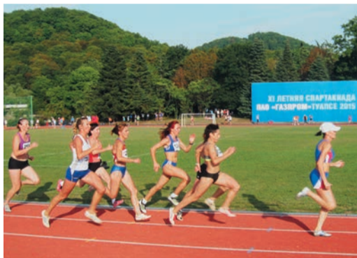
Очень стабильно выступила женская команда ГТЕ по легкой атлетике

Мужчины после «личек» и вовсе забрались на вторую позицию. А на первых двух эстафетных этапах наши парни отчаянно бились на голубых дорожках за первую строчку с «амфибиями» из Югорска. Северянам удалось включить форсаж и убежать по волнам за «золотом». А нам на хвост присел Нижний Новгород, так что пришлось по ходу пьесы корректировать задачу. Вода кипела, трибуны заходились в экстазе. Волжане на мгновение раньше совершили финальное касание, мы в итоге — третьи в командном зачете. Две «бронзы», выуженные из бассейна, упрочили положение сборной Трансгаза. Теперь надежда была на игровиков.