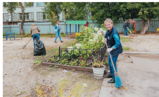
Кадры решают всё: в детском саду №303 дружно трудилась команда из ОК, ТО и СР