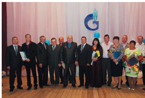
В Алексеевке умеют отдыхать и умеют работать, а главным объектом внимания на протяжении сорока лет остается компрессорная станция