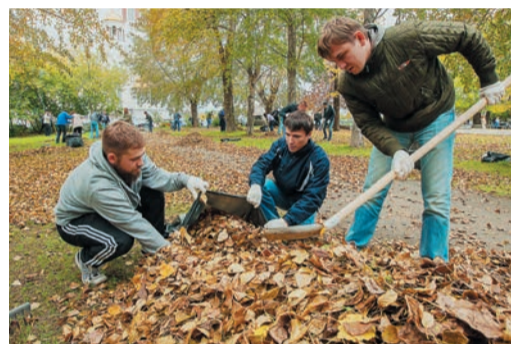
Золотая урожайная осень: природа не поспешила, и опавшей листвы хватило на всех