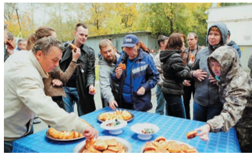
Кто работает, тот ест: закончилась «уборочная» фуришетом с горячими беляшами, вкусными пирожками и ароматным чаем