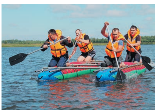
Гребля на рафтах прочно вошла в программу спортивных состязаний Далматовского ЛПУ

На протяжении года газовики мерились силами в настольном теннисе, бильярде, дартсе, стрельбе из пневматической винтовки, бадминтоне, летней