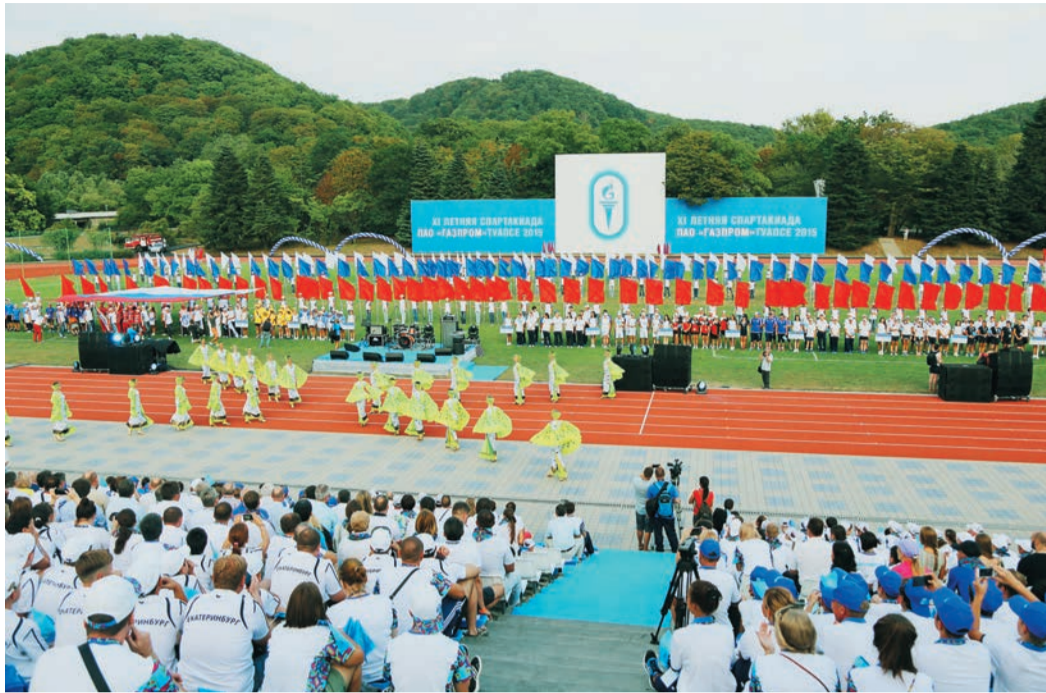
Столицей спартакиад стал Всероссийский детский центр «Орленок» — именно здесь прошли церемонии открытия и закрытия Игр

Зато «намыли» в бассейне драгоценного металла пловцы. Вся женская четверка в личных заплывах оказалась в своих возрастных группах в пределах первой десятки, что в сумме дало третье промежуточное место. Оставалось удержать его в эстафете, что девушки и сделали!