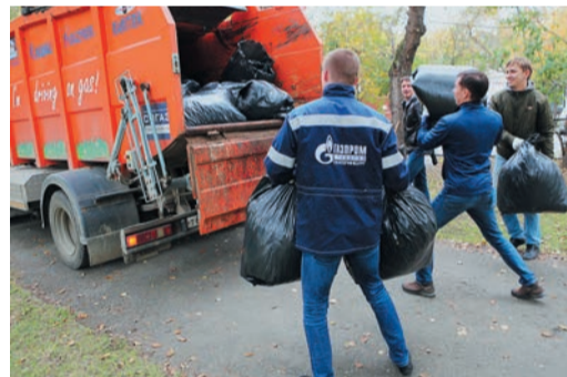
Точный бросок: спецмашину «дарами осени» упаковали под завязку