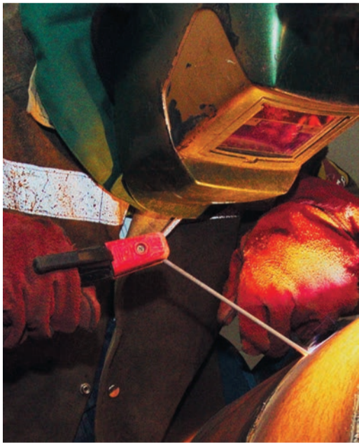
На этот раз самым сложным для сварщиков стал ремонт кольцевого стыка

Такого комплекса огневых в Бузулукском ЛПУ не было давно. За трое суток предстояло выполнить плановую замену нескольких запорных устройств и устранить выявленные при ВТД дефекты. Предварительно газ на участке сработали на потребителя через ГРС «Сорочинск» и «Тоцкое».