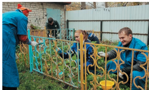
В детском саду №506 в пос. Компрессорный не только убрали территорию, но и обновили заборы