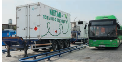
На площадке будут находиться два заправщика; как только в одном метан закончится, его отправят на заправку и подключат другой

В Екатеринбурге на площадке автотранспортного предприятия (АТП) №6 состоялась презентация оборудования для заправки новых газовых автобусов.