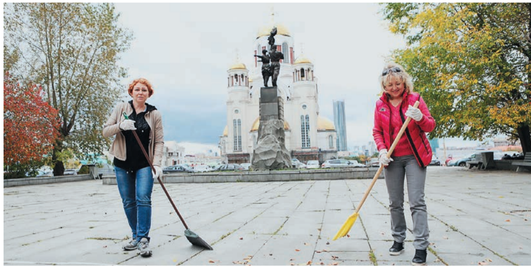
Место встречи изменить нельзя: центральной площадкой субботника работников Администрации стал сквер напротив главного офиса ГТЭ

Во вторую неделю сентября уральские газовики завершали «уборочную» кампанию: абсолютно во всех филиалах ГТЭ прошли субботники. Это масштабное мероприятие проводилось в рамках Всероссийской экологической акции «Зеленая Россия 2015». 11 сентября в Екатеринбурге работники Администрации Общества наводили порядок сразу на нескольких площадках: в сквере на Вознесенской горке, а также на территории детских садов №506 и №303. Вот как это было.