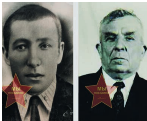
До и после войны: две фотографии — как две эпохи