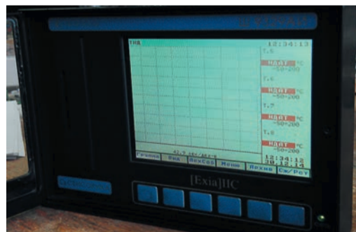
Прибор с установленной лентой