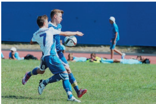
Порадовали юные футболисты, которые победным маршем прошагали до финала