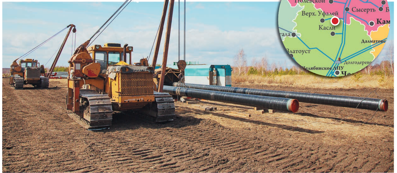
Одна за другой с временного стапеля сходят готовые плети-трехтрубки

У археологов эти каменные палатки получили название «Святылище Большие Аллаки». На гранитных валунах еще можно отыскать древние писаницы. Невесть сколько веков назад здесь собирались жрецы и воины: приносили жертвы богам, устраивали состязания лучников. Но сегодня наша дорога лежит мимо этих скал, мимо озера Аллаки, в сторону другого озера — Алабуга, где УАВР-1 выполняет ремонт отвода к городам Касли и Верхний Уфалей.