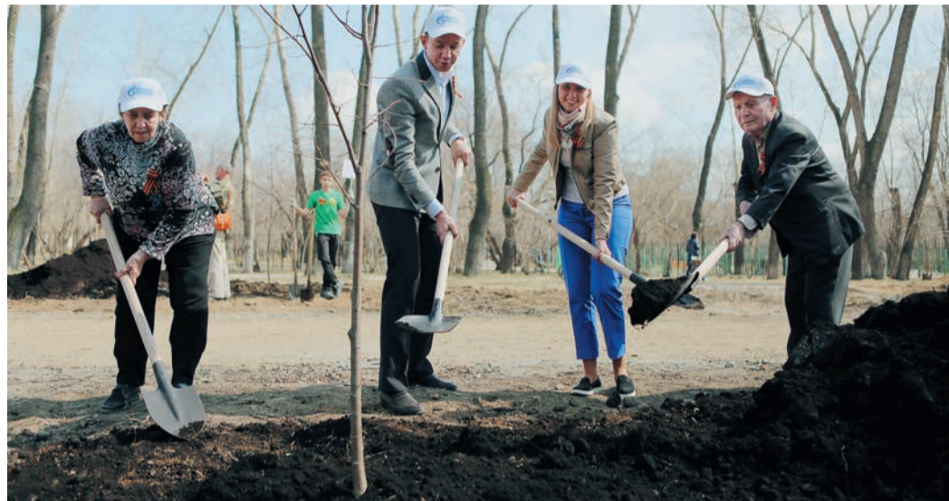
В высадке Аллеи памяти приняли участие ветераны и молодые специалисты Общества

Нынешний юбилей отмечается особенно торжественно. Кроме чествования ветеранов, в программу празднования были включены десятки мероприятий — величественные парады и митинги. Шествие Бессмертного полка, перешагнувшего через границы. Детские конкурсы рисунков, песен и стихов. Легкоатлетические эстафеты и велопробеги. И, конечно, высадка памятных аллей. Одна из таких акций по инициативе городской администрации состоялась в столице Среднего Урала.