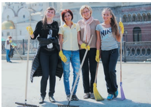
Экологическая акция получилась по-настоящему массовой: в субботнике приняло участие почти полторы сотни работников администрации. Короткий перерыв — и снова за работу: времени хватило, чтобы достойно потрудиться и чтобы приятно пообщаться.