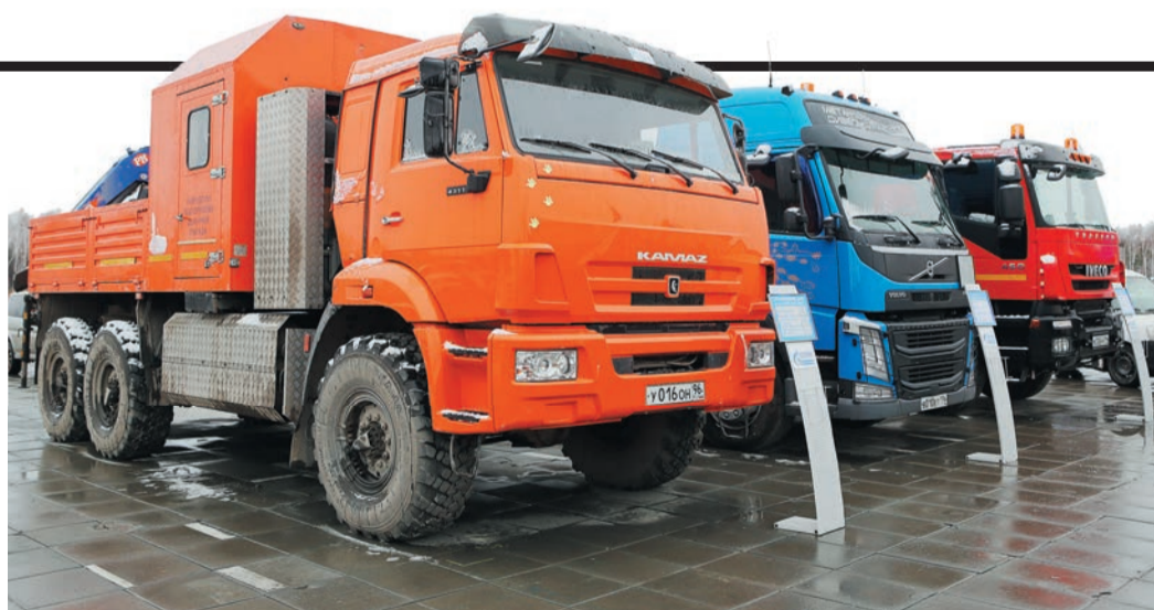
В рамках форума прошла выставка газомоторной техники ООО «ГТЕ»