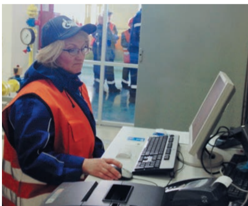
Наполнители баллонов впервые состязались на базе Челябинского отделения УППЦ

Проверка теории, традиционно организованная в форме теста, состоялась в компьютерном учебном классе. Конкурсантам предстояло ответить на 50 вопросов. При обработке теста использовалась компью-