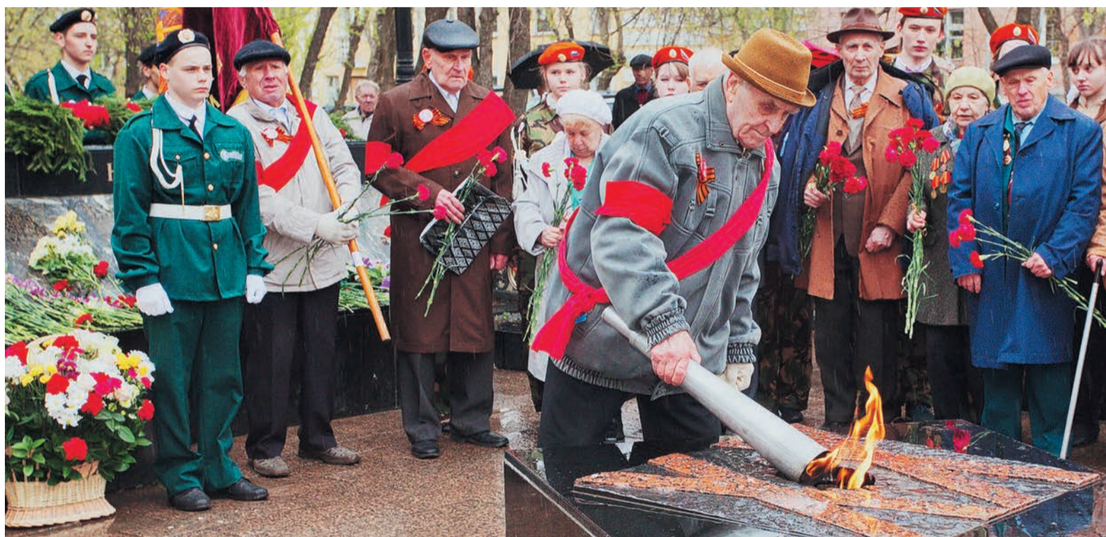
Пламя Вечного огня — как память о том мировом пожаре, который не должен больше повториться

70 лет. Эта цифра примерно равна официальной средней продолжительности жизни в нашей стране. Теоретически, целое поколение успело родиться, вырасти и состариться с того дня, когда был подписан акт о капитуляции Германии. Фактически, конечно, и выросло, и состарилось намного больше. Некоторые стареют быстро и уходят рано. Но вновь и вновь люди, подчас с болью и кровью, заново переживают эту войну и эту победу — сегодня очевидно, что и 70 лет еще не тот срок, чтобы все эмоции остались позади. Но даже в этом году, когда накал политических страстей вокруг прошедшей войны, кажется, уже перешел точку кипения, этот праздник Победы должен был оставаться человечным, понятным и близким всем, начиная от самых юных и заканчивая теми, кто действительно видел, как наши войска брали Берлин или как подростки пахали землю и точили на заводе снаряды.