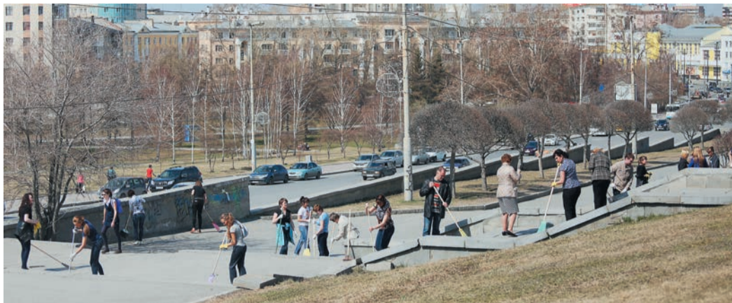
Субботник, который провели работники Администрации Общества, изначально должен был состояться 24 апреля. Однако «небесная канцелярия» внесла в планы газовиков свои коррективы: внезапно выпал снег, и мероприятие пришлось перенести на неделю. Зато 30-го погода выдалась просто на загляденье. В этот день десятки человек, вооружившись лопатами, граблями и метелками, дружно выжили на уборку сквера на Вознесенской горке в Екатеринбурге.