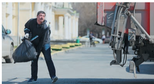
Примерно за час было собрано огромное количество бытового мусора: чтобы вывезти все это «добро», пришлось прибегнуть к услугам спецтранспорта.

Подготовили Сергей КАЛЕННИКОВ и Татьяна ПИСКУНОВА