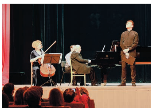
Концерт стал символическим подарком России и Австрии к Дню Победы

И это весьма символично. Ровно 70 лет назад в эти же апрельские дни завершилась Венская операция советских войск, было сформировано временное правительство Австрии, принята декларация о независимости государства. И музыка Бетховена, Мендельсона и Шуберта в исполнении российских и австрийских музы-