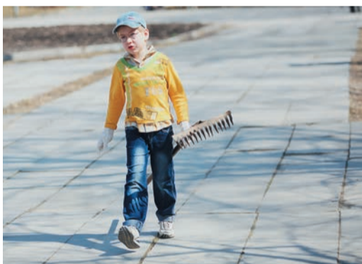
В уборке сквера приняли участие и будущие газовики — дети работников предприятия: так что кое для кого мероприятие получилось не только корпоративным, но еще и семейным.

М олодые специалисты Шадринского ЛПУ движутся в русле новых веяний. Как и было запланировано, они дружно вышли на уборку 25 апреля — в первую же субботу месячника чистоты. Было прохладно, но не снежно: погода позволила поработать с полной отдачей и навести на площадке полный порядок.