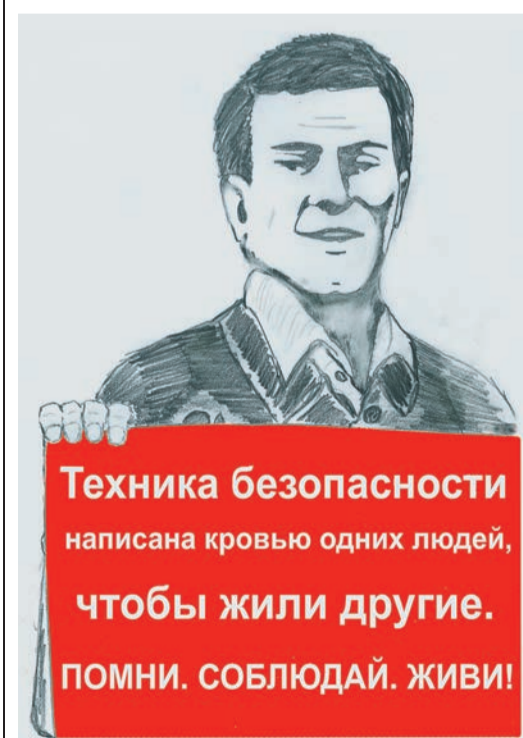
Автор: Денис Волков, заместитель начальника Службы по связям с общественностью и СМИ «Газпром трансгаз Екатеринбург»

Уважаемые читатели! Конкурс агитплаката «Трансгаз — территория безопасности!» продолжается. Свои работы присылайте по почте или приносите в Службу по связям с общественностью и СМИ (г. Екатеринбург, ул. Свердлова, 7, каб. №1315). Также вы можете отправить их в электронном виде на адрес: