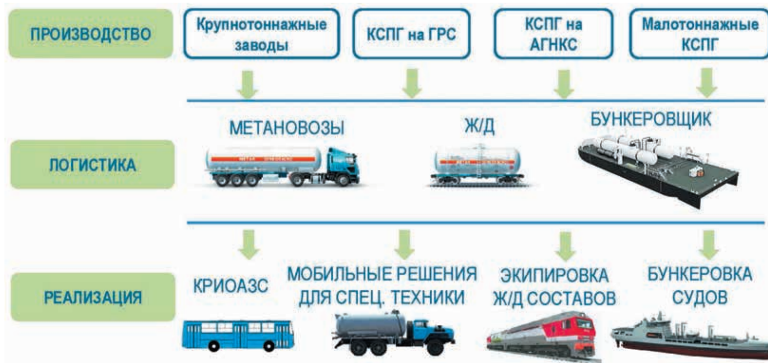
Материалы семинара-совещания по перспективам использования в России СПГ