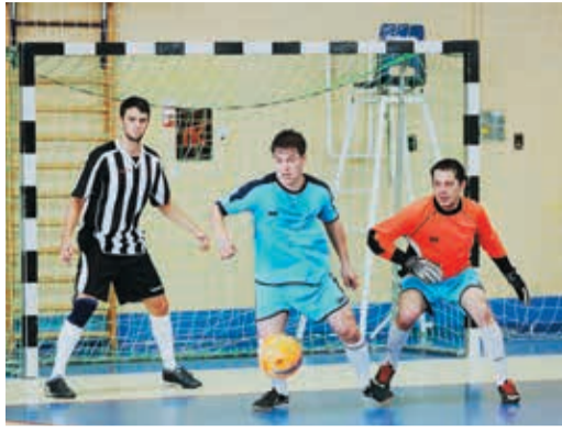
Каждый год финальный турнир дарит болельщикам сразу несколько ярких футбольных спектаклей

Футболисты СКЗ и ЧЛПУ два года подряд встречались в главных матчах, но нынче