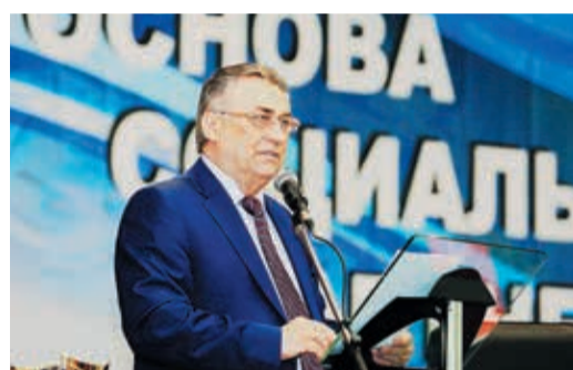
В ходе конференции были озвучены вопросы как действующих работников Общества, так и ветеранов предприятия