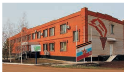
К концу года здание СЭБ должно полностью преобразиться

Никаких изменений правил вступления в «Газфонд» на сегодня нет и не планируется. Работник должен достичь пенсионного возраста и иметь определенный стаж работы в Обществе. Остальное зависит от работодателя — его обязанность правильно рассчитать размер пенсии и перечислить взнос за работника. Корпоративная пенсия по-прежнему формируется за счет средств работодателя. Никаких дополнительных средств работников привлекать не планируется, это тоже осталось неизменным. Если работники хотят еще больше увеличивать свою будущую пенсию, никто им не мешает самостоятельно открыв альтернативный пенсионный счет.