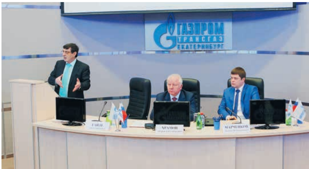
За последние годы Екатеринбург превратился одну из главных дискуссионных площадок, где обсуждаются вопросы развития «газотормки»

В начале апреля на площадке ГТЕ состоялось межотраслевое совещание, посвященное возможным направлениям сотрудничества ОАО «Газпром» и отечественных производителей автотракторной техники. Газовики и представители машиностроительных предприятий обсудили вопросы перевода машин на сжиженный природный газ (СПГ).