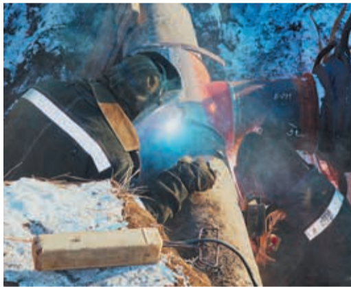
Общее количество работников Трансгаза на начало 2015 г. составляет 9422 человека

Также в полном объеме выполнена программа капитального ремонта. Стоить