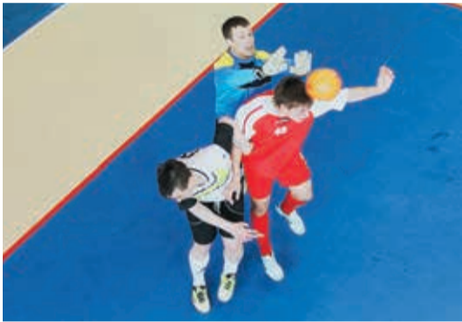
Дороги ЧЛПУ и СКЗ на сей раз пересеклись не в главном матче, а чуть раньше

Многие еще помнят времена, когда чемпионы Общества определялись исключительно по итогам спартакиад. Однако после возрождения традиционных турниров пять лет назад в нашем футбольном королевстве регулярно стала возникать система двоевластия — непонятно, какую команду считать сильнейшей. Ту, что оказалась лучшей на Спартакиаде, или ту, что победила в чемпионате? Лишь невяницы однажды удачно разрешили эту дилемму: выиграв в 2011-м оба соревнования, они заслужили право единолично восседать на троне.