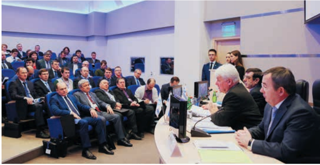
Представительные совещания по газомоторному топливу стали для Екатеринбурга традиционными

В конце февраля в Екатеринбурге состоялся семинар-совещание, посвященный перспективам использования в России сжиженного природного газа (СПГ) для газификации населенных пунктов и применения в качестве моторного топлива. Его участниками стали специалисты Газпрома, представители ряда регионов Уральского и Приволжского федеральных округов, производители автотехники и спецоборудования.