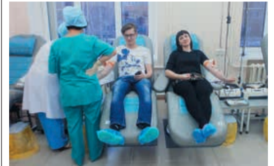
Молодые газовики «на ура» восприняли новую инициативу

В начале марта в Невьянском ЛПУ состоялась донорская акция. Группа молодых работников управления коллективно сдала кровь в невянском филиале общероссийской Службы крови. Этот специализированный пункт обеспечивает компонентами крови все лечебные заведения сразу двух районов — Невьянского и соседнего Кировградского, где собственная станция забора отсутствует.