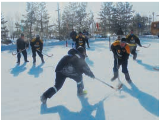
Алексеевцы отметили 23 февраля на катке, медногорцы смотрели на все праздники с высокой горы, а в Кызылбае устроили большой концерт для всех жителей поселка

В Алексеевском ЛПУ в этот день с утра на градуснике было -30, но мороз не помешал проведению праздничного блицтурнира по хоккею на валенках. Четыре команды боролись за победу, а досталась она дружине газокompрессорной службы. Мужчины ГКС-16 Домбаровского ЛПУ в преддверии праздника принимали поздравления и награды за участие во внутренней спартакиаде. Сильнейшей