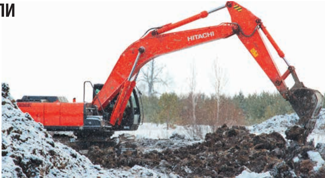
Любой ремонт на газопроводе начинается с шурфовки

Один за другим на МГ «Долгодеревенская — Сысерть» (Ду 1000) завершились два больших комплекса ремонтных работ. 20 января Малоистокское и Челябинское ЛПУ, каждое со своей стороны, вместе со сварочно-монтажными бригадами УАВР-3 и УАВР-1 отключили участок газопровода от 2093-го до 2118-го км, от Тюбука Челябинской области до села Никольское в Свердловской. На следующий день малоистокцы при поддержке УАВР-3 провели огневые работы по отключению следующего отрезка — до 2140-го км, фактически до Сысерти.