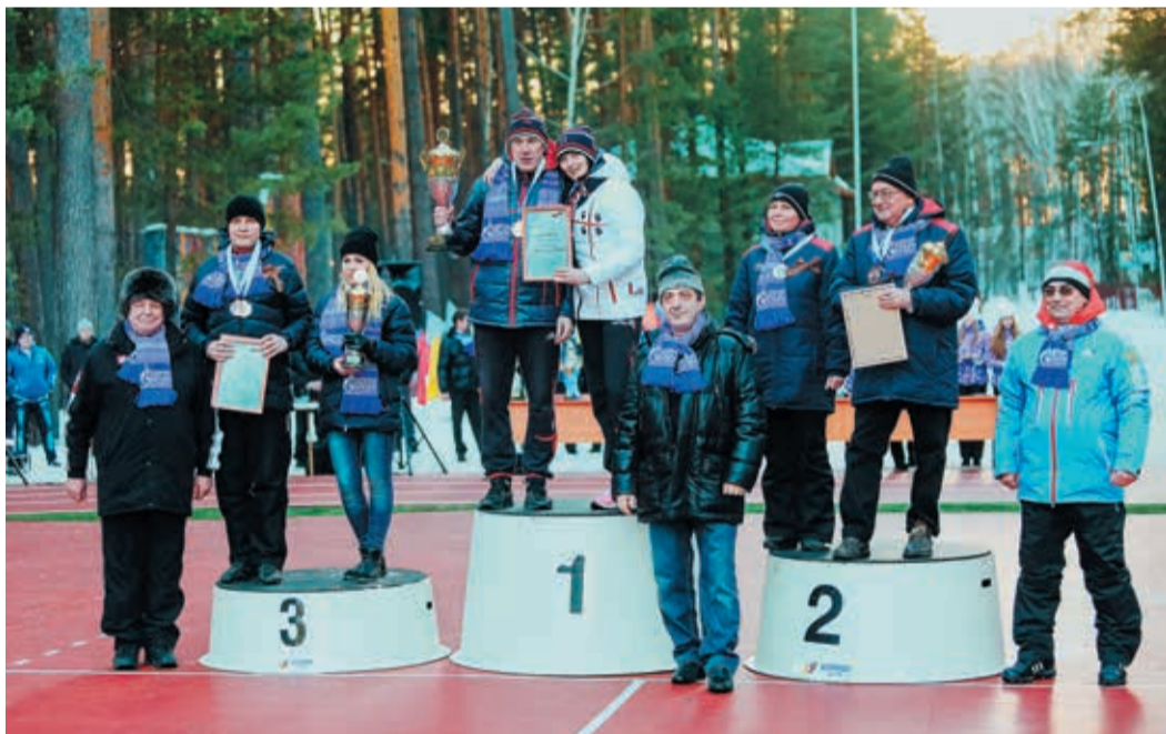
Командное первенство по шахматам осталось за дуэтом из Невьянска

На следующее утро бежали смешанную эстафету, где каждому участнику предстояло преодолеть 2,5 км. На первом и третьем