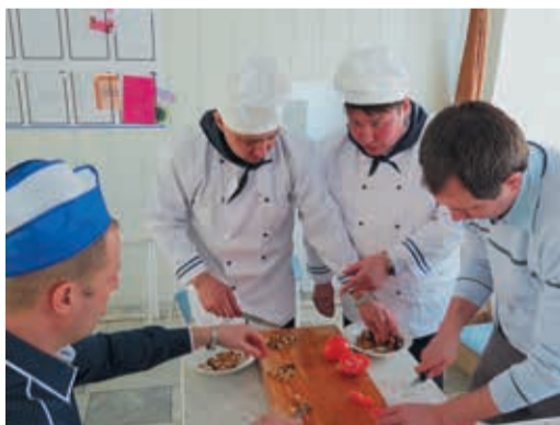
В Красногорке на 8 Марта состоялась фестиваль яичницы

Ну а в Медногорском ЛПУ в формате «23+8» организовали выезд на горнолыжный комплекс Кувандык. 5 марта после работы любители активного отдыха вооружились спортивным инвентарем и устроили праздничное катание с горы.