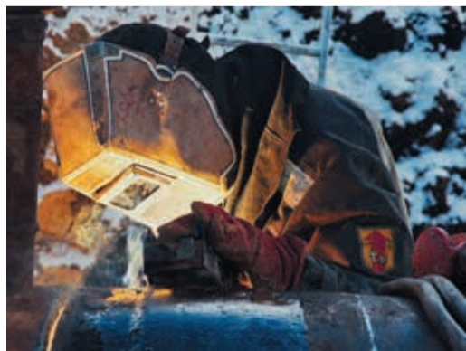
На трассе «Долгодеревенская — Сысерть» сварщики сделали десятки гарантийных сварных швов

Присылайте свои работы на адрес: S.Kalennikov@ekaterinburg-tr.gazprom.ru.