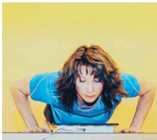
Полноценные медали впервые были разыграны в турнире по силовой гимнастике

повых турниров. В итоге три из четырех полуфиналистов прошлой Спартакиады вновь сошлись на этой же стадии. И лишь место дружины УАВР-3 заняли хоккеисты Малого Истока. В первом полуфинале они на равных бились со сборной УЭЗиС и уступили лишь с минимальным счетом — 0:1.