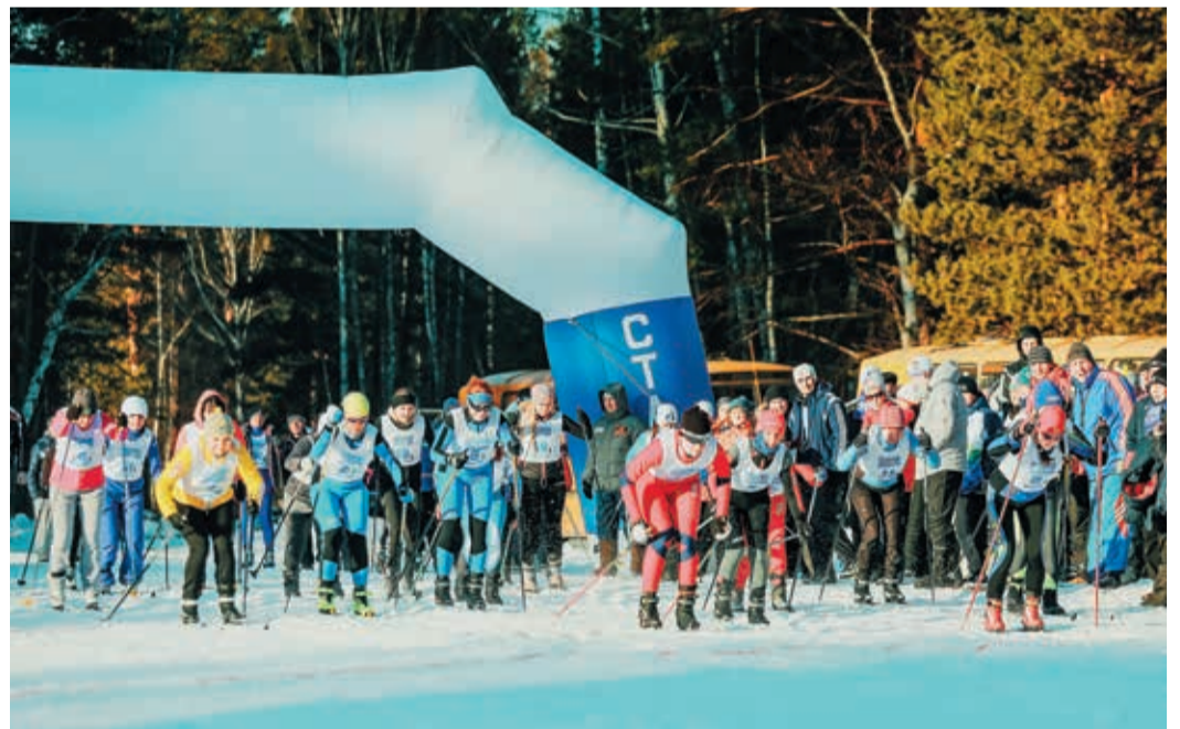
Массовый старт лыжной эстафеты стал одним из самых зрелищных моментов Игр