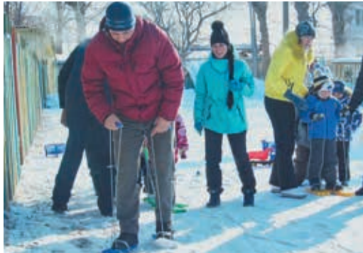
В Картах папы детсадовцев «встали на лыжи», а на ГКС-16 — дали детишкам полистать «Армейский альбом»

23 Февраля и 8 Марта — праздники, которые пришли к нам из советской эпохи. Их политическая окраска постепенно сошла на нет, и оба превратились в долгожданные дни, когда мужчины и женщины с удовольствием поздравляют друг друга. Сотрудники многочисленных филиалов нашего предприятия — не исключение.