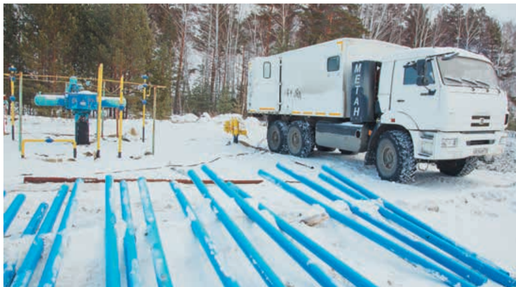
Замеры выполнены, столбы готовы — монтаж начинается

В Челябинском ЛПУ продолжаются работы по ремонту ограждений крановых узлов. Так, за прошлый год новые ограждения, выполненные по корпоративным стандартам ОАО «Газпром», появились на 12 крановых площадках. Четыре — на газопроводах-отводах и восемь — на различных нитках магистрального транспортного коридора «Бухара — Урал». В этом году планируется обновить еще четыре площадки на отводе к городам Касли и Верхний Уфалей. Эти работы должны пройти параллельно с ремонтом газопровода по результатам ВТД.