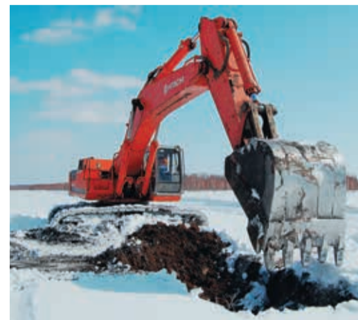
Здесь без гусеничной техники никак нельзя

В тех местах, где было достаточно зашлифовать каверну или заменить часть изоляции, работы выполнялись сразу. Из-за довольно мягкой зимы болотистая земля промерзла неглубоко, и многие шурфы изрядно подтапливало. Линтубам Далматовского ЛПУ, изоляровщикам и слесарям УАВР пришлось работать в условиях «ледяной бани», а экскаваторам — каждые полчаса-час вычерпывать скапливающуюся в прямых водах.