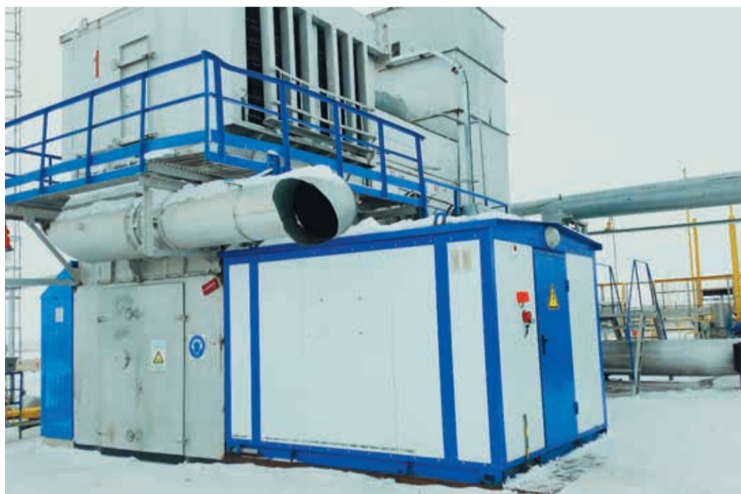
На первом из пяти ГПА КС «Бурдыгино» реконструкция системы управления завершена

Напомним, что обе станции уже прошли процедуру обновления. В первой половине 2000-х на КС была установлена система антипомпажной защиты «ССС»: тогда на обвязке ГПА заменили шесть краны и установили антипомпажные клапаны «Мокведд», персонал получил возможность следить за работой агрегатов в режиме он-