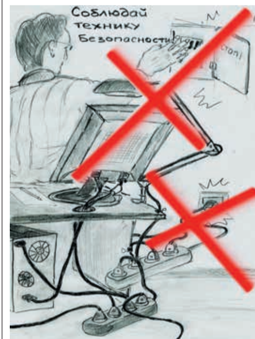
Автор: Денис Волков, заместитель начальника Службы по связям с общественностью и СМИ «Газпром трансгаз Екатеринбург»

Уважаемые читатели! Конкурс агитплаката «Трансгаз — территория безопасности!» продолжается. Свои работы присылайте по почте или приносите в Службу по связям с общественностью и СМИ (г. Екатеринбург, ул. Свердлова, 7, каб. №1315). Также вы можете отправить их в электронном виде на адрес: S.Kalennikov@ekaterinburg-tr.gazprom.ru .