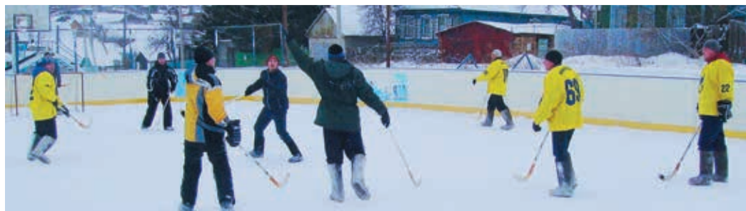
Хоккей на валенках прочно вошел в праздничную программу Медногорского ЛПУ

Давно известно: как Новый год встретишь, так он и пройдет. Поэтому многие работники ГТЕ решили не отступать от традиций и провели праздничные каникулы максимально активно.