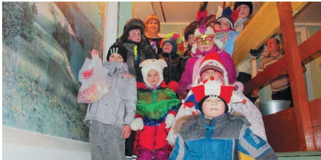
Колядуют в Кызылбае всем селом, вне зависимости от возраста и веры

Вот и отгремели салюты, отсверкали фейерверки, 2015-й вступил в законные права. Перед тем как с головой окунуться в работу, давайте вспомним несколько ярких моментов праздничных дней.