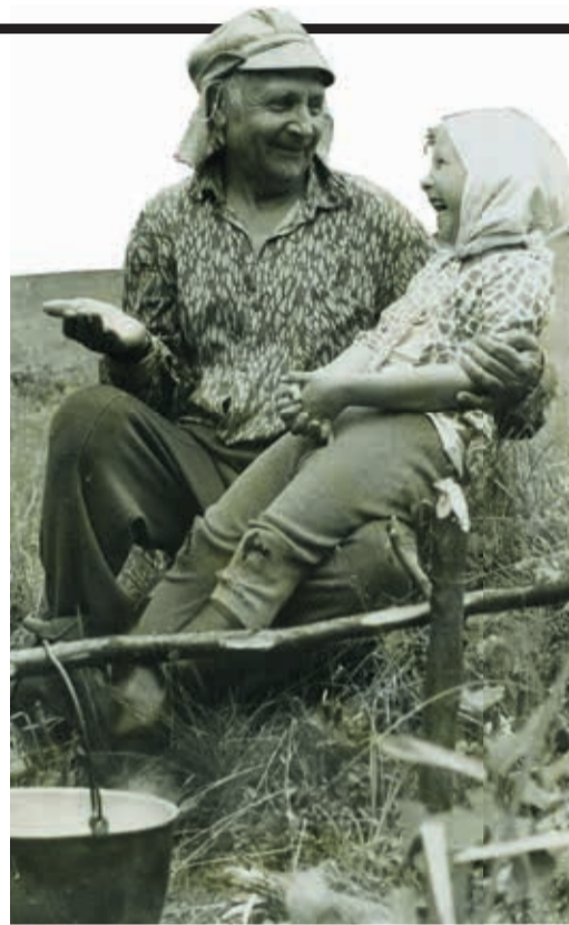
В рассказах ветерана была простая жизненная мудрость с большой долей хорошего юмора

В первый же день войны немцы начали нескончаемые бомбардировки расположенных здесь советских частей. Войска получили приказ отступать, предварительно уничтожив орудия и боекомплекты, чтобы не достались врагу. Сколько погибло тогда необстрелянных солдат и офицеров, сколько их полегло в первые часы и дни войны? 21-летнему лейтенанту и его бойцам помогла рыбачка литовского рыбохозяйства. От-