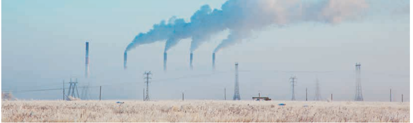
Будущее ЮГРЭС пока в тумане. На смену ей уже пришли два энергоблока ЮГРЭС-2

С утра окрестности Южноуральска заволочло столь плотным туманом, что только верхушки дымовых труб выныривают из густой меховой шапки, накрывшей город. Эти пять труб — визитная карточка ЮГРЭС-1, электростанции, построенной еще в конце 1950-х на левом берегу Южноуральского водохранилища. Но сегодня главные события разворачиваются на правом берегу, где подходит к концу большой комплекс работ по обеспечению топливом новых энергоблоков ЮГРЭС-2.