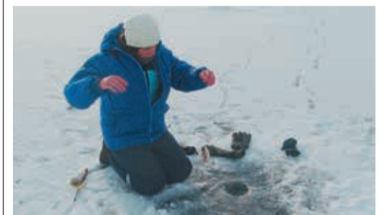
Кто сказал, что рыбалка не женское дело?

Незадолго до нового года любители зимней рыбалки из трех южных филиалов Общества встретились на льду Актярского водохранилища, расположенного в Хайбуллинском районе Башкирии, чтобы посостязаться в мастерстве подледного лова. Организаторами любительских соревнований выступили работники Медногорского ЛПУ. Подобные турниры они устраивают ежегодно, но в этот раз решили расширить масштаб состязаний, пригласив коллег из Алексеевского и Оренбургского управлений.