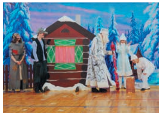
Невьянские новогодние приключения заинтересовали весь зал

Сказочное представление под ёлкой стало хорошей традицией и в Невьянском ЛПУ. Долго готовились инструкторы и участники кружков ФОКа «Старт» к представлению, и «Необыкновенные приключения в Новый год» удалась на славу. В большом спортивном зале оформили сцену, подготовили декорации, сочинили захватывающий сценарий про наивного Эльфа, потерявшего волшебные крылья. Ребята из танце-