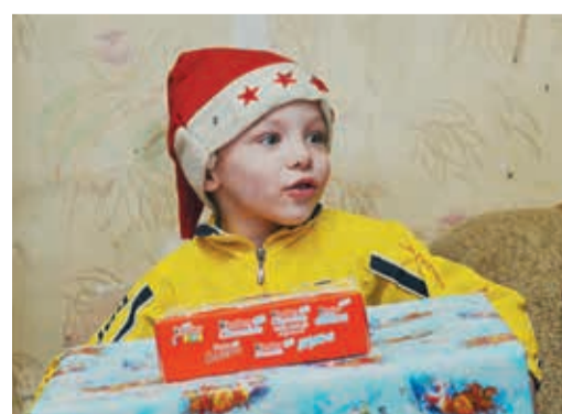
Дед Мороз и Снегурочка пришли в каждый дом

К 25 декабря, когда сбор средств и подарков завершился, их было так много, что кадровикам пришлось сделать несколько хо-