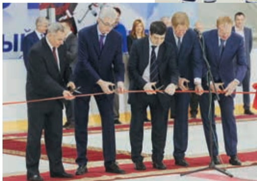
Открытие нового «Факела» — яркий пример частно-государственного партнерства

Жители микрорайона Компрессорный в Екатеринбурге теперь могут кататься на коньках даже летом. Накануне Нового года здесь благодаря программе «Газпром — детям» открылся новый современный физкультурно-оздоровительный комплекс «Факел» с большой ледовой ареной.