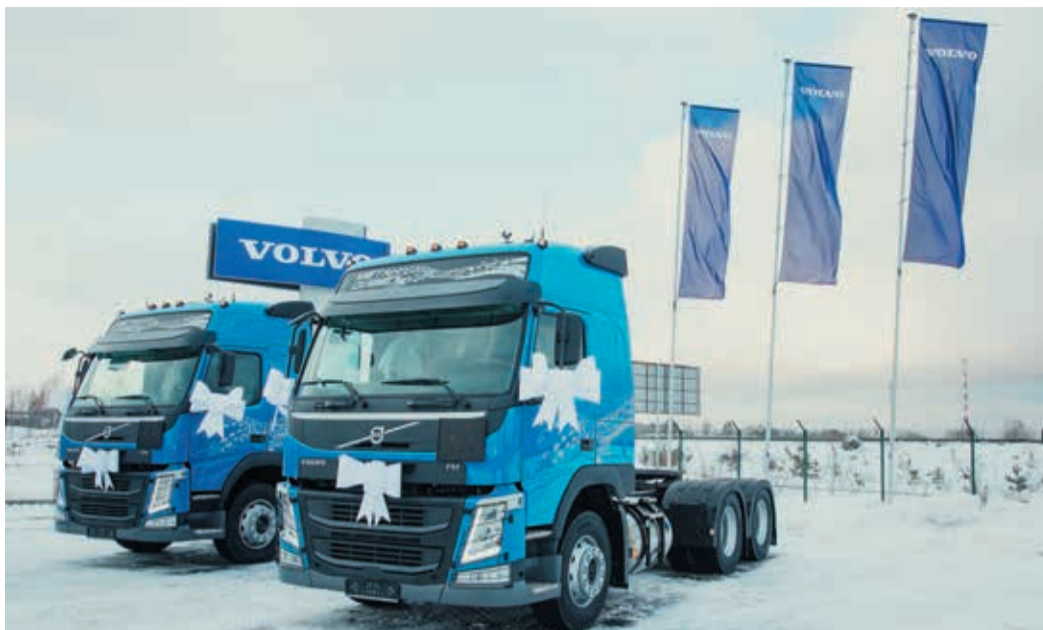
Главный козырь скандинавских красавцев скрыт в моторном отсеке

Перед самым Новым годом ГТЭ сделал себе шикарный подарок, пополнив производственный автопарк двумя новыми уникальными грузовиками Volvo FM с газодизельными двигателями. Эти седельные тягачи способны работать в смешанном цикле на дизельном топливе и сжиженном природном газе (СПГ). И это пока единственные в России подобные автомобили — Общество и здесь выступило пионером.