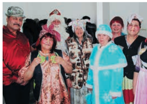
Театру все возрасты покорны

ствием. Первая концертная проба состоялась на праздновании Дня матери, а уже под новогодней елкой артисты показали себя во всей красе. В один миг пенсионеры преобразились в героев сказки «Морозко», да так лихо разыграли спектакль, что молодежь только ахнула.