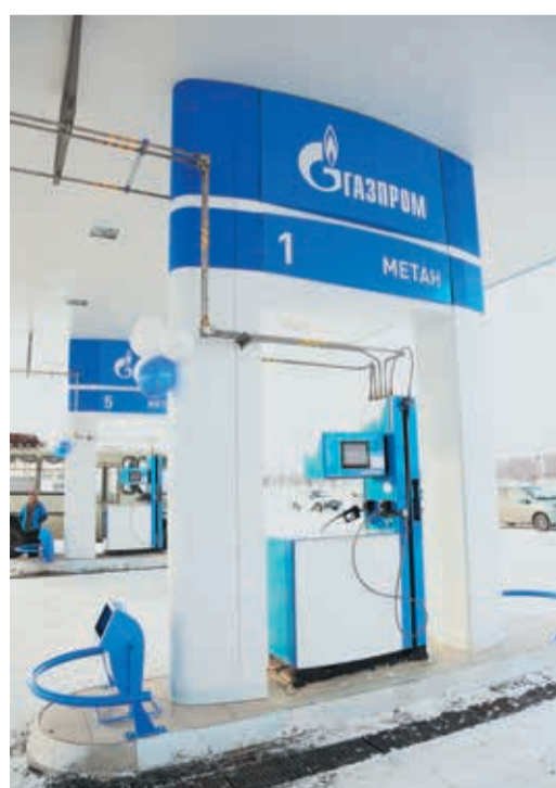
На заправочных станциях Управления «Уралавтогаз» проверки знаний являются регулярными

ками практических и теоретических заданий. Но, например, на АГНКС Орска