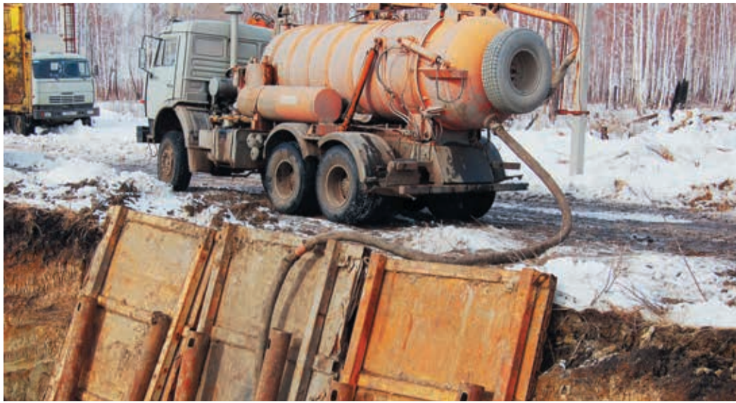
В курганских болотах приходится постоянно откачивать воду

В Курганской области, в зоне ответственности Шадринского ЛПУ, подходят к концу ремонтные работы на магистральном газопроводе «Комсомольское — Челябинск». Последние недели превратились в настоящий поединок между человеком и природой.