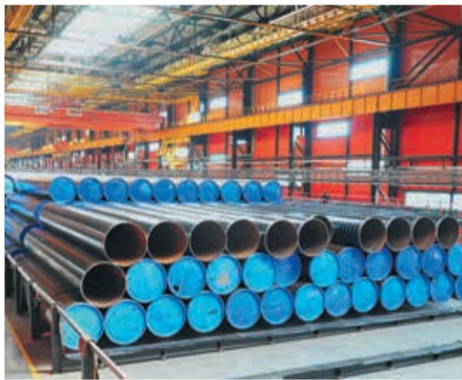
На строительстве «Силы Сибири» используются трубы большого диаметра

Уральские металлурги давно и активно участвуют в решении стратегических задач ОАО «Газпром». И вот в марте представители группы ЧТПЗ (Челябинский трубопрокатный завод) и специалисты Газпрома на производственной площадке Первоуральского новотрубного завода (ПНТЗ), расположенного в Свердловской области, обсудили возможности организации выпуска новых видов труб в рамках программы импортозамещения.