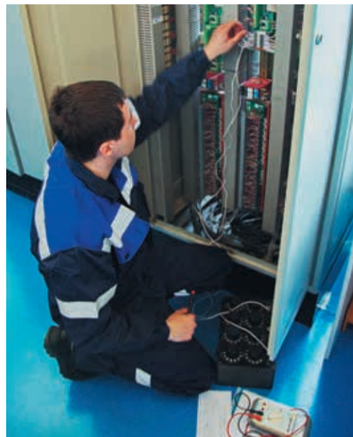
Третье задание поначалу казалось конкурсантам самым сложным

Гораздо больше «пятнашек» заработали конкурсанты на последнем испытании. Хотя первоначально именно оно вызывало наибольшее волнение. Дело в том, что основным объектом стал «действующий» приборный шкаф системы антипожарной защиты макета газоконденсаторной станции. Особенно тревожились представители тех ЛПУ, где вообще нет газоперекачивающих агрегатов. Но оказалось, что непосредственно к работе КС задание не имеет отношения. Нужно было выполнить проверку измерительного канала контролле-