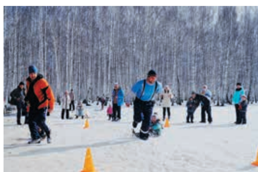
Невянянцы отправились на природу, вооружившись лыжами, клюшками, санками и валенками