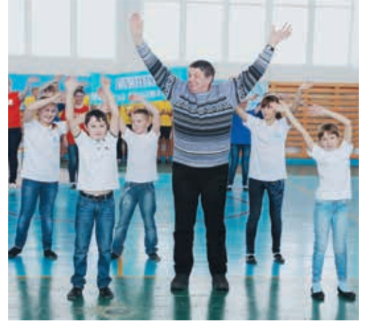
Организаторы соревнований даже церемонию награждения превратили в праздник