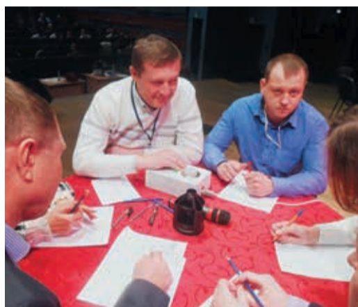
Команда УАВР-3 с первого захода поднялась на пьедестал

УЭЗиС — одна финальная победа (со счетом 5:4 над УАВР-3) и «серебро» турнира. УАВРовцы, хоть и не одержали побед в завершение игры, заняли третье призовое место.