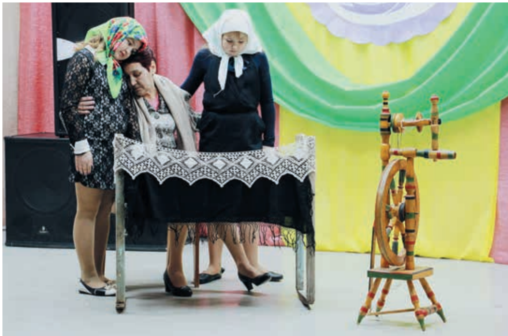
Одним из самых проникновенных моментов представления стал номер, посвященный тяжелой материнской доле во времена военного лихолетья