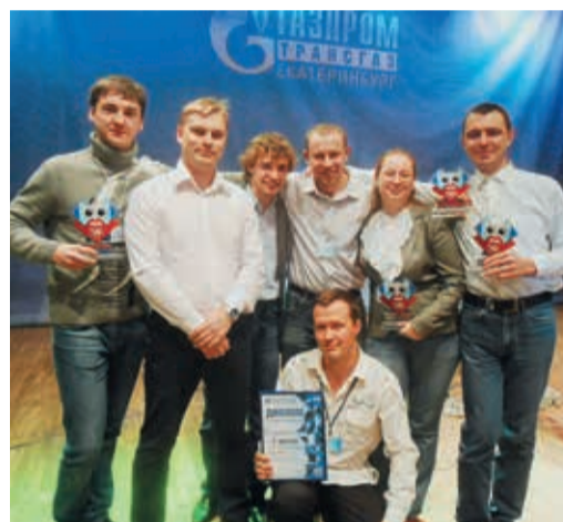
Чемпионы из Челябинска