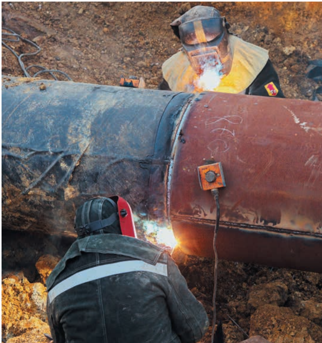
Эта муфта для бригады Сысертского участка УАВР-3 стала десятой на Каменском отводе

Вся вода вычерпана, с краю длинной траншеи сделан приемок для стока новых порций, а для удобства сварщиков и мон-