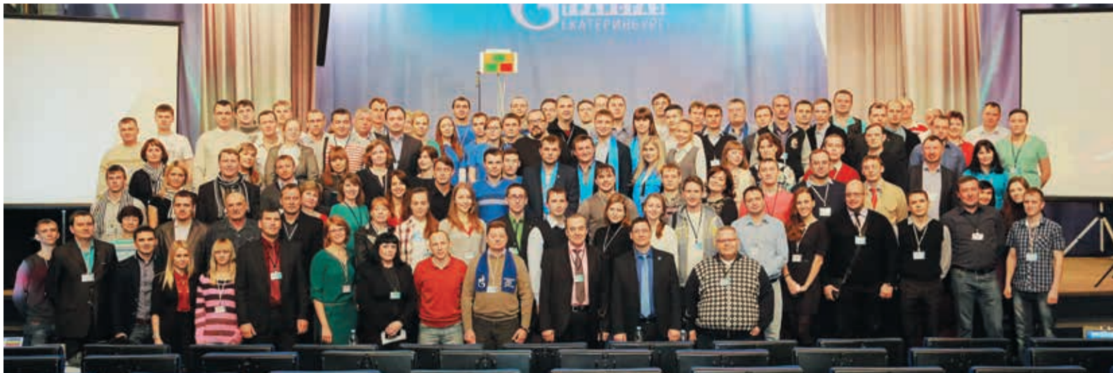
Большая сборная участников IV турнира ГТЕ по брейн-рингу

В зале КСК «Олимп» собрались 22 команды интеллектуалов со всей трассы. Приняли участие в играх и три дебютанта — сборные УООП, УАВР-3 и студентов-целевиков, а в ранге гостей выступила шестерка екатеринбургского филиала «Газпром-информ». В этом году на смену «схеме второго шанса», когда команды выбывали из игры после второго поражения, пришла «футбольная», близкая к той, по которой играют на Кубке УЕФА. Во время жеребьевки все сборные были разделены на шесть подгрупп, в которых и прошли отборочные игры. Из каждой