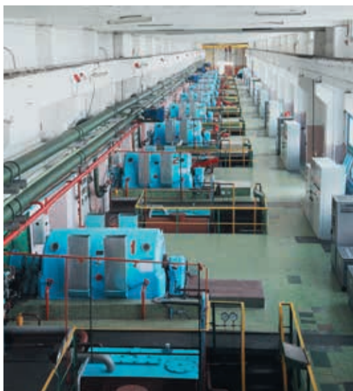
Машинный зал КС-15 Домбаровского ЛПУ

Для «пятнадцатой» этот ремонт равносителен небольшой технической революции. До недавних пор практически вся запорная арматура на технологиче-