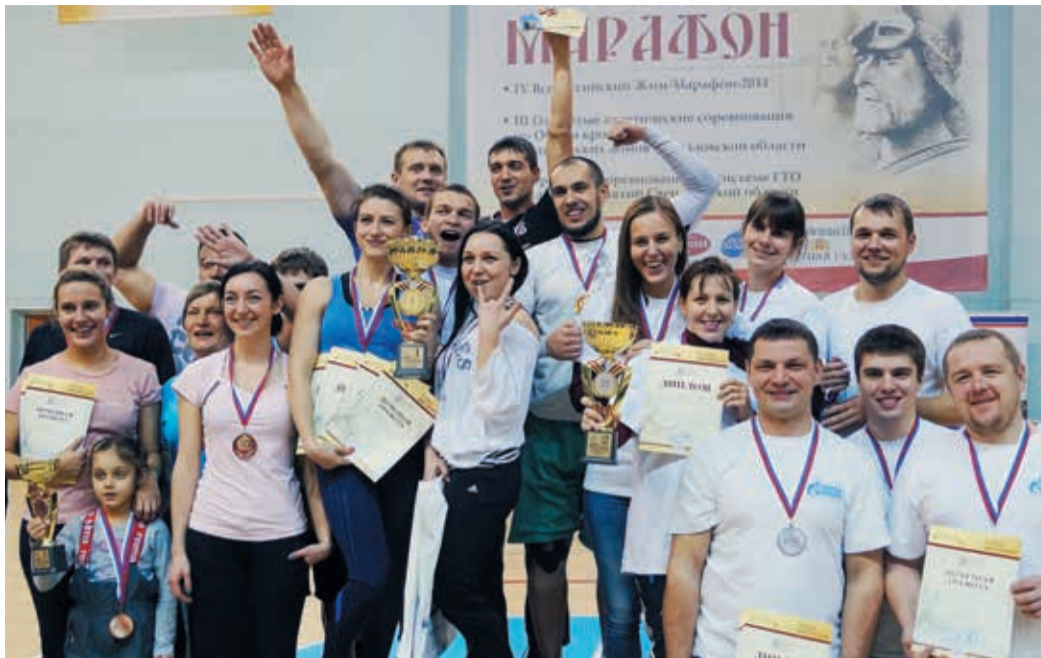
На соревнованиях Свердловской области наше предприятие представляла команда «Уралавтогаза»

В конце марта Президент Владимир Путин подписал указ о возрождении в Российской Федерации комплекса ГТО («Готов к труду и обороне»), направленного на укрепление здоровья нации и возрождение в стране массового физкультурного движения. И вот первая ласточка некогда весьма популярного в Советском Союзе комплекса появилась и на нашем предприятии. Президентскую инициативу подхватил Совет молодых специалистов управления «Уралавтогаз». Активисты бросили клич среди коллег «Дашь сдачу норм ГТО!» и в ноябре устроили спортивный праздник для сотрудников филиала.