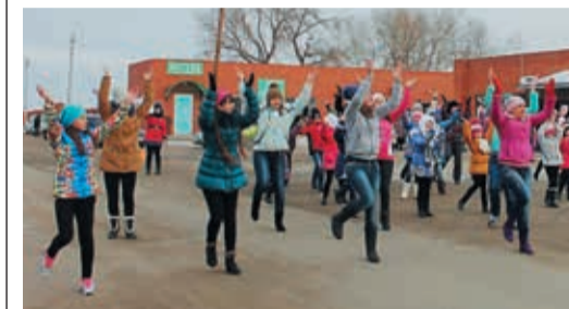
Флешмоб против курения состоялся в Красноярском впервые

Ежегодно в третий четверг ноября отмечается Международный день отказа от курения; в этом году он выпал на 20 ноября. Вступить в благородную борьбу с вредной привычкой решили и жители поселка Красноярский, где располагается ГКС-16. В КСК «Триумф» был разработан целый стратегический план. Ребята из изостудии оформили выставку рисунков «Дети против табакокурения», которую разместили у входа на станцию. Свой вклад в передвижную выставку внесли даже малыши из детского сада «Василек»: они подготовили коллективный плакат, где на контуре ладошки каждого ребенка стоял призыв к отказу от курения.