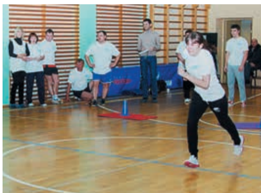
Автогазовцы проходили отбор во время первенства филиала