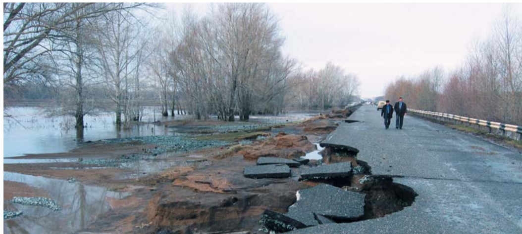
Паводок — штука коварная, и характер у него взрывной