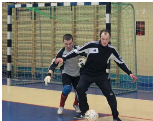
В этом году футбольный сезон вышел укороченным

Неожиданно провальным оказалось выступление НЛПУ. Ведь существенно обновленная команда «северян» здорово зажгла в зональном турнире, вернувшись в когорту сильнейших после годичного перерыва. Однако этим все и ограничилось — здесь невянцы потерпели три поражения и заняли последнее место в своей подгруппе. Особенно обидным вышел проигрыш команде УАВР-3 — 3:8. А первоуральцы, победившие еще и красногорцев, расположились на втором месте в таблице. Первенство же в группе ожидаемо осталось за «Автогазом».