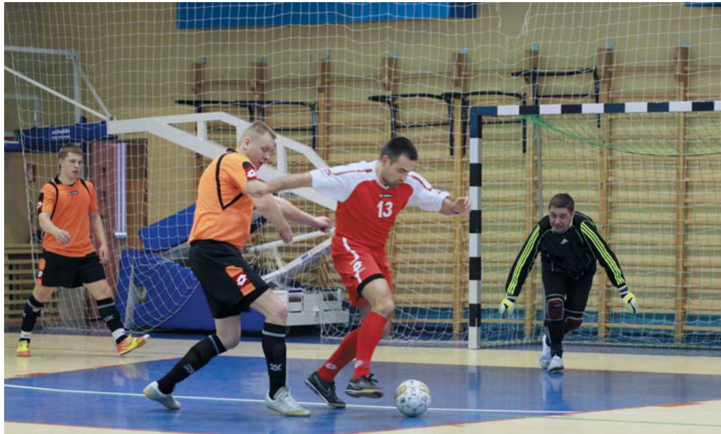
Самым зрелищным матчем турнира стало полуфинальное противостояние сборных Челябинского ЛПУ и УАВР-3

На первом этапе «Финала восьми» команды были разбиты на две группы. Подгруппу «А» образовали «Уралавтогаз», Красногорка, Невьянск и УАВР-3. Подгруппу «Б»