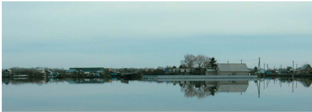
Ожидается, что в Оренбуржье весенний паводок превысит значения прошлого года