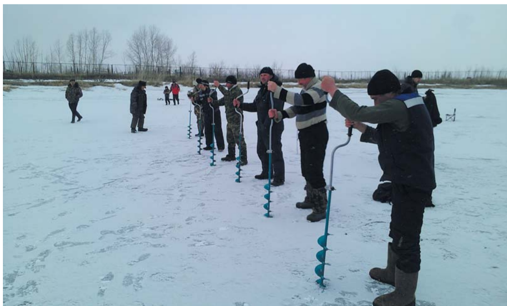
Выстоял под теплыми лучами солнца только «карповник», где и прошел День рыбака

Это небольшое озерцо домбаровцы вырыли три года назад, чтобы разводить в нем рыбу благородных, что называется, кровей. Понятно, что щуки и окуни в избытке водятся в реках, но людям и карпов на своем столе хочется видеть. О хозяйстве своем газовики заботятся по всем правилам: подкармливают рыб специальными смесями, а зимой делают в толще льда