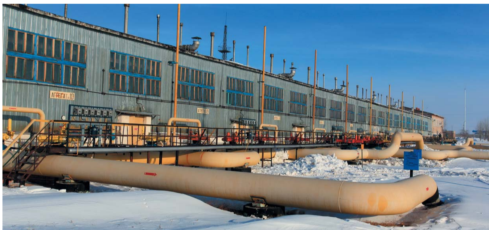
На КС-16 удивительным образом переплелись пять десятилетий

Поселок Бреды. Восточный участок границы между Челябинской и Оренбургской областями. Вокруг раскинулась степь с редкими лесными островками, и где-то совсем недалеко по степи проходит государственная граница с Казахстаном, о чем напоминает погранзастава в Бредах. Дорога, соединяющая две области, тянется вдоль железнодорожной ветки, где после Бредов следующая относительно крупная станция — Айдырля. По ошибке название станции часто путают с названием близлежащего поселка Красноярского, и даже компрессорную станцию на газопроводе «Бухара — Урал» нередко именуют «Айдырлинской», хотя по документам она сегодня больше известна как КС-16 Домбаровского ЛПУ. Рассказом о ней «Трасса» продолжает цикл материалов, посвященных 50-летию легендарного газопровода.