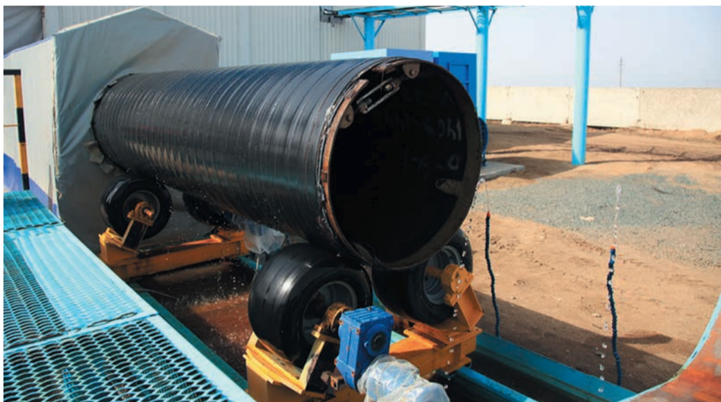
Монолитное трехслойное покрытие должно обеспечить надежную защиту от коррозии