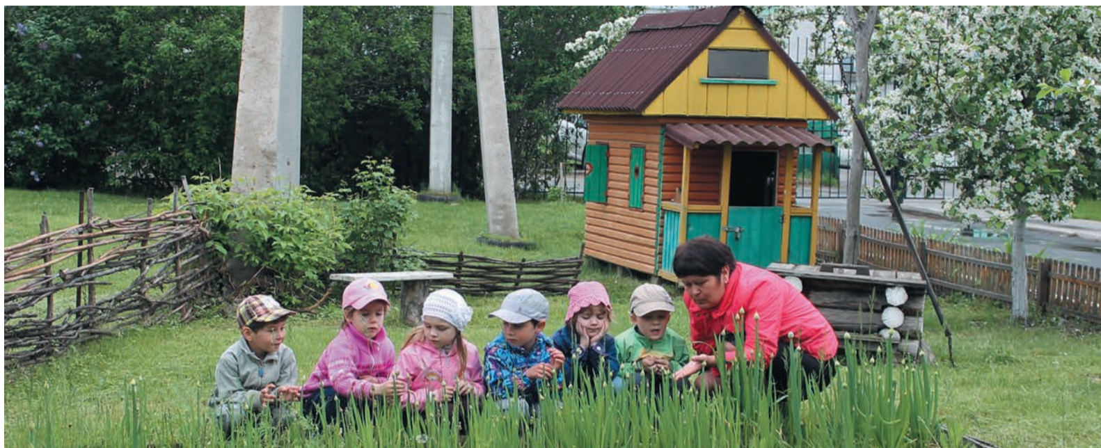
Челябинские детсадовцы постигают азы бережного отношения к природе на собственном мини-огороде (фото сверху), а екатеринбургские – в живом уголке детского экологического центра (фото снизу)

На мой взгляд, первая ступень системы экологического менеджмента начинается с детского сада. Привычка жить в гармонии с окружающим миром формируется в раннем возрасте, а помогают этому семья и педагоги. Во всех детских садах ГТЭ вопросу экологического воспитания уделяется большое внимание. Вот только три маленьких истории.