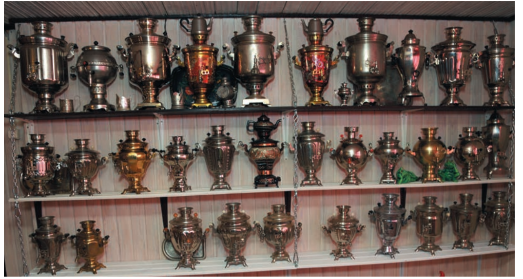
У каждого самовара в коллекции — своя история

Многие экземпляры его коллекции были созданы в связи со знаковыми для страны моментами. Один, в форме ракеты, появился вскоре после полета Юрия Гагарина в космос. Другой — «кубок» — выпустили в честь Олимпиады 1980 года. Есть у трансгазовца реликт со встроенной емкостью для заварки, названный «советским недоразумением» — неудобный в обращении, он был быстро снят с производства. Есть тульский серебристый