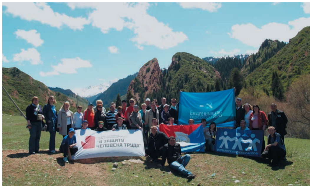
Участники международного агитпробега посетили киргизский национальный парк Джеты-Огуз

Для гостей устроили этнографический вечер, где познакомили со старинными киргизскими обрядами, удивили красотами национального парка в ущелье Джеты-Огуз. Экскурсию должен был завершить подъем по канатной дороге на гору Каракол, которая зимой является горнолыжным курортом, а летом — прекрасной смотровой площадкой. Но здесь дружную команду поджидал сюрприз: из-за технической неисправности подъемник остановился и заставил гостей подвиснуть в люльках на три часа. Несколько особо нетерпеливых участников «восхождения» через полчаса решили самостоятельно спуститься на землю, благо до нее было около пяти метров, помогли они и своим товарищам. Спасателем-до-