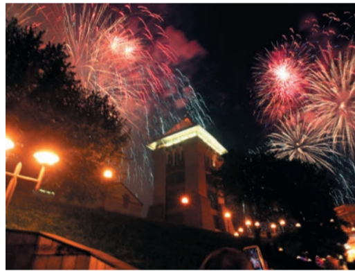
Яркая глава, вписанная в историю V юбилейного корпоративного фестиваля «Факел» творческой командой ООО «ГТЕ», украсила летопись фестивального движения Газпрома