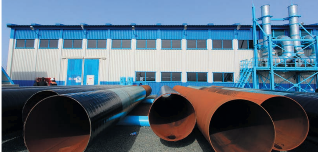
Испытательные пуски состоялись: БРИТ готова к приему трубы с легендарного газопровода «Бухара — Урал»

Сегодня бело-синие стены и коньковая крыша нового цеха, где размещается основное оборудование БРИТ, издали видны