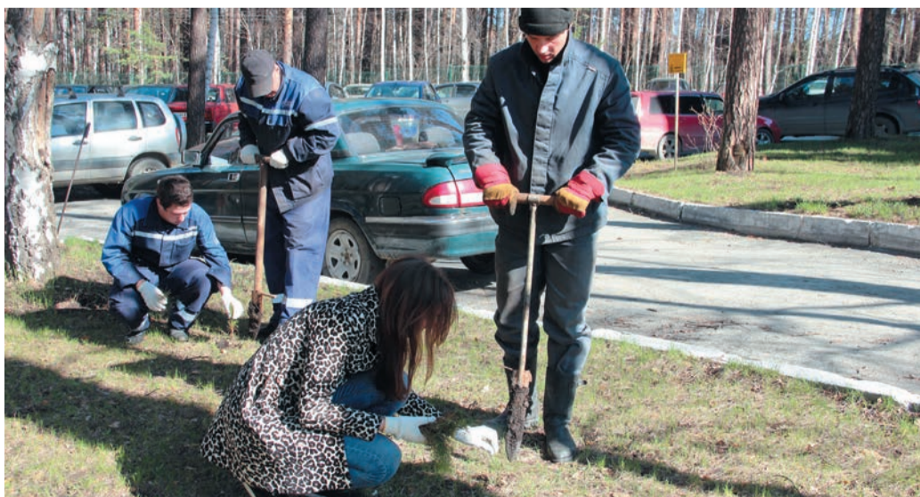
К 100-летию ГТЕ маленькие саженцы превратятся в большие сосны

Заметим, что это далеко не первая экологическая акция. В предыдущие годы