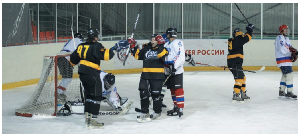
Команда Управления «Уралавтогаз» (в темной форме) продемонстрировала поистине чемпионский характер, так и оставшись непообежденной

В первом туре опытные спортсмены не испытали особых проблем с менее искусственными оппонентами. Так, Малый Исток обыграл невянецев 5:2, а хоккеисты УАВР-3 оставили свои ворота «сухими» в поединке с далматовцами — 5:0. А вот встреча Малого Истока и Шадринска прошла уже на другом градусе. «Свердловчане» открыли счет, а затем большую часть времени отбивали атаки раздосадованных зауральцев, «бронзовых» призеров прошлогоднего чемпионата ГТЕ. И за три минуты до финальной сирены шадринская осада принесла плоды — 1:1. Казалось, больше голов зрители не увидят: слишком много сил оставили на льду соперники. Однако у шадринцев последовало удаление, и МИЛПУ сумело на последних секундах реализовать лишнего — 2:1.