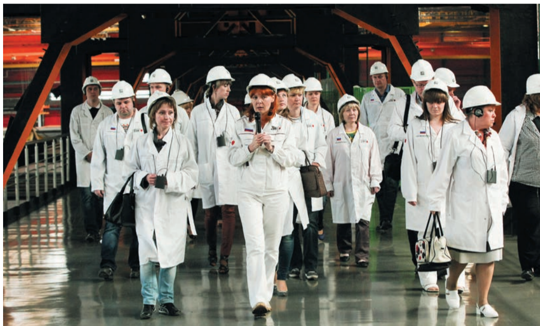
Делегация экологов поднялась на «Высоту 239»

Трансгаза и приглашенными специалистами из компании «Фрэком» обсудили особенности проведения внутреннего