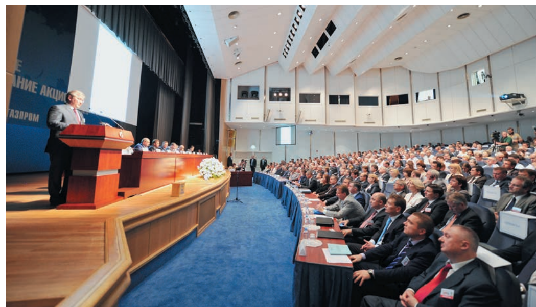
Газпром продолжит свое поступательное движение к намеченным целям

В осенне-зимний период 2012/2013 годов добыча газа Группой «Газпром» достигла уровня 1 млрд 658 млн куб. м в сутки, что на 50 млн куб. м больше, чем в предыдущий осенне-зимний период. Это рекордный показатель суточной производительности в мировой газодобывающей отрасли.