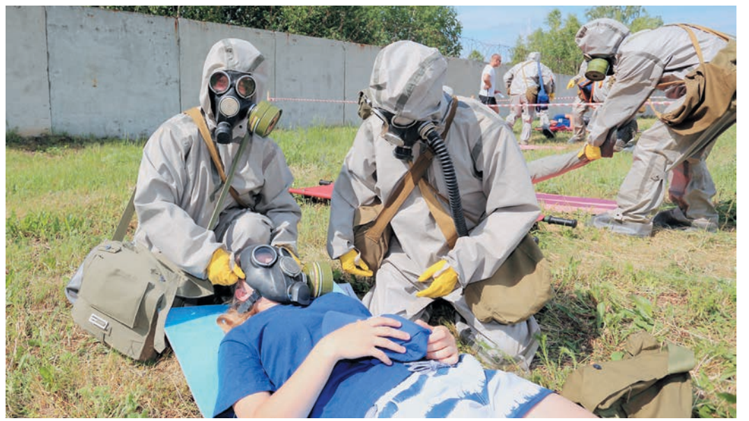
Не так-то просто надеть противогаз, если пострадавший постоянно вертится и хихикает