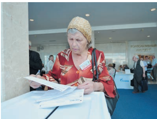
Как подчеркнул Алексей Миллер, компания стремится в полной мере использовать весь свой потенциал в интересах акционеров, при этом учитывая интересы миллионов граждан России

По итогам шести месяцев текущего года наш экспорт в Европу вырос на 10%, а в отдельные дни июня превышал уровень прошлого года в полтора раза. В то же время поставки других экспортеров в первом квартале существенно сократились: Алжира — на 10%, Ливии — на 12,9%, Катара — на 42,3%. При этом показатель, что дополнительный спрос, образующийся в Европе в результате недопоставок сжиженного природного газа (СПГ), удовлетворяется за счет наших долгосрочных контрактов с нефтяной индексацией.