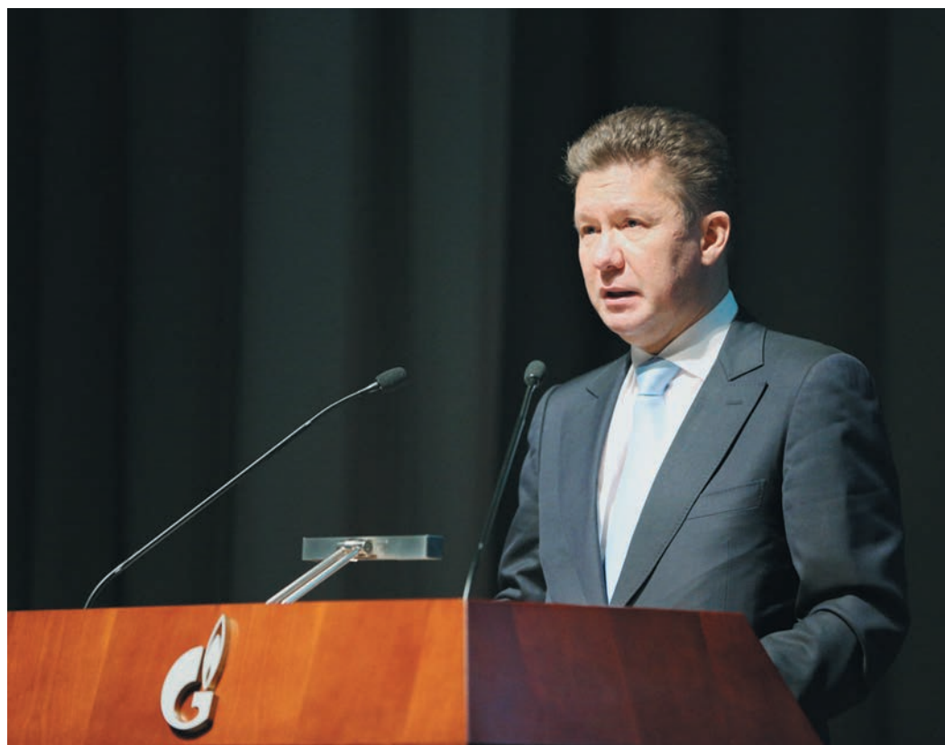
На Общем собрании акционеров Председатель Правления ОАО «Газпром» Алексей Миллер подвел итоги прошедшего года и обозначил стратегию дальнейшего развития компании

ет возможность быстро реагировать на изменения уровня спроса и гарантированно поставлять газ потребителям в России и за рубежом.