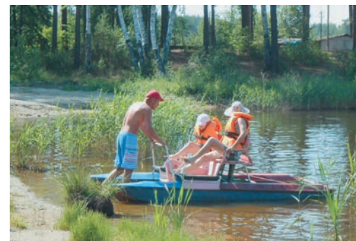
Катамаран на Глухом пользуется большой популярностью

Сорок человек с радостью заняли свои места в автобусе и отправились во всеми любимое место. Жаркий денек располагал к пляжному отдыху, поэтому решили все время отдать лучшим друзьям здоровья — солнцу, воздуху и воде, исключив из программы предложенные культурно-организатором санатория игры в бильярд, теннис и караоке. В программу «курортного вторника» поставили воздушные ванны, катание на катамаранах, купание и даже экспресс-рыбалку.