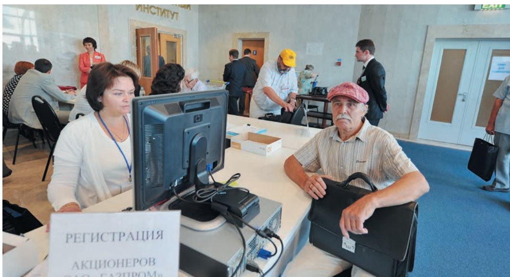
В осенне-зимний период 2012/2013 годов Газпром достиг рекордного показателя суточной производительности в мировой газодобывающей отрасли

Европе нужен природный газ в предсказуемых объемах и по предсказуемым ценам. И это повышает привлекательность российского газа. В Италию, например, в прошедшие месяцы текущего года мы поставили газа в 3 раза больше, чем в аналогичный период 2012 года.