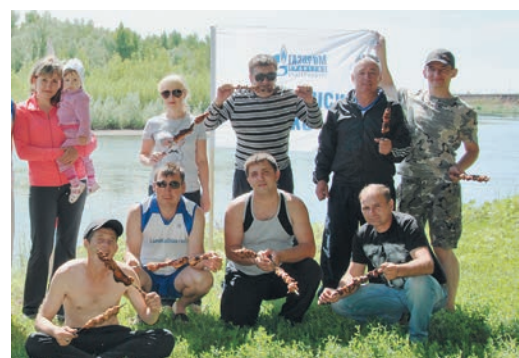
Привал устроили на берегу Сакмары

Чтобы добраться до места, где прошло детство известного государственного деятеля и экс-председателя правления концерна