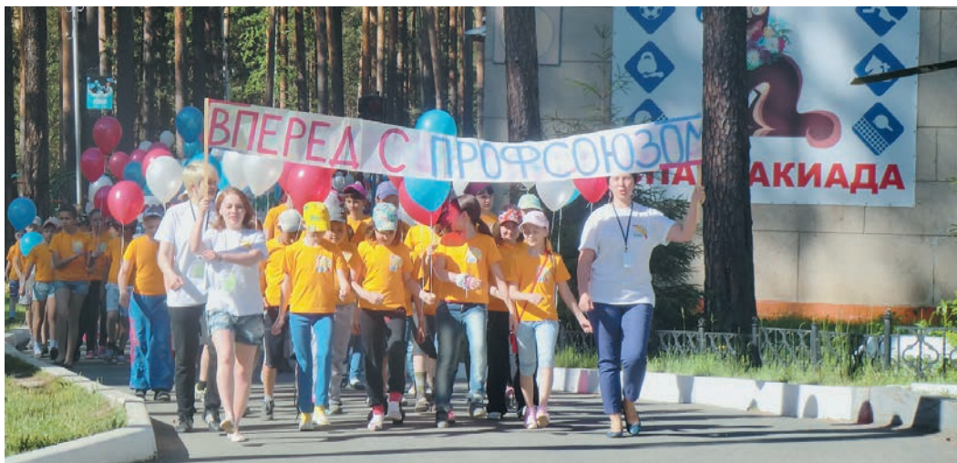
Будущее профсоюза находится в надежных руках

Традиционно ОПО ООО «Газпром трансгаз Екатеринбург» совместно с администрацией оздоровительного лагеря «Прометей» проводят для детей игру, знакомящую ребят с деятельностью профсоюзной организации. В нынешнем сезоне акция «Мы — будущее профсоюза!» состоялась в середине июня.