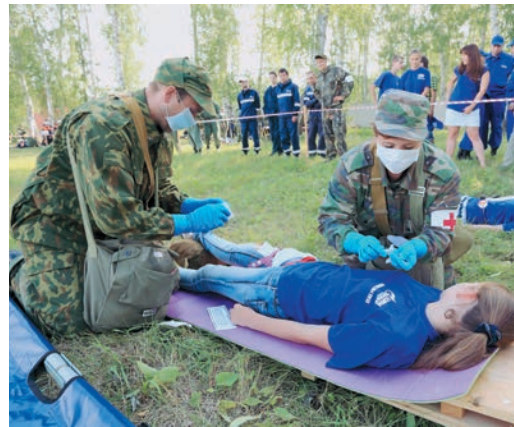
Санпост Челябинского ЛПУ в очаге массовых санитарных потерь

— Шина воротниковая, дозиметр, нож, шприцы одноразовые, сульфадиметоксин, косынка перевязочная, булавки, блокнот, — первым, как и полагается, заработал этап №1, где выполняется проверка снаряжения. Судьи дотошно изучают содержимое санитарных сумок, подсчитывают количество респираторов. Этап несложный, всего-то и нужно было — обстоятельно собраться в дорогу, но уже пошли первые штрафные баллы: