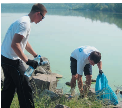
Через три часа работы забили под завязку четырнадцать мешков, которые затем отправились в контейнеры для мусора.