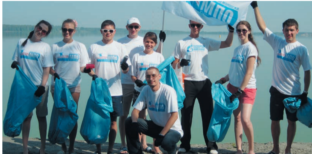
Молодые специалисты решили повторить экологический поход в следующем месяце. Вместе с ними по маршруту планируют отправиться и корреспонденты газеты «Трасса».