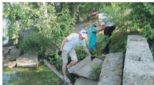
Пустые стеклянные и пластиковые бутылки, ржавые пружины и металлические банки находили под каждым камнем. Старались ничего не пропустить — известно, что тот же пластик разлагается в земле почти сотню лет, выделяя при этом токсичные вещества и нанося существенный ущерб природе.