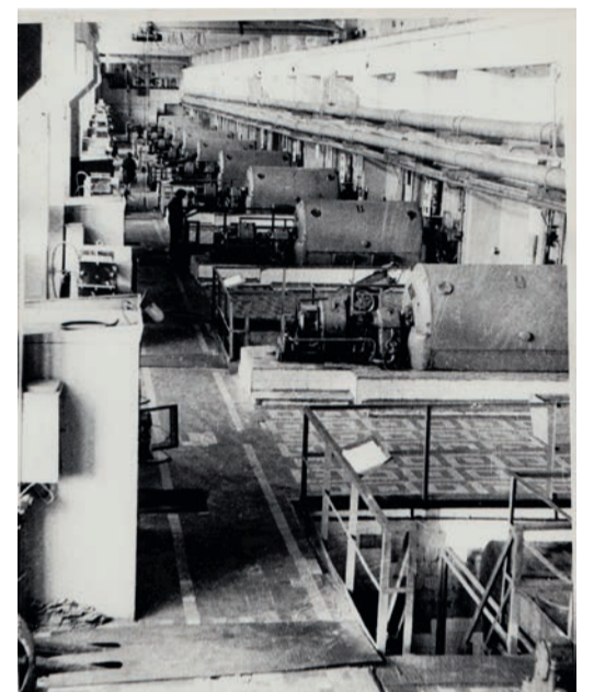
Солидный возраст — не помеха: ГПА всегда готовы к работе

поселок. Островок жизни, возникший только благодаря строительству компрессорной станции. И молодежь здесь, как и 50 лет назад, по-прежнему активная. Да и как ей быть другой, если даже сегодняшние пенсионеры, собираясь в клубе «Сударушка», не сплетничают за чашкой чая, а занимаются на тренажерах, изучают японскую оригами или