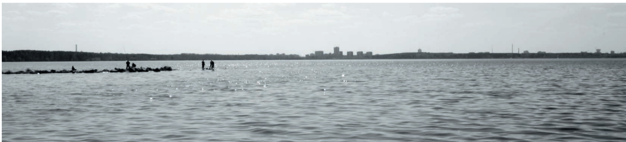
Сохраним большую и малую родину: акватория озера Шарташ.