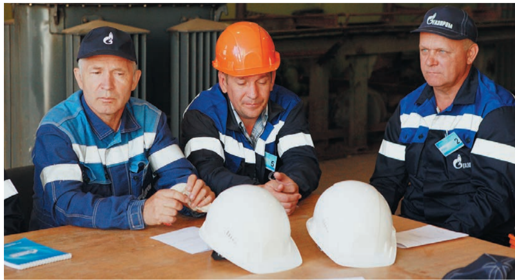
Перед началом практического задания все участники конкурса прошли инструктаж по технике безопасности

Много столетий котел, в котором на огне готовилась пища, служил не только посудой, но и источником тепла. Именно поэтому в начале XVIII века владельцы металлургических предприятий стали уделять особое внимание изготовлению металлических деталей для очагов и печей, а затем занялись производством и собственно отопительных котлов. Первые котлы работали на дровах и угле. Но в XX веке широкое распространение получило уже жидкотопливное и газовое оборудование, позволяющее автоматически регулировать подачу теплоносителя. Наибольшей популярностью газовые котлы пользуются в России, ведь благодаря своей экономичности газ в нашей стране является самым предпочтительным видом топлива. К тому же сегодня во всех котлах применяется встроенная автоматика для обеспечения безопасности при отключении газа, пропадании тяги, падении уровня воды в системе ниже нормы и т.д.