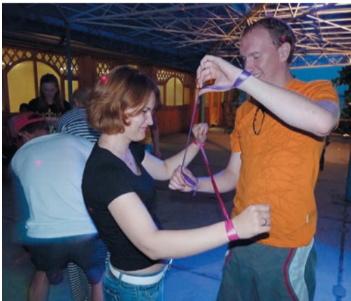
Корпоративная дружба — великое дело

В Красногорском ЛПУ существует традиция отмечать День молодежи на базе отдыха «Факел». Приезжают сюда семьями. Жарят шашлыки, устраивают спортивные состязания и обсуждают... рабочие вопросы. Говорят, что лучшие идеи часто приходят в неформальной обстановке — когда видишь, например, как дети строят песочные замки, а солнце золотит верушки сосен.