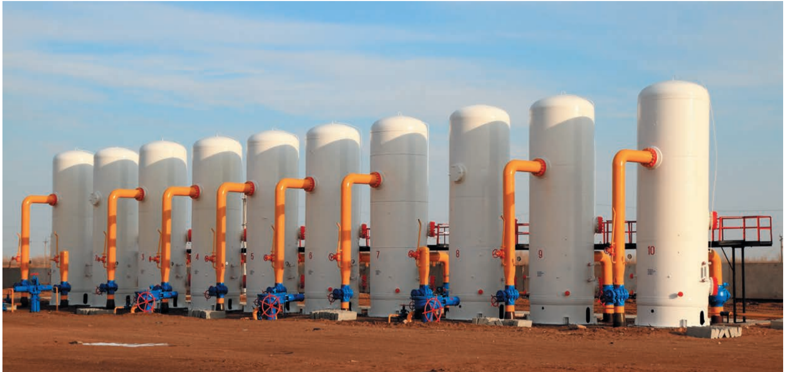
После того как серые колонны пылеуловителей покрыли белой краской, к ним прочно привязалось прозвище «зубы»

Агрегаты остались прежними, но производственный мир вокруг них изменил-