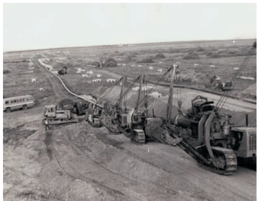
За полувековую историю Управления были построены и отремонтированы сотни километров трубы

Незаметно, но быстро меняются постройки: гаражи, мастерские, котельная. Новые коньковые крыши, новая обшивка стен, смело смотрят на мир аккуратные пластиковые окна. Примечательно, что значительная часть работ выполняется силами собственной группы текущего ремонта. Сегодня уже не верится, что большая часть всех зданий — родом из 60-70-х годов прошлого века.