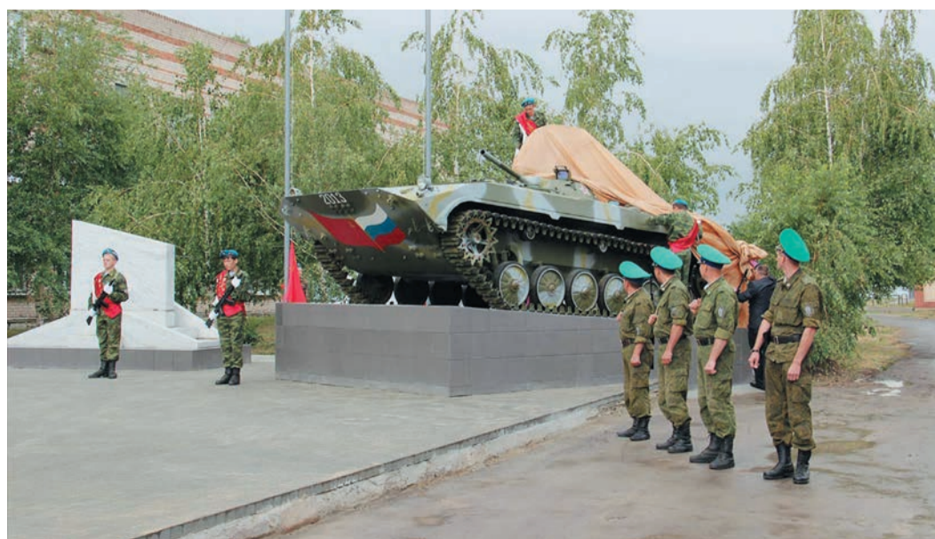
Доставить и отреставрировать БМП помогли сотрудники Карталинского ЛПУ

Слова благодарности отцам и матерям погибших высказали также пред-