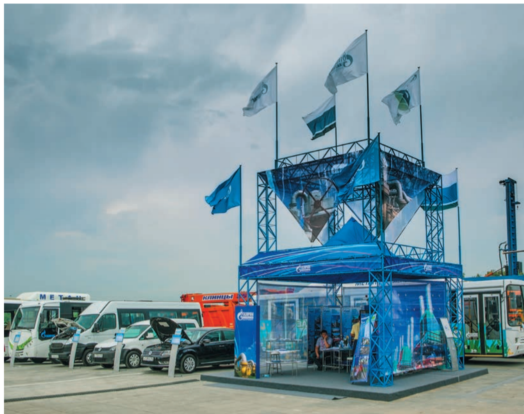
Четвертый год подряд ООО «Газпром трансгаз Екатеринбург» становится участником «Иннопрома», демонстрируя посетителям промышленного форума свою газомоторную технику

ООО «Газпром трансгаз Екатеринбург» традиционно становится активным участником форума, четвертый год подряд демонстрируя посетителям свою газомоторную технику. Нынче на выставочном стенде был представлен новый коммунальный, а также пассажирский транспорт, работающий на метане. Посетители «Иннопрома» могли познакомиться с автобусами «ЛиАЗ», «Нефаз» и Ivesco, мусоровозом на шасси «КамАЗа» и передвижным автомобильным газовым заправщиком (ПАГЗ).