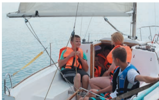
Ребята предпочитают выходить на воду, когда есть волна, чтобы получить побольше адреналина