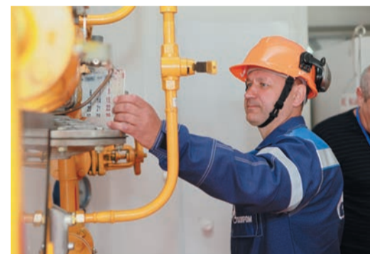
Конкурсанты рассказывали комиссии порядок действий в нештатной ситуации