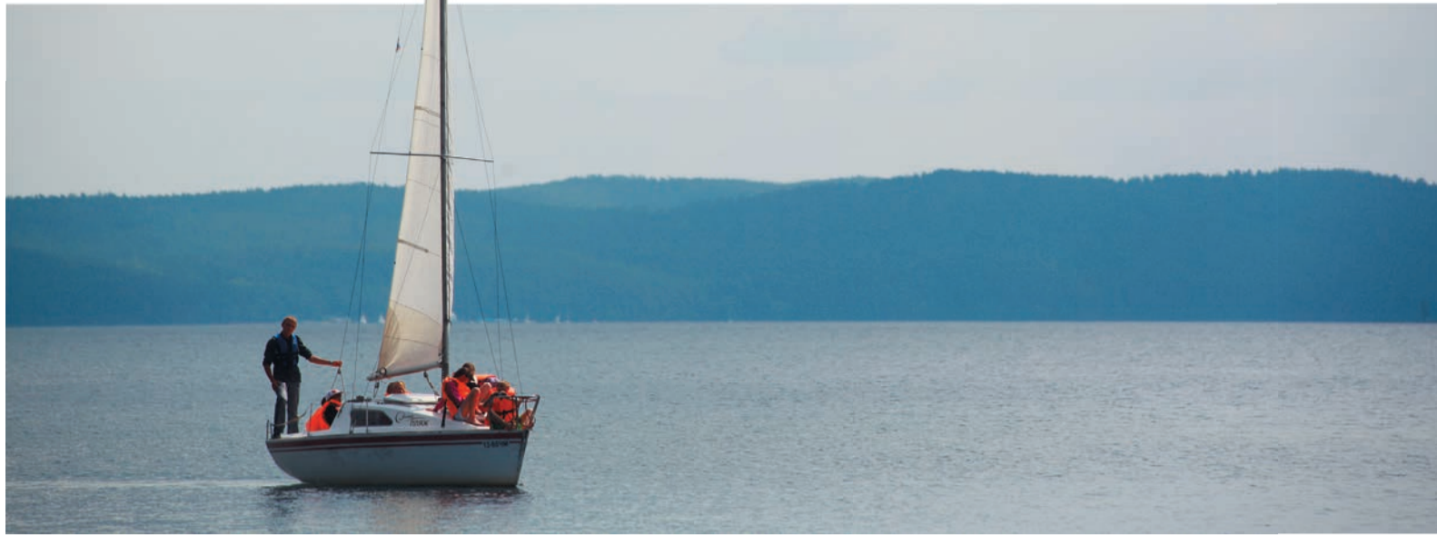
После курса теоретических занятий начинается практика

Дети сотрудников Трансгаза провели две незабываемые недели в Школе путешественников им. Конюхова на озере Тургояк. Шестьдесят человек, прибывших из Свердловской, Челябинской и Курганской областей, постигали основы яхтенного спорта, получив официальное право называться юнгами. А еще как следует подружился — те, кто вместе ходил под парусами, не понаслышке знают, что такое чувство локтя.