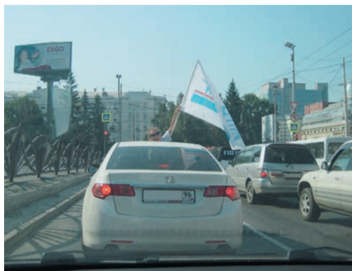
Под стягами профсоюзной организации экологический десант проехал по уральской столице, чтобы уже через какие-то полчаса приступить к работе.

Напомним, что 2013-й объявлен в Газпроме Годом экологии. В связи с этим молодые специалисты из нескольких подразделений ГТЕ при поддержке объединенной профсоюзной организации Общества провели акцию, направленную на защиту природной среды. В начале июля представители Администрации, Управления «Энергогазремонт», Управления организации капитального ремонта, реконструкции и строительства основных фондов (УОРРисОФ, в прошлом — ДСОГУР), ИТЦ, УТТиСТ и Шадринского ЛПУ отправились на озеро Шарташ, расположенное в черте Екатеринбурга, чтобы очистить береговую зону от мусора.