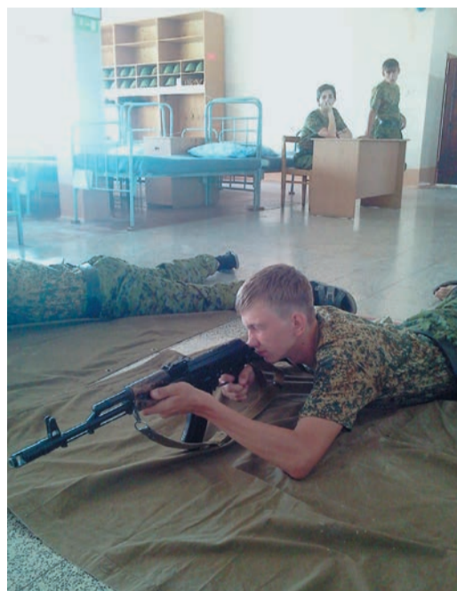
Юных «армейцев» научили полезным делам — управлять БТР, например, и обращаться с оружием

Руководство Уральского военного округа идею охотно поддержало и «воспитательный полигон» выделило самый подходящий — в селе Елань, где ребята могли научиться реальным делам. Скажем, управлять БТР. За руль их, конечно, никто не пустит. Но в воинской части есть несколько тренажеров, полностью воспроизводящих водительское место боевой машины, — с приборной доской и экраном, на котором появляется виртуальная местность с препятствиями. Специальная компьютерная программа учитывает все неверные действия водителя, а затем ошибки разбираются с инструктором. Также много времени уделяется физической подготовке, обращению