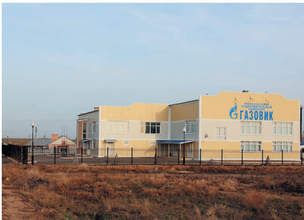
Еженедельно новый ФОК в Голубом Факеле посещает около 400 человек

ся. За два-три года на КС-15 и КС-16 была полностью заменена САУ ГПА. Схемы САУ «Электра» образца 80-х годов сменила цифровая система «Элна». Со станин электродвигателей исчезли прежние машинные возбудители, их сменили тиристорные устройства. В результате вырос КПД агрегатов, заметно повысилась надежность их работы. Кроме того, обнов-