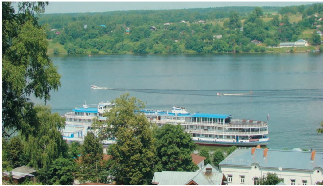
Ребята путешествовали на теплоходе «Родная Русь» — современном трехпалубном судне, комфортном и безопасном