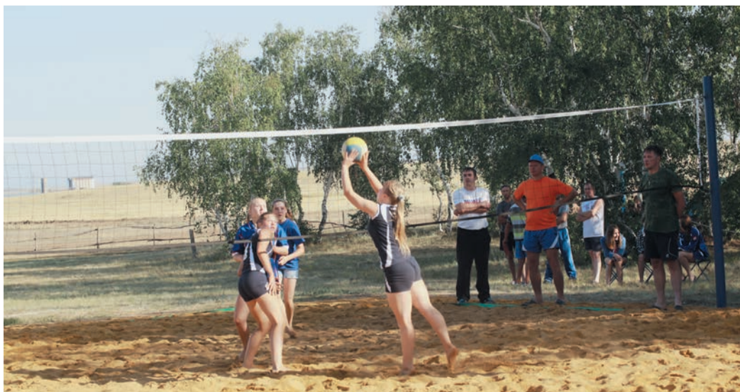
VI турслет детей работников Трансгаза, безусловно, стал одним из главных событий этого лета в Обществе