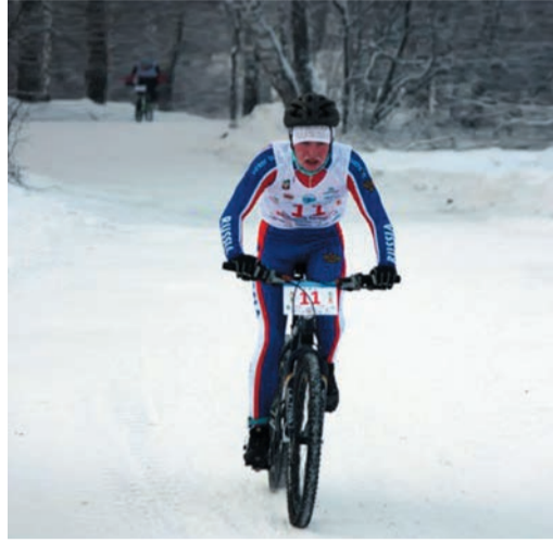
Поначалу зимний велосипед давался ему непросто