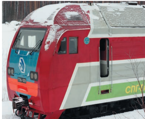
В зоне особого внимания Управления «Уралавтогаз» развитие автопарка на метане, организация строительства и эксплуатация АГНКС, обеспечение потребителей сжиженным и компримированным природным газом