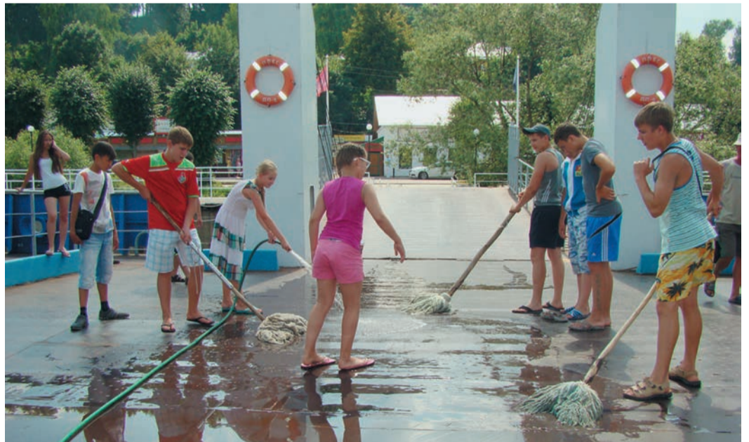
С удовольствием помогли жителям волжских городков, а также команде теплохода

95 детей сотрудников Трансгаза совершили двухнедельный круиз на теплоходе «Родная Русь», побывав во многих волжских городках. Поездка в этом году носила познавательный характер — организаторы хотели, чтобы ребята прониклись духом родной истории.