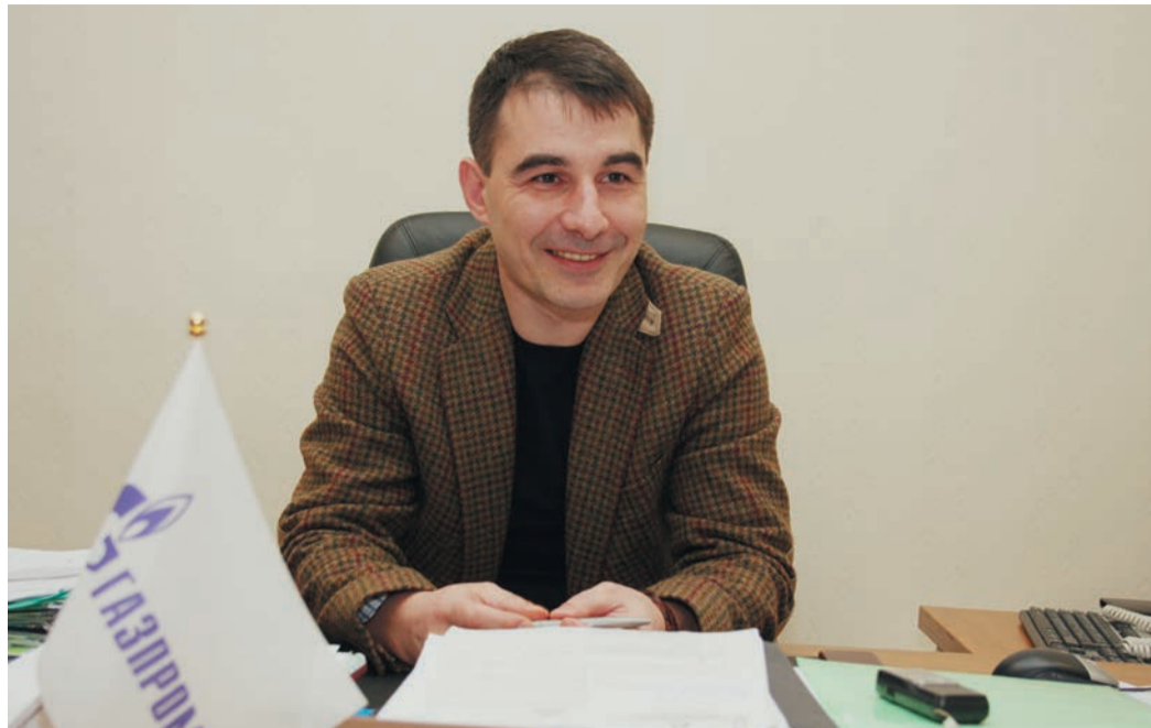
В новую 10-летку Управление «Уралавтогаз» входит с ощущением грядущего прорыва в сфере газомоторного топлива

Параллельно стояла задача привести в надлежащее техническое состояние те объекты, что мы приняли от ЛПУ. На всех станциях решили проблему, связанную с подготовкой и осушкой газа. Не секрет, что на некоторых АГНКС