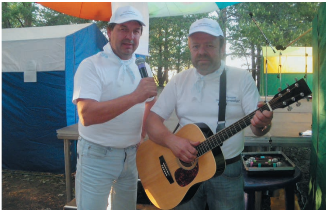
Михаил (справа) и Юрий признались, что на сцене волнуются, как в юности

— Песня, как ни крути, нам строить и жить помогает, — весело добавляет Юрий.