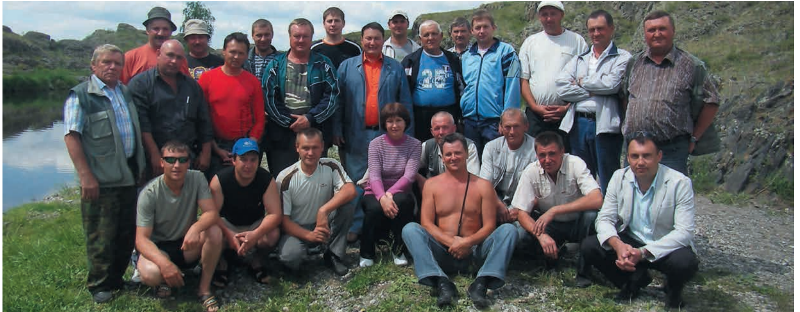
Все ГРСовцы знают: 11 июня, берег Увельки, шурпа от начальника службы

В этом году служба получила новую машину, теперь хватает места и для передвижной мастерской, и для комфортной перевозки людей. На многих ГРС красногорцы оборудовали мини-общежития, чтобы было где «летучим мастерам» переночевать. Работы сейчас у них много, ведь 2013 год стал первым этапом по