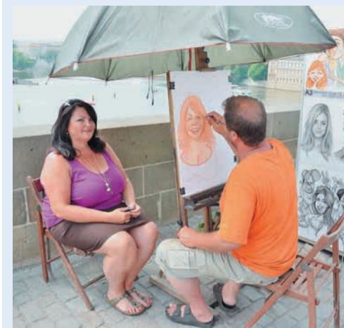
3 место в номинации «Портрет», автор Владимир Липатников (Шадринское ЛПУ)