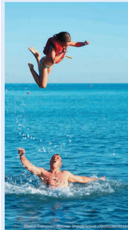
2 место в номинации «Досуг и отдых», автор Ирина Ткаченко (Управление «Уралавтогаз»)