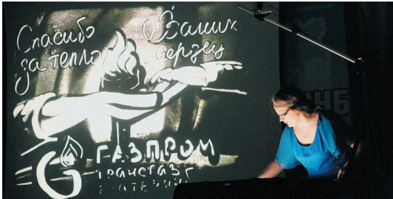
Песочное шоу — творческий подарок делегатам и гостям III слета, который прошел под «звездой творчества»

В середине сентября состоялся III слет неработающих пенсионеров ООО «Газпром трансгаз Екатеринбург». На три дня база отдыха «Прометей» превратилась в кипучий центр жизни вышедших на заслуженный отдых газовиков.