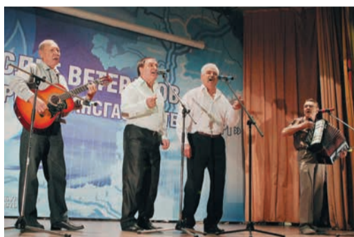
«Уральские самоцветы» блеснули своими талантами

И главной темой нынешнего слета стало возрождение культурно-массовой работы среди старшего поколения. Делегаты много пели и танцевали, организаторы устроили для них своеобразный фестиваль ретро-фильмов. Традиционное совещание председателей советов ветеранов филиалов было посвящено всестороннему развитию творчества пенсионеров, а главным событием форума стал первый творческий конкурс людей «золотого» возраста.