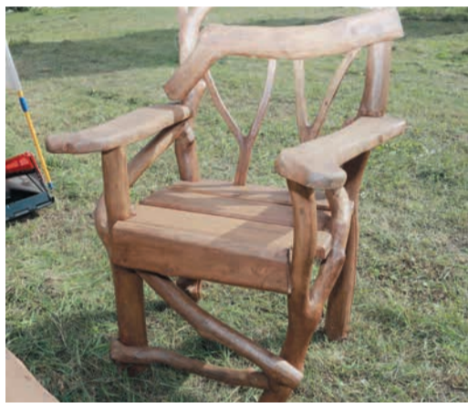
То, что для обычного человека является банальными дровами, в руках мастера превращается в изящные деревянные конструкции

Украсил окна на своей даче, потом стал делать на заказ. А в конце 1990-х, когда на-