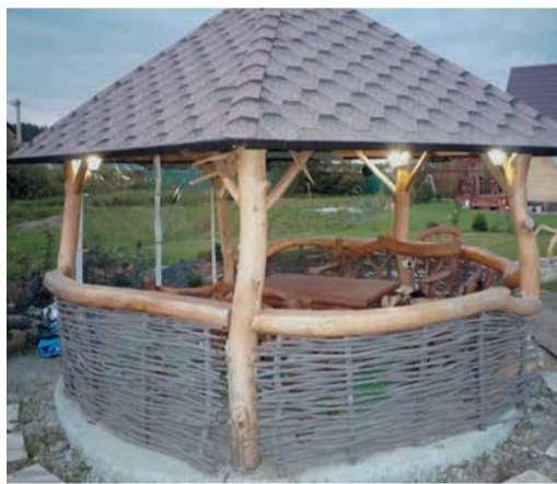
То, что для обычного человека является банальными дровами, в руках мастера превращается в изящные деревянные конструкции