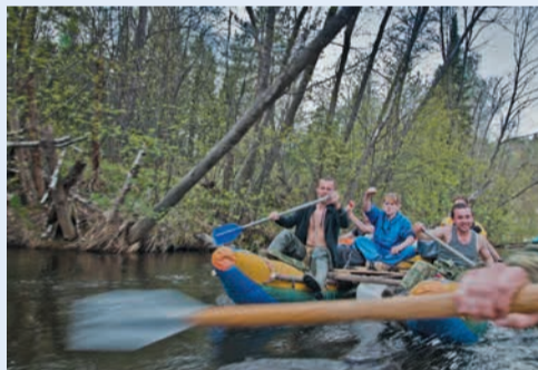
1 место в номинации «Досуг и отдых», автор Сергей Максимов (Управление связи)