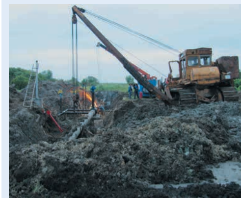
Спецприз в номинации «Производство», автор Владимир Липатников (Шадринское ЛПУ)