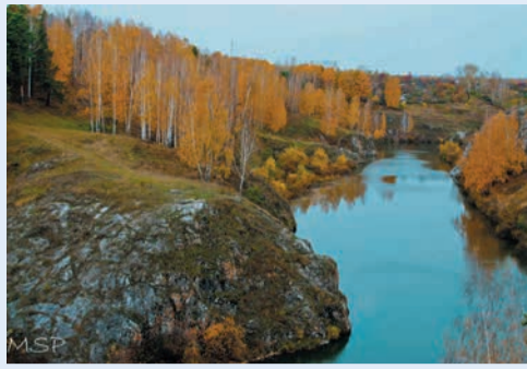
3 место в номинации «Пейзаж»