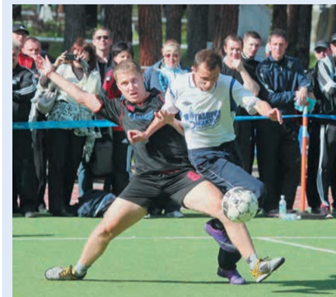
Спецприз в номинации «Досуг и отдых», автор Александр Ткаченко (СКЗ)