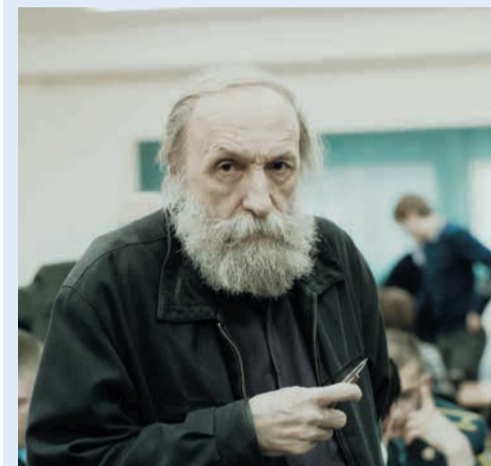
2 место в номинации «Портрет», автор Сергей Максимов (Управление связи)