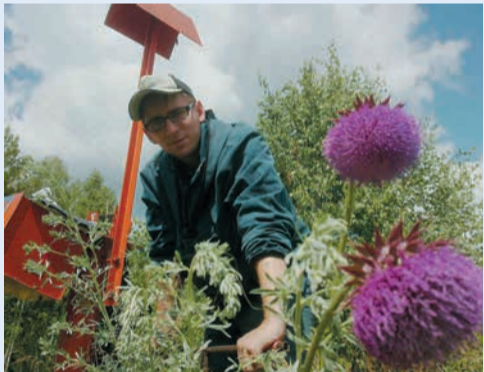
3 место в номинации «Производство», автор Любовь Борцева (ИТЦ)