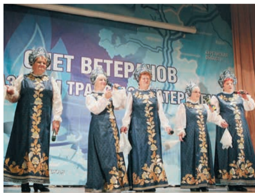
«Сударушка» из Домбаровки украсила концерт