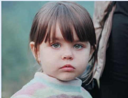
Спецприз в номинации «Портрет», автор Марина Лопатина (УПЦ)