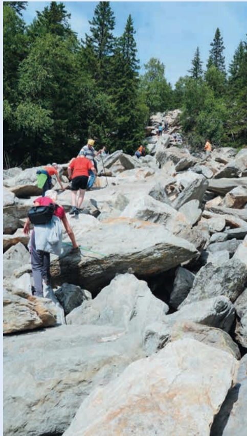
3 место в номинации «Досуг и отдых», автор Владимир Липатников (Шадринское ЛПУ)