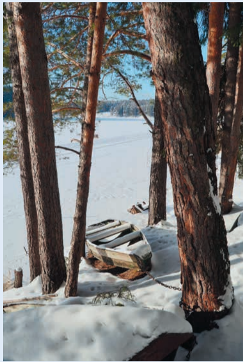
Спецприз в номинации «Пейзаж», автор Любовь Борцева (ИТЦ)