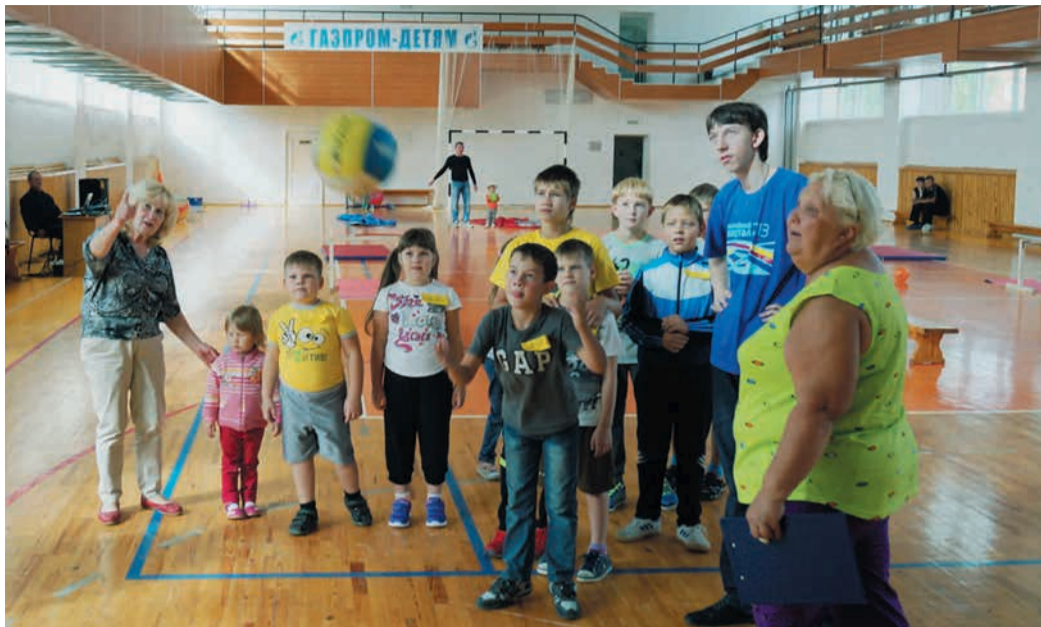
Ребятам устроили экскурсию по ФОКу и дали возможность испытать свои силы, забросив мяч в корзину

— Дело не только в таланте, многое зависит от характера, — считает инструктор. — Спорт — не просто увлечение, это образ жизни. У человека должно быть желание заниматься и силы, чтобы отказываться от многих вещей в пользу тренировок. Я считаю, что настоящим национальным бедствием в наши дни стали гаджеты. Хочешь, чтобы ребенок добился определенных высот, скажем, в футболе? Не покупай ему айпад. А гонять мяч по полю я его научу. Глядишь, вторым Пеле станет.