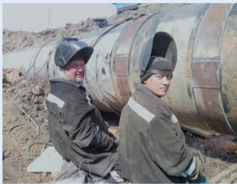
3 место в номинации «Производство», автор Александр Рубцов (УАВР-3)