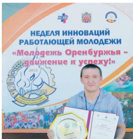
Молодежную организацию Бузулукского ЛПУ и ее лидера хорошо знают в Оренбургской области

— Участники круглого стола слушали с интересом. Польза таких сборов заключается в возможности обсудить накопившиеся вопросы, а в этом году нам удалось еще и поговорить на тему повышения эффективности труда и роли молодежи в