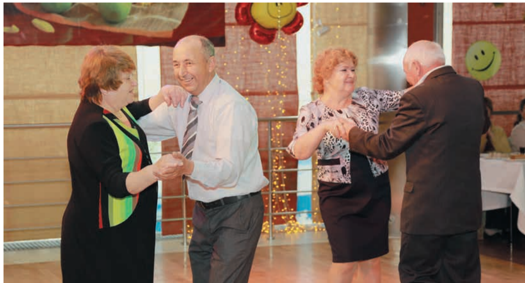
Ветераны всегда показывают танцевальный мастер-класс

Администрация Общества, объединенный Совет ветеранов, КСК «Олимп» и УООП с 1 по 3 октября принимали гостей-пенсионеров из екатеринбургских филиалов ГТЕ. 2 октября на званый обед с концертом и развлекательной программой пришли представители Малоистокского