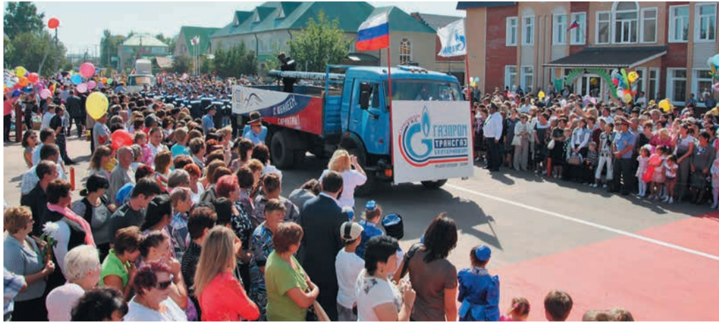
Сотрудники Саракташской ГКС стали почетными участниками парада

В сентябре поселок Саракташ отметил 100 лет с момента своего основания. По случаю юбилея на центральной площади прошли торжественные мероприятия, в которых приняли активное участие и трансгазовцы — сотрудники Саракташской ГКС.