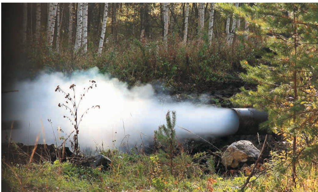
В Красногорском ЛПУ восстанавливают надежность газопровода, построенного в 1965 году

переставлять экскаватор вдоль газопровода, чтобы не заходить на нефтепровод, снова откапывать траншею и уже тогда врезать подготовленную трубу. Повезло еще, что все дефектные участки были прямыми, и нам не пришлось возиться с захлестами гнутых отводов в низине или на самой вершине горы.