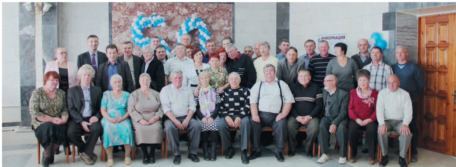
1 октября в Карталинском ЛПУ называют Днем ветерана