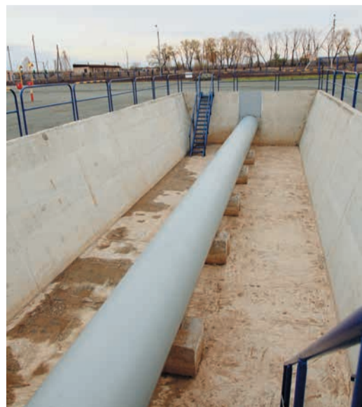
Для проведения практических занятий подземные участки газопровода выведены наружу в специальные бетонные «траншеи». Два прямых отрезка предназначены для отработки навыков по вырезке и врезке катушек, установке стальных разрезных и композитных муфт, вырезке и заварке технологических окон и установке ВГУ.