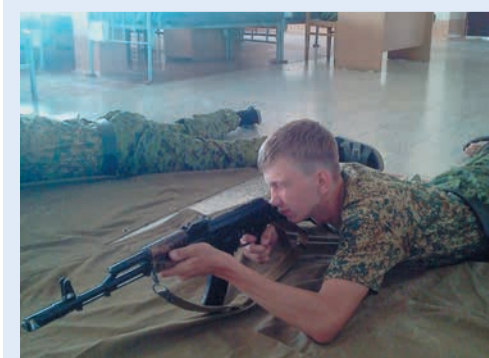
В военно-патриотическом лагере «Патриоты Зауралья» мальчишки поняли, почему фюнт солдатского лиха