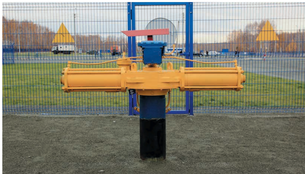
Во второй части полигона выстроена масштабная модель газопровода из труб Ду 400, Ду 500 и Ду 1000, позволяющая в точности воспроизводить различные работы по обслуживанию и ремонту линейной части. Безопасность обеспечивается за счет того, что в трубах циркулирует не метан, а сжатый воздух. На этом участке, к примеру, работники ЛЭС могут попрактиковаться в обслуживании линейного крана Ду 500.