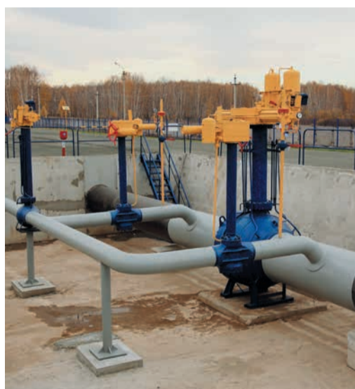
Техническое обслуживание крана Ду 1000 со свечной обвязкой. Проведение газовой резки и сборочно-монтажных работ на свечной обвязке Ду 300.

Кроме вышеперечисленного, учащиеся на Смолинском полигоне смогут отработать навыки проведения неразрушающего контроля сварных стыков и изоляционных покрытий, научиться определять толщину стенок трубы и правильно подбирать переходные кольца, вручную наносить различные виды изоляционных покрытий, в том числе на сложные элементы газопровода. И это еще не все. Рядом с макетом линейной части газопровода располагается еще одна учебная площадка. На этом участке, в первую очередь, будут оттачивать свои профессиональные навыки машинисты экскаваторов и бульдозеров. Уложенный в землю трубопровод позволяет отрабатывать операции по откапыванию трубы и обратной засыпке траншеи. Также здесь можно выполнять практические занятия по ручной шурфовке газопровода.