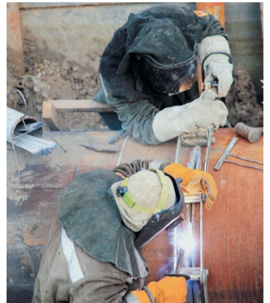
Когда траншея была готова, когда метанометры показали «ноль», когда труба была обработана, а катушка установлена, за дело взялись сварщики

какой-либо дефект. Следом изолировщики восстанавливали изоляцию, и бригада переходила к следующему дефектному участку. Уже ко 2 августа были полностью отремонтированы и подключены четыре шлейфа, а вот пятый, тот, что значится на станции под номером «восемь», потребовал особого внимания.