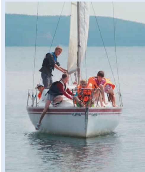
В школе Конюхова ребята постигали основы яхтинга и получили право называться юнгами