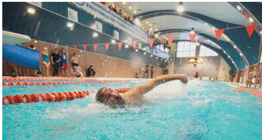
Обе возрастные категории у женщин, а также мужчины-«ветераны» преодолевали 50 метров, а вот младшей мужской группе пришлось плыть дистанцию в два раза длиннее

то плывет брассом, кто-то — на спине, но больше шансов, безусловно, у тех, кто владеет кролем.