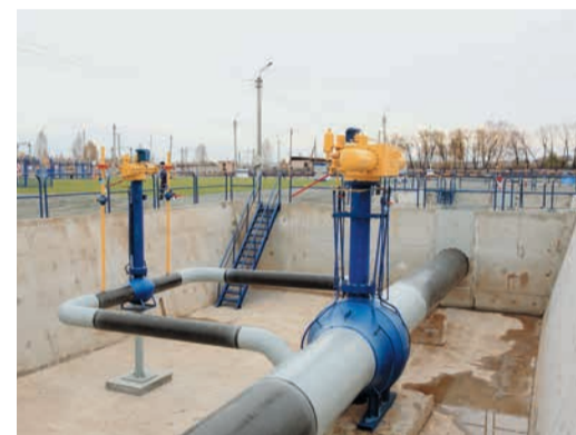
Площадка для отработки газовой резки и сборочно-сварочных работ при монтаже и врезке линейного крана Ду 1000 с байпасом, включая возможность отдельной вырезки и врезки байпасного крана Ду 300.