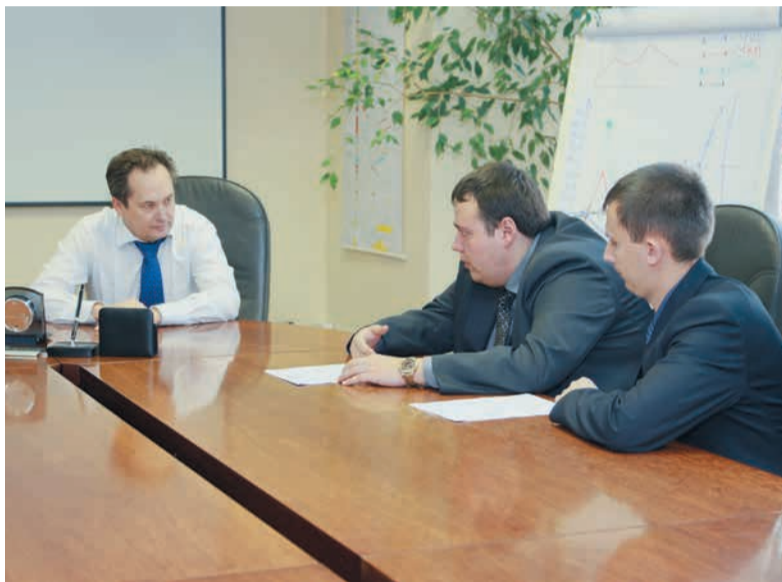
Уральские газовики тщательно готовились к аккредитации, и эксперты ВНИИР (справа) пришли к выводу, что в ГТЕ — образцовая метрологическая служба