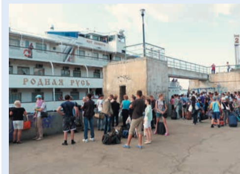
Путешествуя на теплоходе «Родная Русь», дети изучали отечественную историю