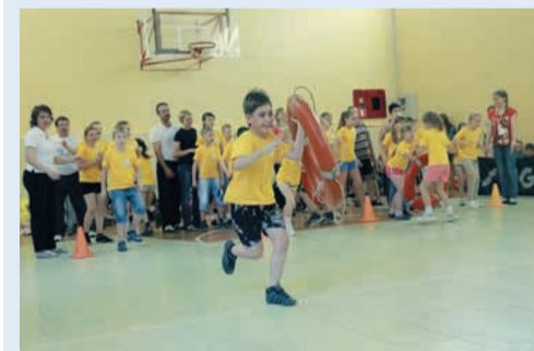
Новинка «прометеевского» сезона — конкурс спортивных семей