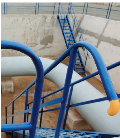
Отработка навыков по монтажу и врезке отвода.