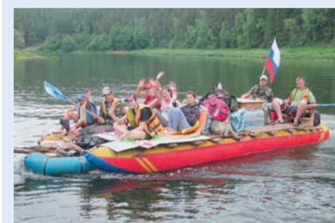
У сплава по реке есть свои законы, их ребята изучали в Манчаже