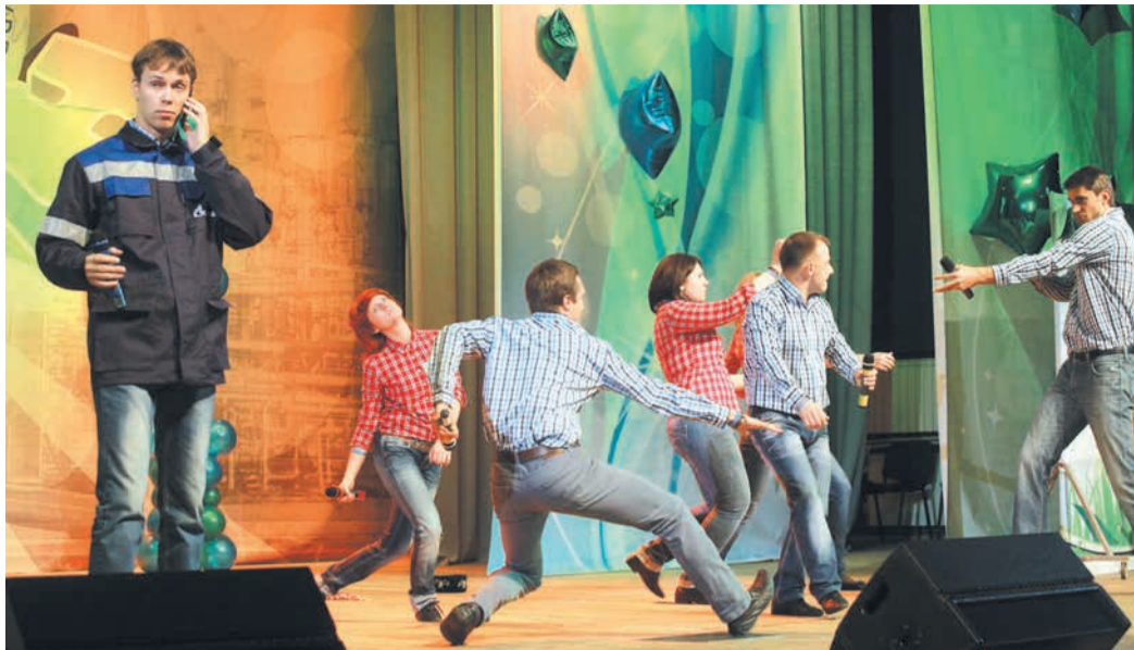
В «13-й зарплате» переполох — прибыла очередная проверка сверху

И первый же конкурс, «визитка», преподнес сюрприз. Высшую оценку в нем заслужили дебютанты финала, ребята