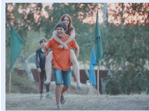
Спортивно-туристический слет стал раем для любителей активного отдыха