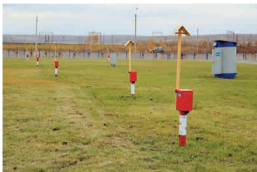
Сразу за входом открывается зеленая лужайка размером с футбольное поле, на которой стоят станции катодной и дренажной защиты, две учебные линии электропередачи и участок однопутной железной дороги, ведущий из ниоткуда в никуда. Под землей, невидимый глазу, расположен макет газопровода. Здесь работники служб защиты от коррозии могут оттачивать навыки обслуживания и ремонта объектов ЭХЗ, включая вдоль-трассовые ЛЭП, учиться защищать газопровод от блуждающих токов, «стекающих» с макета железной дороги, практиковаться в поиске мест повреждения изоляции.

В прошлом номере «Трассы» мы совершили небольшую экскурсию по уникальному комплексу производственных мастерских, разместившемуся на территории Челябинского отделения УПЦ. Тренажеры-имитаторы магистрального газопровода, газовой котельной, ГРС и других объектов газовой инфраструктуры позволяют с большой эффективностью проводить обучение и повышать квалификацию рабочих. Однако, кроме эксплуатации газопроводов, Обществу приходится уделять большое внимание и вопросам ремонта. Сегодня мы приглашаем наших читателей пройтись еще по одной учебной площадке, открывшейся в этом году — полигону технологического оборудования близ станции Смолино Челябинской области. Административные здания на въезде еще достраивают, но «учебные пособия» уже готовы встретить первые группы обучающихся.