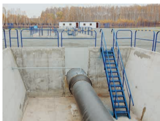
Участок для отработки навыков оценки технического состояния перехода через автодорогу, определения наличия электрического контакта между трубой и патроном, ремонта трубы и патрона вместе и по отдельности.