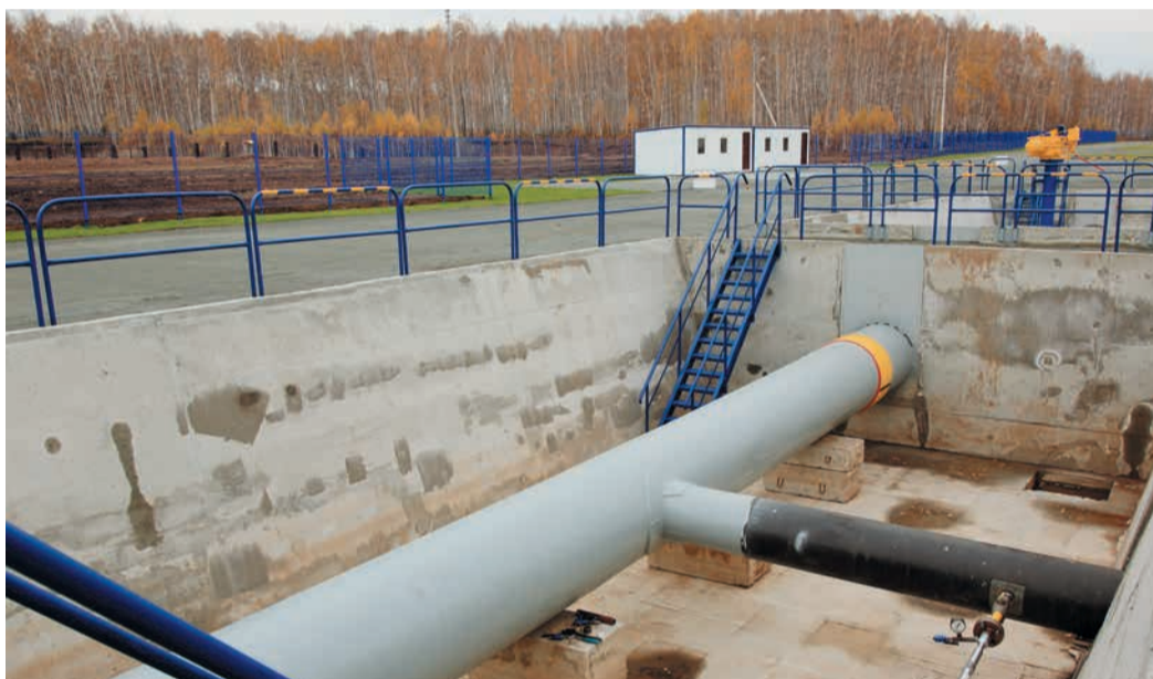
Площадка для отработки технологии вырезки и врезки тройника Ду 1000/500.