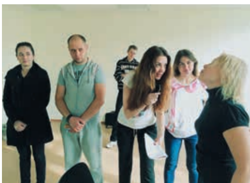
S7 настраивается на волну юмора

Буквально завтра, 25 октября, состоятся все три зональные игры КВН сезона 2014 года, которые проходят под девизом «Культура не знает границ». Заявки на участие подали три команды в Челябинской зоне (Челябинская и Курганская области), пять дружин — в Оренбургской, а самая напряженная борьба ожидается в Свердловской зоне: сразу шесть команд будут вести борьбу за путевку в финал в Екатеринбурге.