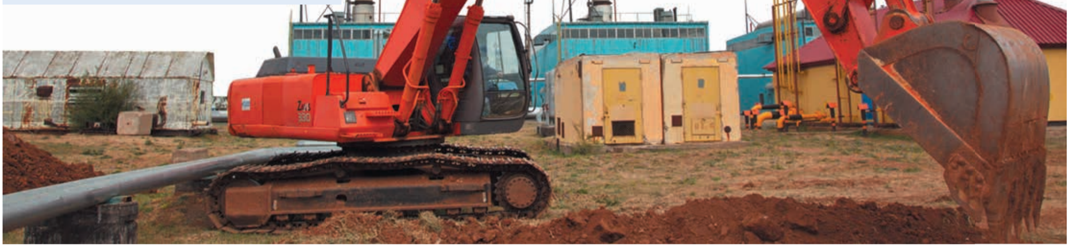
Ковш экскаватора осторожно раскапывает 36-летнюю историю первого компрессорного цеха газопровода «Союз»

Эти трубы пролежали под землей 36 лет, пропустив миллиарды кубометров природного газа — горячего, оренбургского, только-только прошедшего очистку на газзаводе. В 1979-м они стали отправной точкой первого трансконтинентального экспортного газопровода «Союз», и сегодня входные и выходные шлейфы головного КЦ Оренбургского ЛПУ находятся в центре внимания сразу двух УАВР и двух линейных управлений — их работники задействованы в комплексе работ по ремонту изоляции.