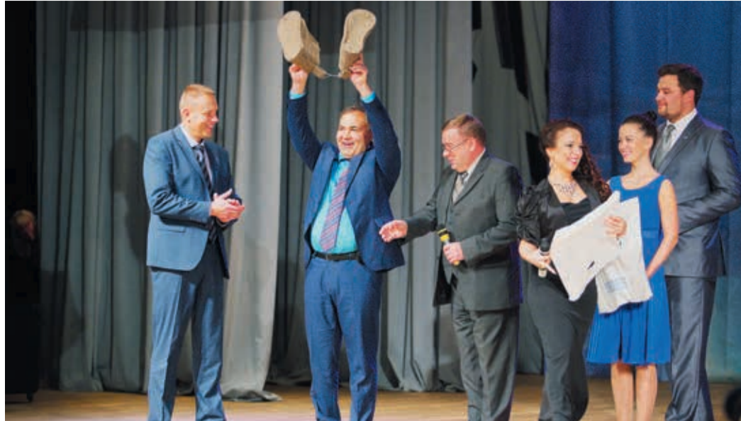
Юбилей — хороший повод для теплых воспоминаний и веселых шуток

— Таких УАВР, как у нас, я считаю, нет больше нигде в Газпроме, — обращается