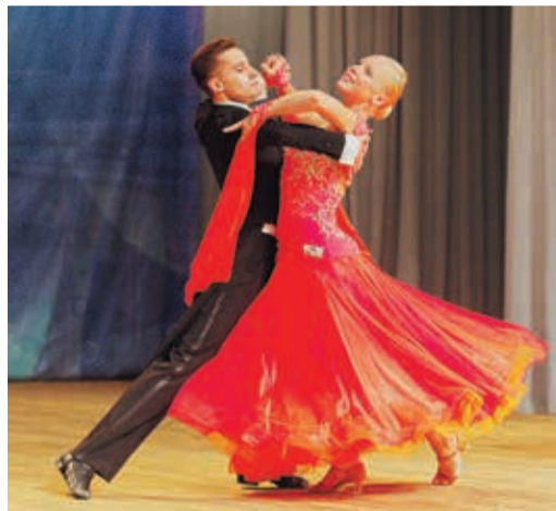
Гвоздь праздничной программы — выступление артистов КСК «Олимп»