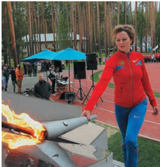
Знаменитая бегунья Ольга Котлярова давно дружит с уральскими газовиками

Чемпионка мира и Европы по легкой атлетике, призер Олимпийских игр, экс-чиновница, а ныне — директор благотворительного фонда Ольга Котлярова стала почетной гостьей VI летней Спартакиады ГТЕ. Именно прославленной бегунье было доверено зажечь факел трансгазовских Игр. Она стала гостьей спортивного форума и редакции нашей газеты.