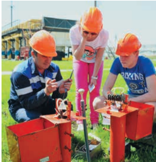
Секреты ЭХЗ ребятам приоткрыли хозяева «загадочных красных ящиков»

«Газовый квест» продолжался несколько часов. Затем школьники и организаторы игры сели за круглый стол, чтобы обсудить все плюсы и минусы та-