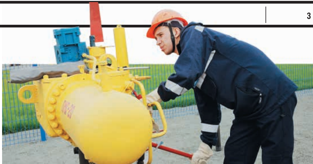
Одним из практических этапов конкурса стала перестановка шарового крана Ду 500

— Полигон технологического оборудования полностью имитирует газовую магистраль, и мы впервые попытались внедрить в конкурсную программу работы по ведению ремонтных работ непосредственно на линейной части. Начали с небольших диаметров, но постепенно будем двигаться от малого к большому, от простого — к сложному. И следующий смотр, возможно, будет организован в котловане, где расположены трубы Ду 1000. Там в одиночку с термоусадочной манжетой уже не справиться, поэтому участники начнут работать бригадой. Так условия конкурса станут еще ближе к реальной работе, а значит, мы сделаем еще один шаг вперед.