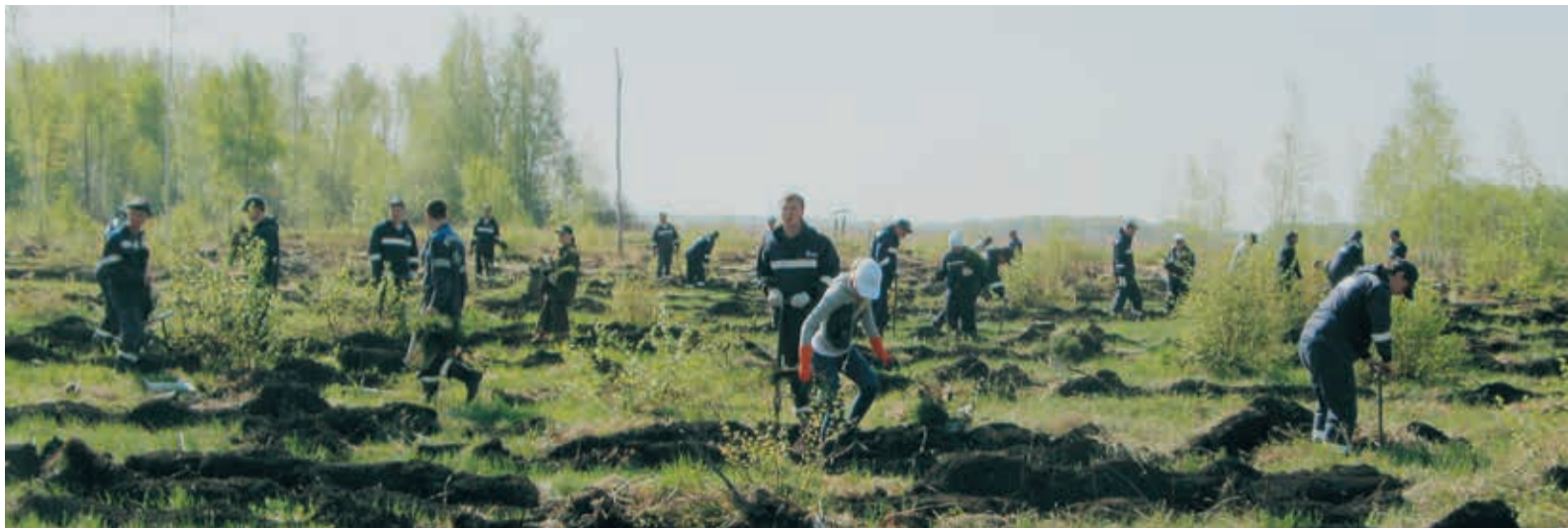
Уже через десять лет в Далматово появится молодой лесок — сосны растут быстро

В рамках Года экологической культуры, объявленного ОАО «Газпром», 15 мая в Далматовском ЛПУ прошел День посадки леса. Газовики постарались на совесть, высадив более восьми гектаров молодых сосенок.