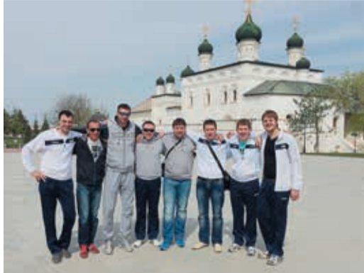
Уральские газовики-волейболисты в Астрахани не только посетили местный Кремль, но и порыбачили с городской набережной

В конце апреля в Астрахани состоялся IX Открытый всероссийский турнир по волейболу среди команд дочерних предприятий и организаций ОАО «Газпром». В соревнованиях принимали участие 8 мужских и 4 женских коллектива. Впервые добралась до берегов Волги и мужская сборная ГТЕ.