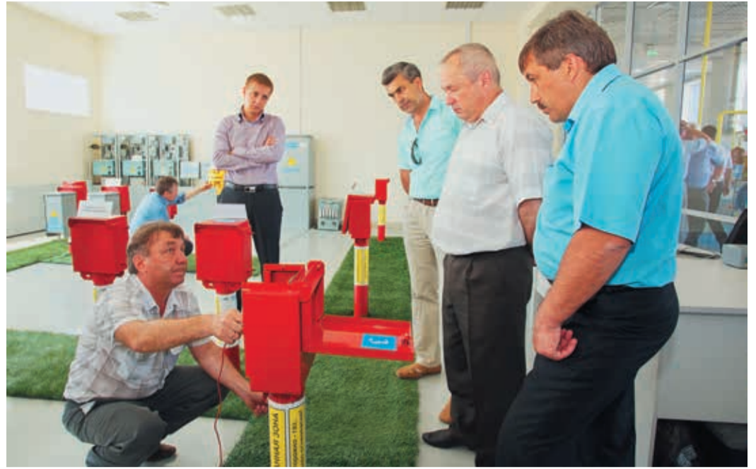
«Изюминкой» Совета стала экскурсия по уникальным учебным корпусам Челябинского отделения УПЦ

Далее речь зашла о промышленной безопасности. В частности, было указано на недопустимость ставить весь технологический процесс в зависимость от узкого круга «священных». Так, на КС и машинисты, и диспетчеры должны в совершенстве знать всю технологическую обязанность компрессорных цехов, чтобы в случае ЧП уметь четко ло-