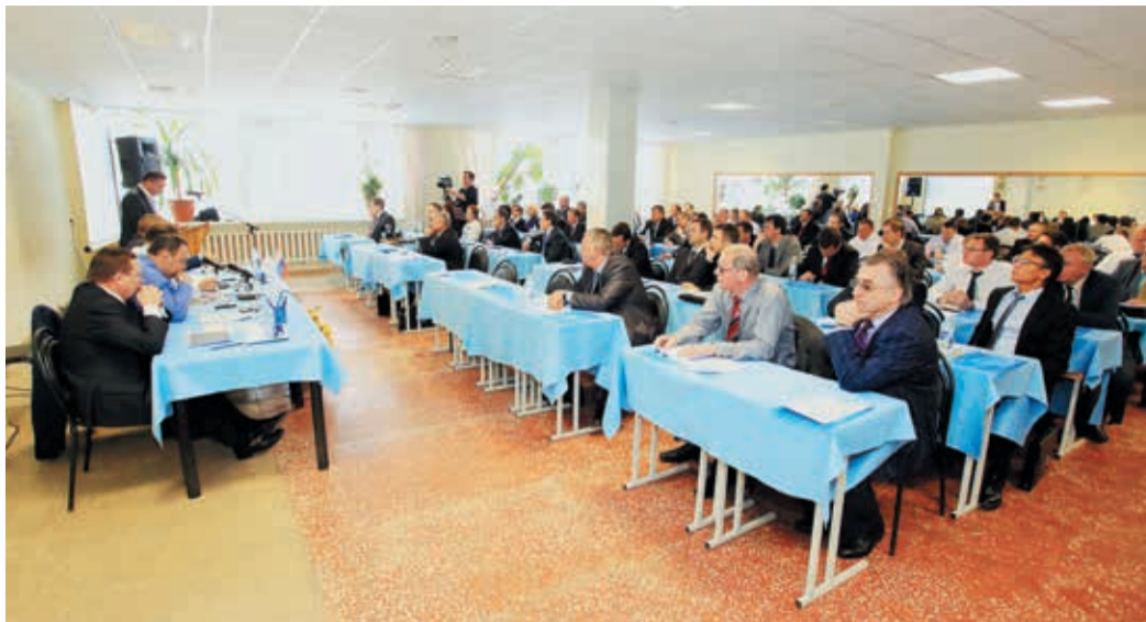
На расширенное заседание собрались руководители всех филиалов и производственных отделов ООО «ГТЕ»

Перед майскими праздниками на базе отдыха «Прометей» состоялось заседание Совета руководителей ООО «Газпром трансгаз Екатеринбург». По традиции, на этом мероприятии подводятся окончательные итоги работы предприятия за минувший год и ставятся основные задачи на ближайший период.