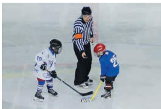
Внимание, клюшки на лед!

В турнире приняли участие четыре клуба: «Юность», «Фотон», «Искорка» и команда ДЮСШ №12, которую в Трансгазе по праву считают своей родной. Дело