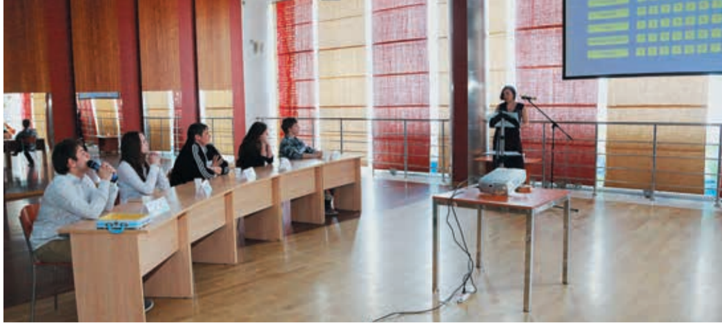
Главная задача любого эрудита — мгновенно найти ответ на вопрос

27 апреля в КСК «Олимп» дети сотрудников ГТЕ сразились в интеллектуальной игре «Эрудит». Напомним, что это соревнование среди выпускников школ и лицеев за право учиться в профильных вузах за счет предприятия. На игру приглашаются ребята, которые набрали наибольшее количество баллов на первом этапе, в олимпиадах по школьным предметам.