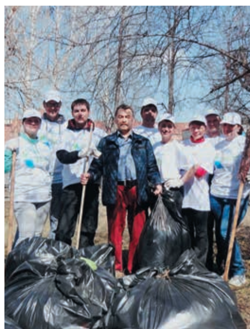
Сотрудники Невьянского ЛПУ привели в порядок Аллею славы

становить, а для начала – очистить от мусора. Только газовики вывезли порядка пятидесяти мешков, набитых ветками, прошлогодней листвой, металлом и пластиком – этого «добра» здесь накопилось порядочно. Но участники субботника считают, силы не зря приложили: для себя старались и для своих детей, у которых появился новый уголок для прогулок. Дети, к слову говоря, в меру сил помогали родителям и пообещали, что бумажку мимо урны не бросят. Ведь так здорово, когда вокруг чисто!