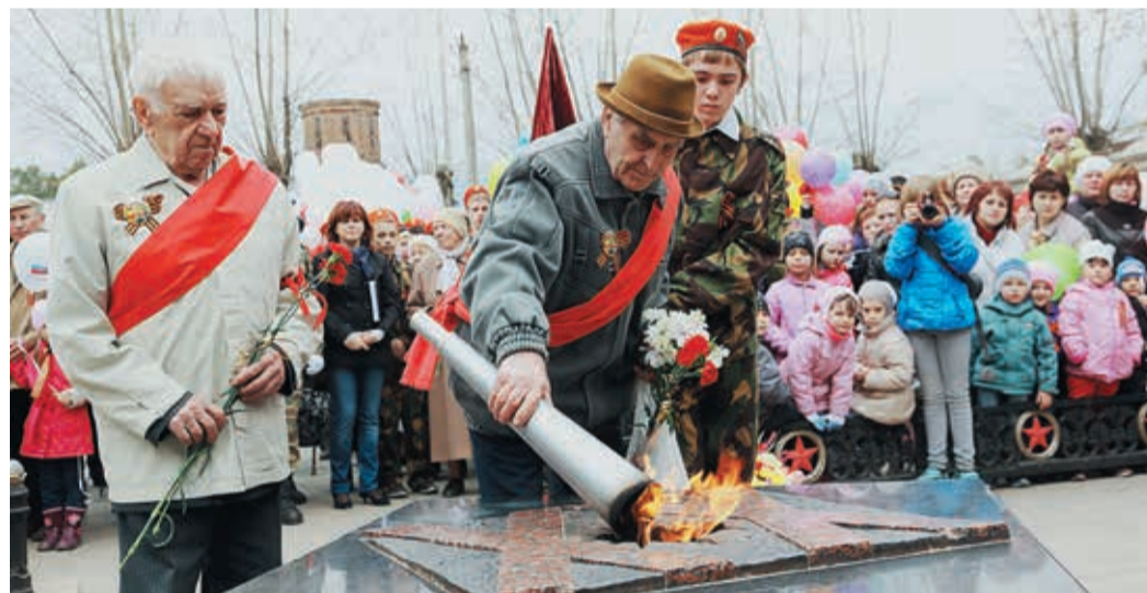
Два самых торжественных мгновения митинга — вспыхнул огонь Победы, и алые гвоздики легли у подножия обелиска героям войны

Так было и в этот раз. Праздничная колонна прошла по главной улице. Впереди — автомобиль с ветеранами, за парадным экипажем — колонна участников патриотической акции «Бессмертный полк», жители микрорайона. Песни военных лет, яркие шары и много алых гвоздик — цветов, которые для каждого русского человека давно стали символом великого праздника.