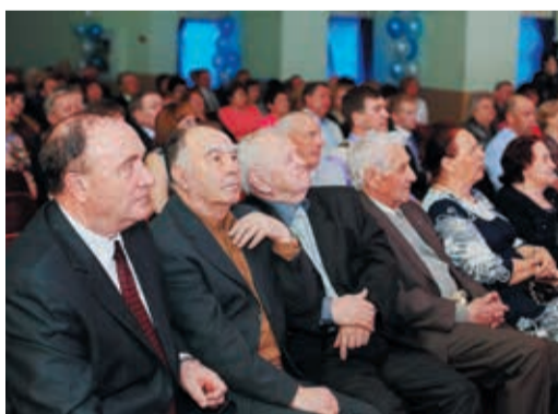
В зале собрались люди, которые «делали» историю предприятия и профсоюзной организации ГТЕ