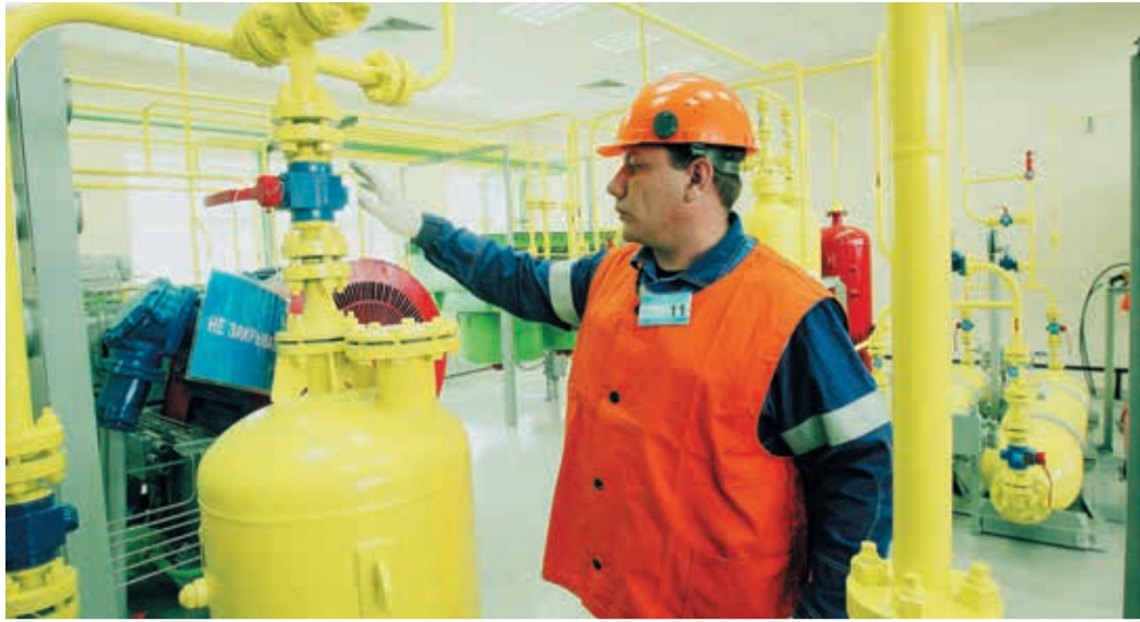
Все участники конкурса в один голос отмечали, как удобно состязаться в обновленном Учебном центре