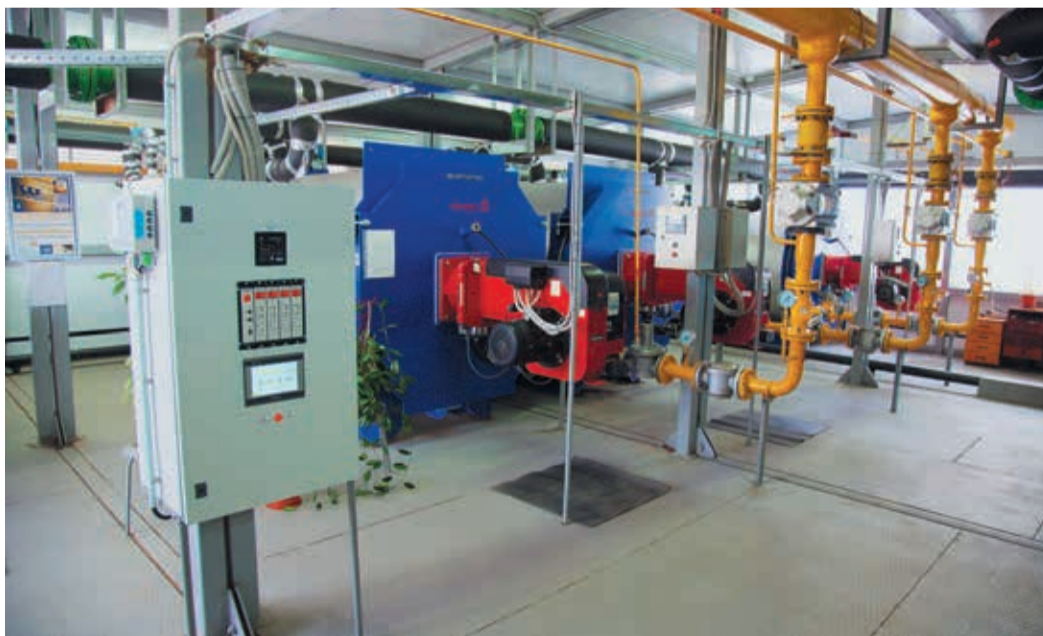
Новая котельная на главной площадке УАВР-2 и чище, и уютнее, и удобнее в обслуживании

Старое оборудование газовой котельной было введено в строй почти двадцать лет назад и за прошедшие десятилетия успело морально устареть. Его замена была вопросом времени, и вот она состоялась. В первые недели осенне-зимнего отопительного сезона, пока не были настроены все контроллеры, котельной пришлось управлять