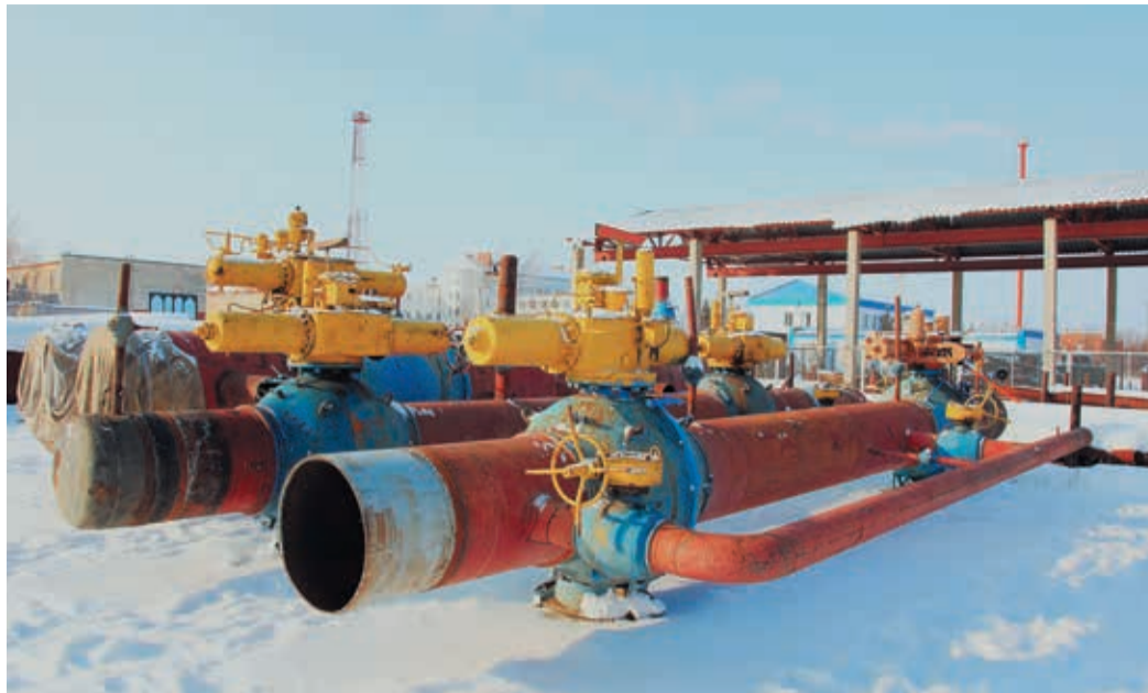
Временные камеры приема/запуска обследованы, испытаны и готовы отправиться на трассу

А мы идем дальше. Напротив камер приема-запуска, посреди снежного пятка, стоит конструкция, напоминающая то ли паровозный котел, то ли подводную лодку. Это еще одна разработка УАВР-1 — стенд для аттестации специалистов по сварке стальных муфт. Совсем недавно здесь прошло практическое упражнение очередной группы сварщиков, приехавших из других филиалов. Теперь участки новой муфты вместе с основной трубой вырезаны для