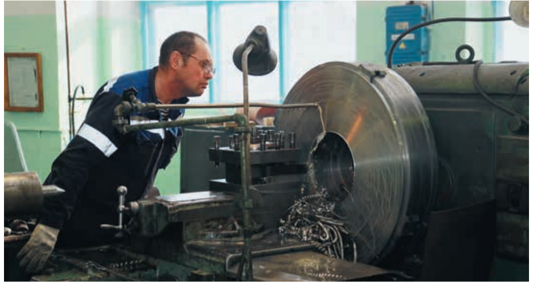
За последние годы в состав УМТСиК вошло несколько производственных участков, так что Управление теперь не только снабжает и комплектует, но еще и производит