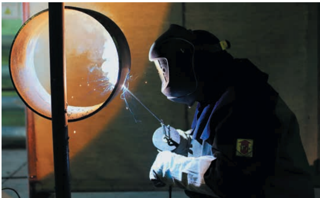
Молодые сварщики варят допускные стыки — «набивают руку» перед работой в траншее