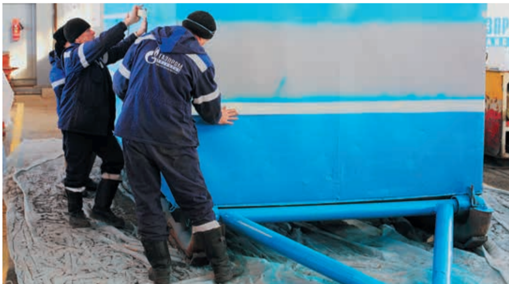
Широкие синие полосы уже украсили вагончик-«бытовку», осталось добавить белого

проведения механических и радиографических испытаний в лаборатории УАВР-1.