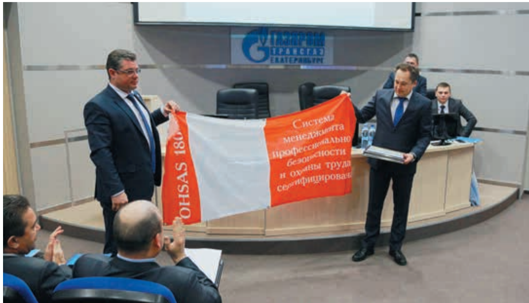
Работа Общества по продвижению Системы менеджмента профессиональной безопасности и охраны труда получила высокую оценку

В начале февраля в Екатеринбурге состоялось очередное заседание Совета главных инженеров ООО «Газпром трансгаз Екатеринбург». Были подведены итоги прошлого года, поставлены цели и задачи на 2014-й. Кроме того, Обществу был торжественно вручен сертификат Системы менеджмента в области профессиональной безопасности и охраны труда.