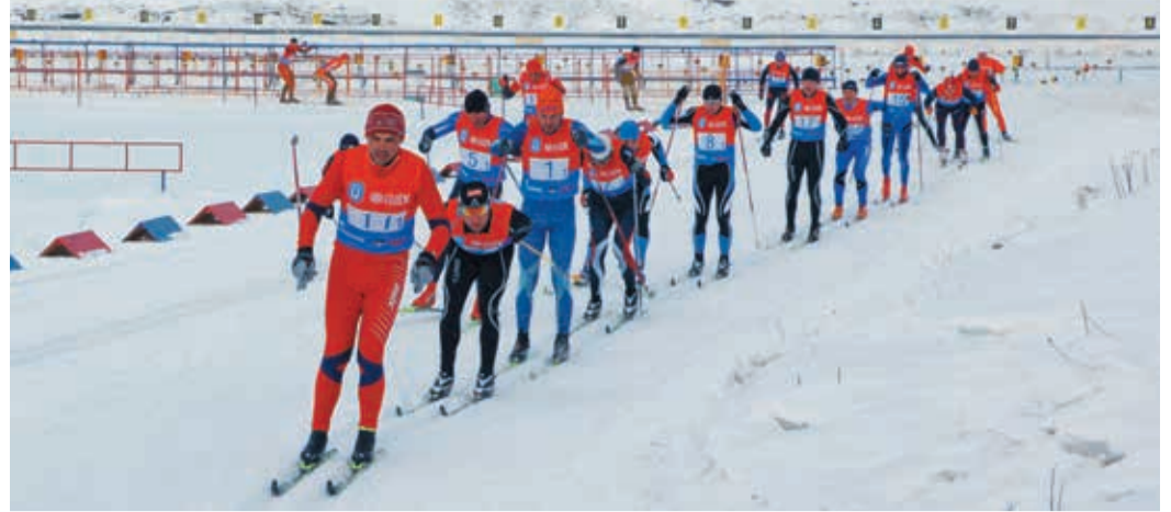
Два года назад уральские лыжники достойно представили Общество на зимней Спартакиаде Газпрома

В отличие от летних спартакиад зимние достижения спортсменов Общества