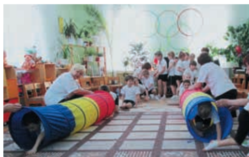
Кто знает, быть может среди этих ребятшек — будущие олимпийские чемпионы

ми дети изготовили «медали для чемпионов» и с удовольствием вручали их самым спортивным «олимпийцам». Пока в Сочи бились за победу спортсмены со всего мира, в маленьком поселке за ними следили будущие чемпионы. Детишки не только обменивались впечатлениями о выступлениях любимых спортсменов, но выучили спортивные песни и посмотрели тематические мультфильмы. Финалом малой олимпиады стали веселые соревнования, в которых приняли участие ребята вместе со своими папами.